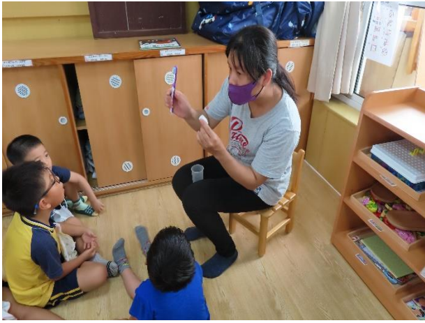
說明：老師教導幼兒如何使用牙刷和牙膏