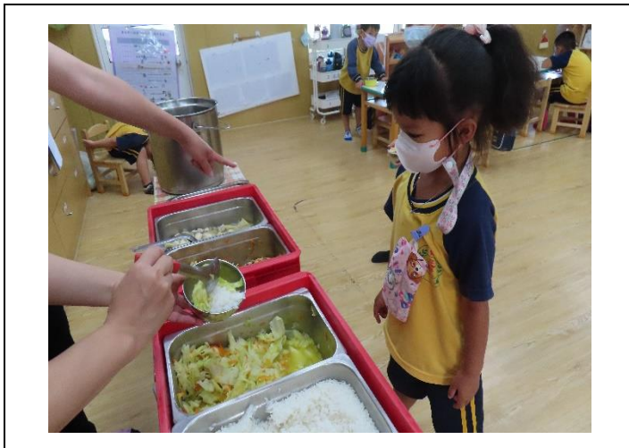
說明：提供營養均衡的午餐，鼓勵幼兒多吃青菜、豆魚蛋肉類，維持每日所需。