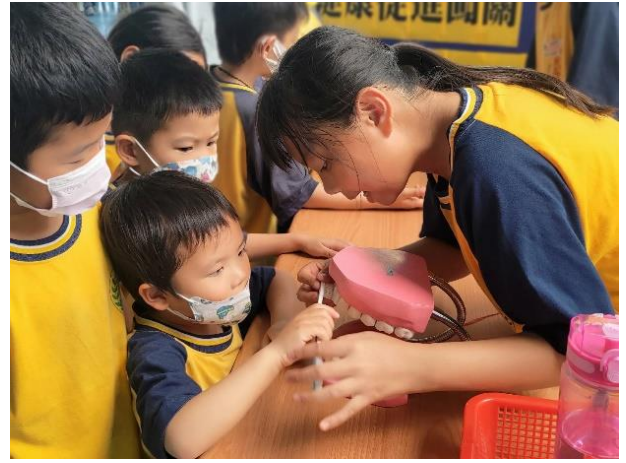
說明：國小學生教導幼兒如何正確刷牙