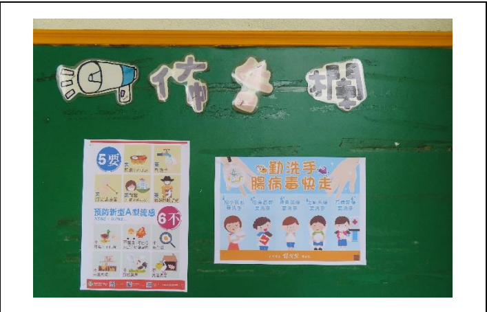
說明：張貼衛教宣導海報於佈告欄，供家長、幼兒閱讀、參考。