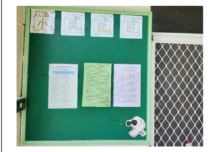
說明：在佈告欄公告每月菜單