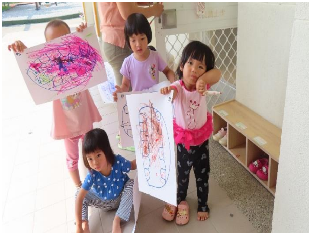
說明：老師帶領幼兒認識口腔並作畫