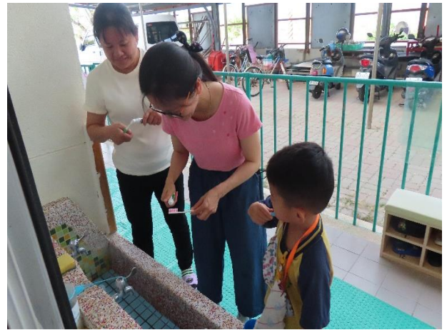
說明：老師與幼兒每天飯後潔牙