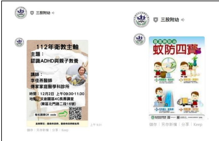
說明：在家長 Line 群組進行衛教講座分享以及衛教宣導。