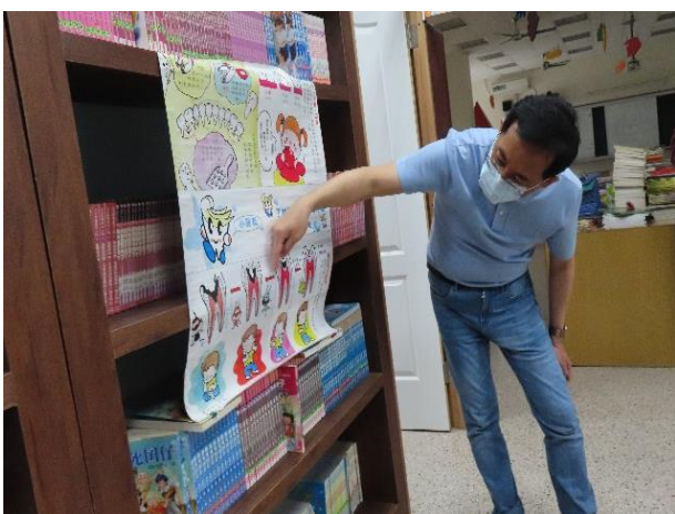
說明：牙醫師來校宣導口腔保健知識