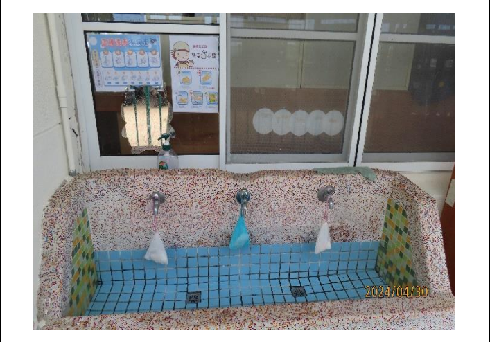
說明：在洗手台貼「洗手步驟圖」衛教宣導海報