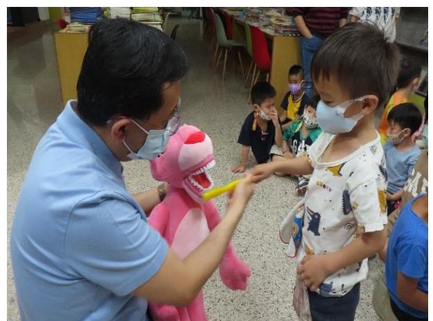
說明：牙醫師教導幼童正確刷牙方式