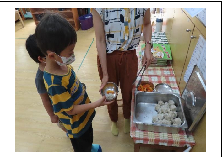
說明：每日提供多元豐富的點心，並搭配水果，補充各種營養所需。