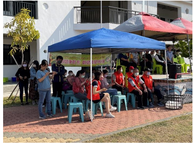
說明：親子樂活運動會邀請七股區公所、里長、家長會會長、地方立委、議員代表、七股區校長、佳里榮家等社區人士參加