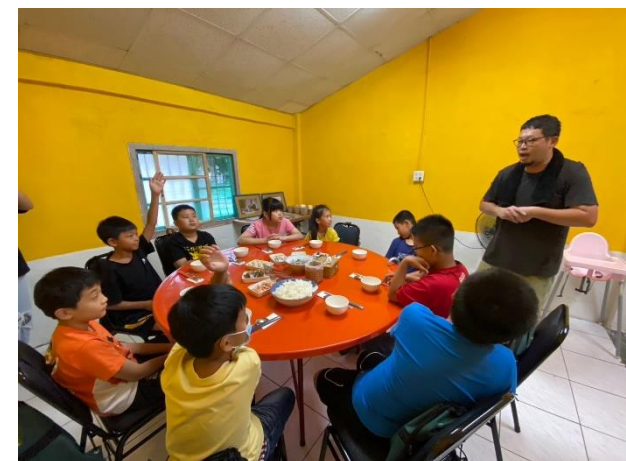
說明：商請社區在地特色餐廳「伙淡」老闆，配合食魚教育到餐廳實地進行虱目魚由魚塢到餐桌的過程教學，實際親手體驗由活魚處理各部位到做成餐桌料理