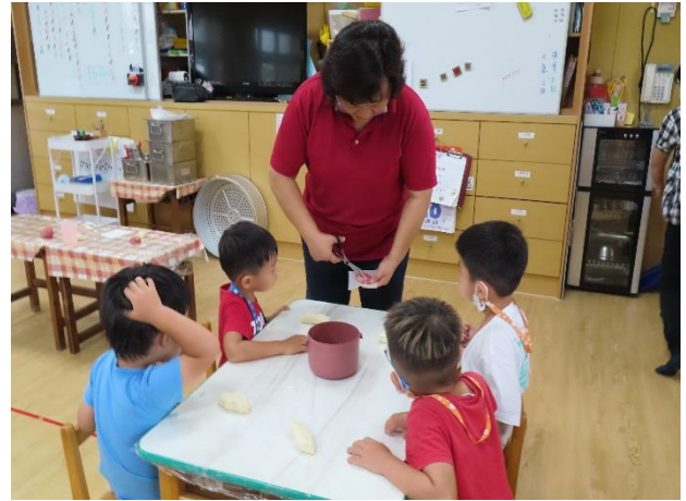
說明：邀請嗎哪專業幼兒餐館老闆到校應中秋節活動指導幼兒製做低糖玉兔包