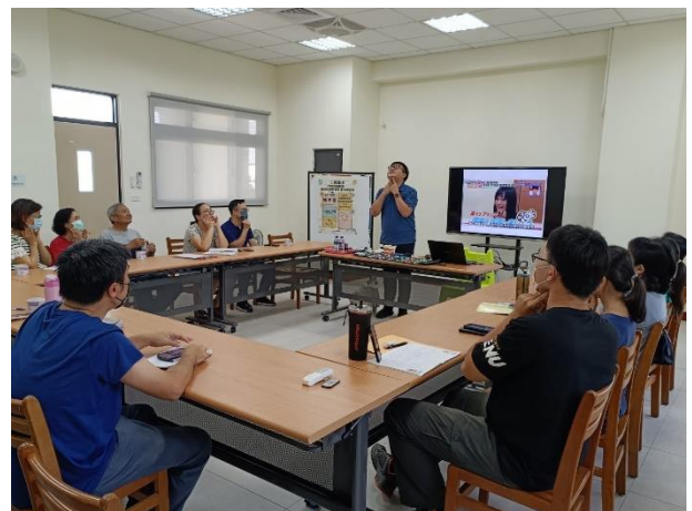
說明：口腔保健教師增能研習邀請社區安親班、早餐店、里長、社區代表參加