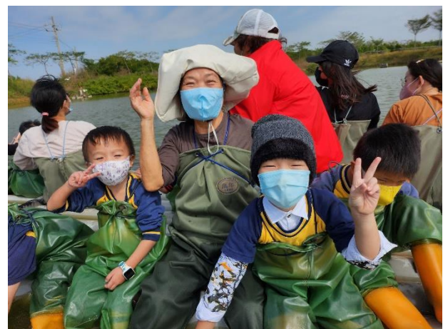
說明：邀請幼兒園家長一同參加幼兒園辦理的安南輕旅行-台江小小漁夫體驗