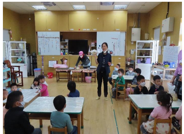
說明：邀請幼兒園家長(阿嬤)烘焙高手到校為幼兒指導製做低糖健康麵包及司康