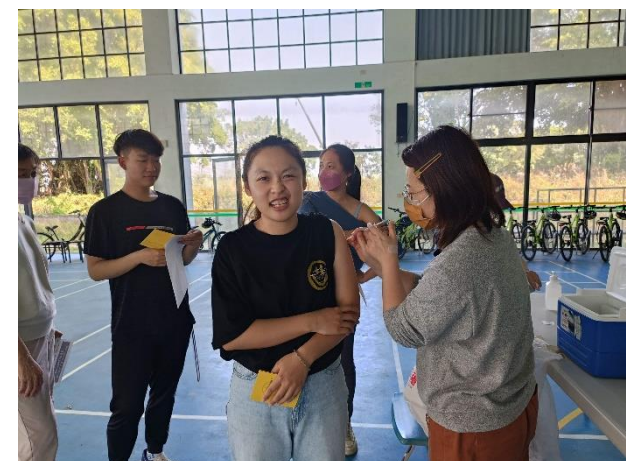
說明：七股衛生所醫護團隊到校幫學生及教職員 接種 COVID-19 XBB 莫德納疫苗