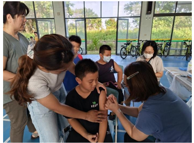
說明：七股衛生所醫護團隊到校幫學生及教職員接種流感疫苗