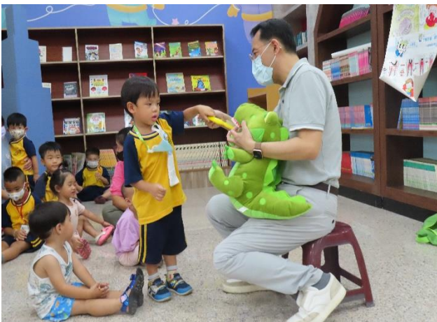
說明：幼兒園學生口腔保健及潔牙衛教