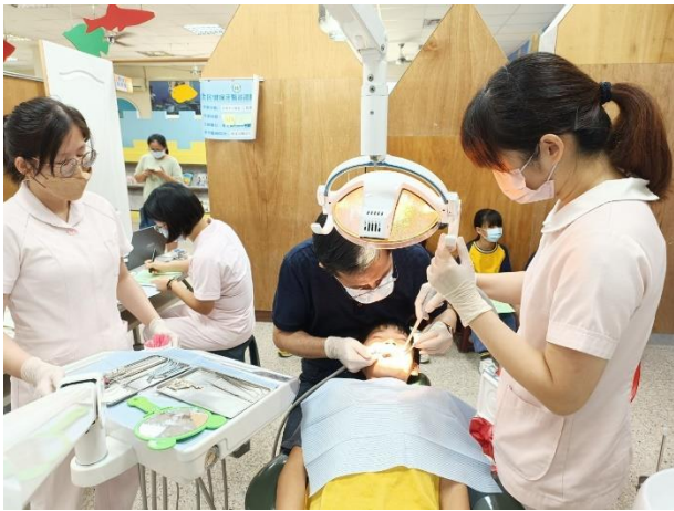
說明：國小學生每半年一次口腔健康檢查