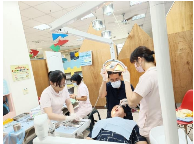
說明：教職員每半年一次洗牙服務