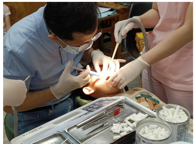
說明：國小學生萌出第一大白齒窩溝封填服務