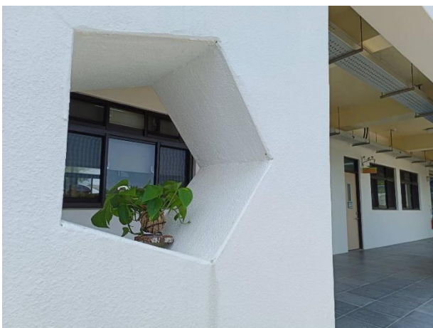
說明：有生命溫度的小植栽妝點北棟校舍五角窗