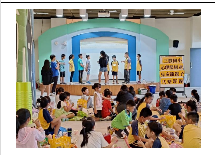
說明：學生快樂的分享帶來的水果、點心