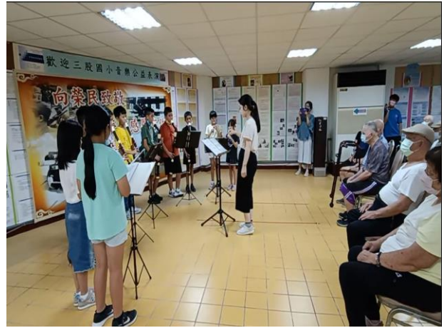
說明：感謝英國志工來台灣與三股國小學生一起到佳里榮家進行音樂公益表演