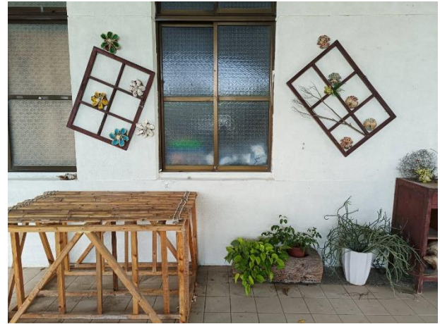
說明：幼兒園辦公室外牆美學佈置