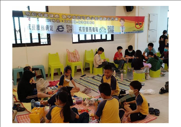
說明：學生快樂的分享帶來的水果、點心