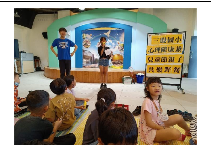
說明：兒童節野餐日活動流程