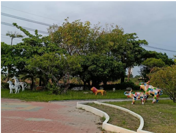
說明：校園前庭動物亮眼彩繪