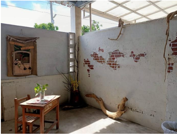
說明：與西側門一牆之隔的寧靜角落