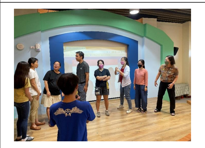
說明：邀請學生上臺參與遊戲