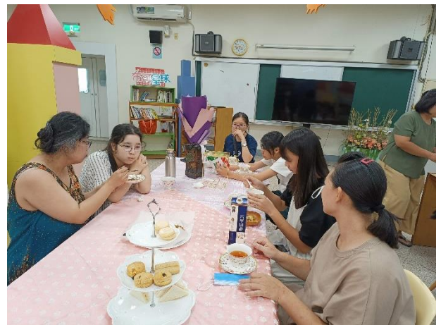
說明：有英國帶來的甜點及老師、學生一起自製的司康、三明治