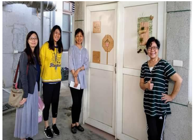
說明：美學老師的作品佈置美化多功能教室門