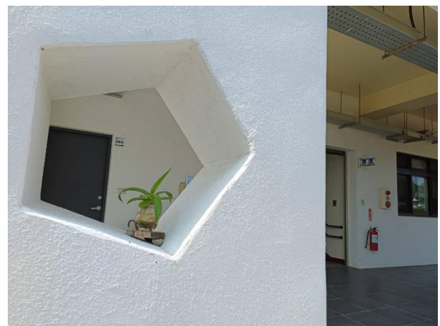
說明：有生命溫度的小植栽妝點北棟校舍五角窗