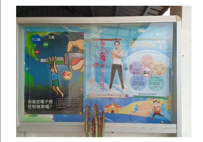
說明：校園西側門口家長接送區張貼菸害防制海報