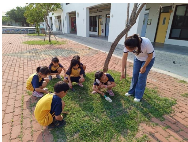
說明：老師指導學生挖除樹下雜草