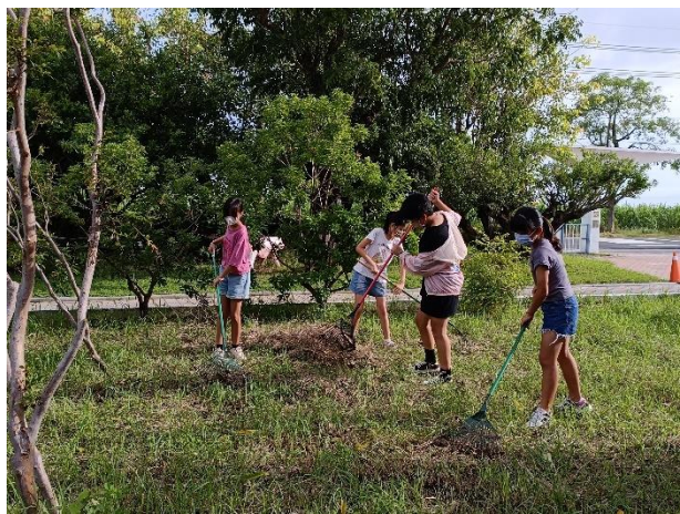
說明：風災後學生幫忙除乾草雜草維護校園草皮