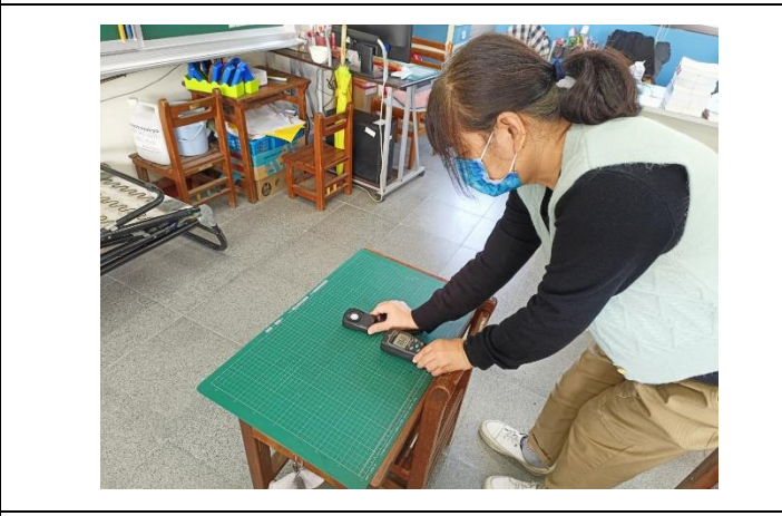
說明：教室桌面照度測量