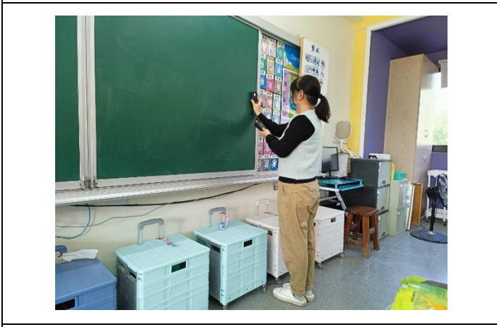
說明：教室黑板照度測量