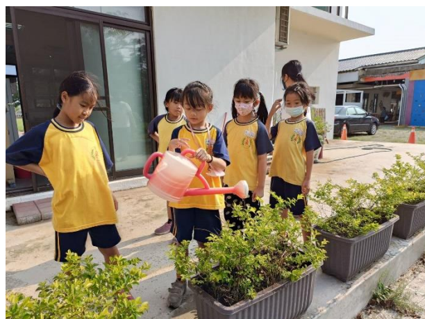
說明：學生幫忙校園盆栽澆水工作