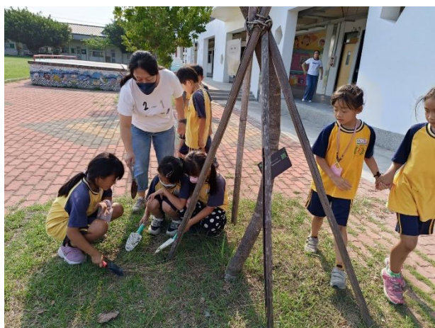
說明：老師指導學生挖除樹下雜草