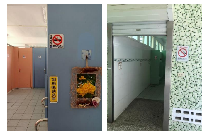
說明：校園廁所出入口禁菸標誌