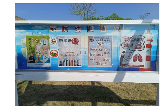
說明：校園衛教走廊櫥窗張貼菸癮防制海報