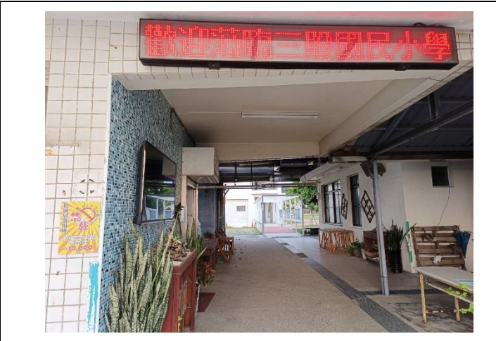
說明：校園西側門口家長接送區禁菸標誌