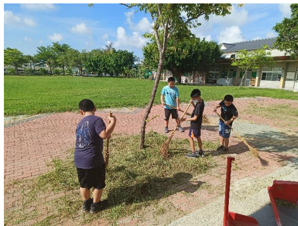
說明：風災後學生幫忙除乾草雜草維護校園草皮