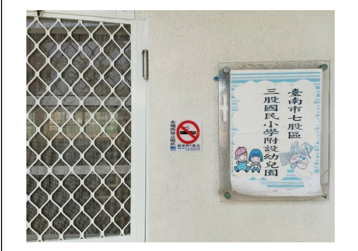
說明：幼兒園教室門口禁菸標誌