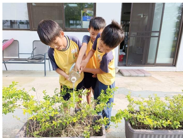
說明：學生幫忙校園盆栽澆水工作