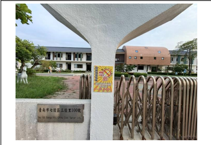
說明：校園大門口禁菸標誌