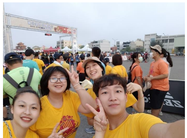
說明：教師利用假日組隊參加鹿耳門路跑(隊名:三股騷辣)