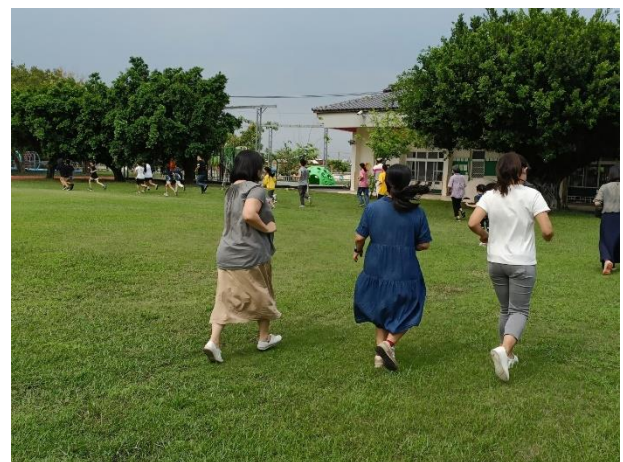
說明：教職員在校實踐健康行為-校長、教職員課間時間在操場與學生一起進行大跑步運動