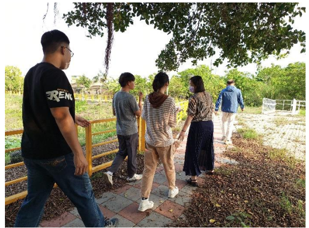
說明：教職員在校實踐健康行為-利用下班後步行至學校東側蓮花池步道進行健走運動