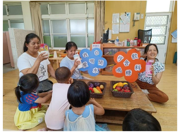
說明：國小教職員在校實踐健康行為-沒事多喝水，少喝含糖飲料手搖飲