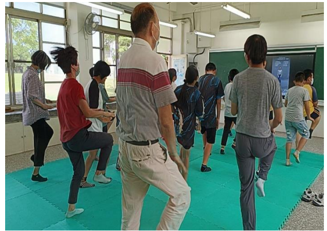
說明：教職員在校實踐健康行為-課間時間一起舞動肌力健康人生