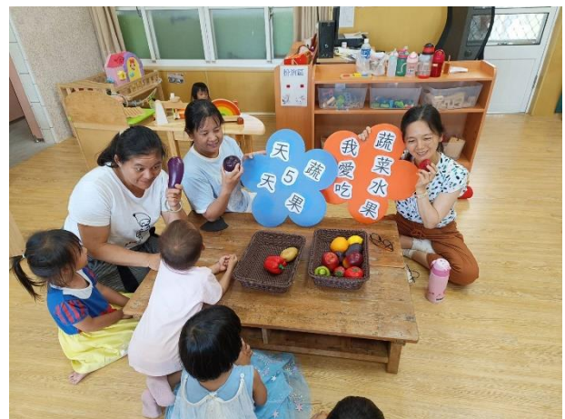
說明：國小教職員在校實踐健康行為-沒事多吃蔬果，每天3蔬2果喔！