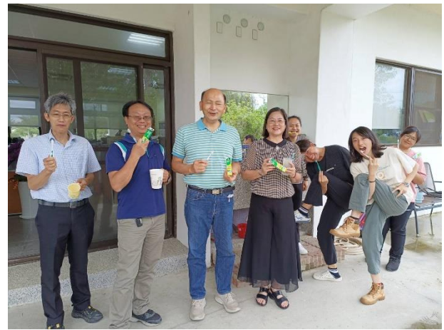
說明：教職員在校實踐健康行為-校長與老師、職員餐後使用含氟牙膏刷牙