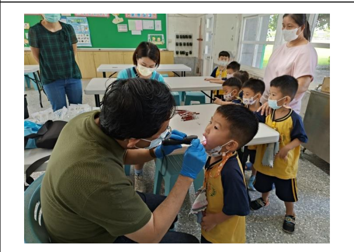
說明：潔牙小達人—全口潔牙指導