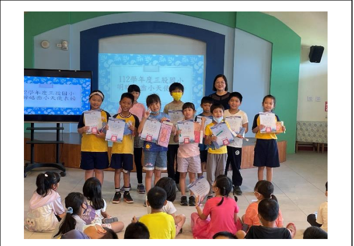
說明：口腔保健-皓齒小尖兵頒獎