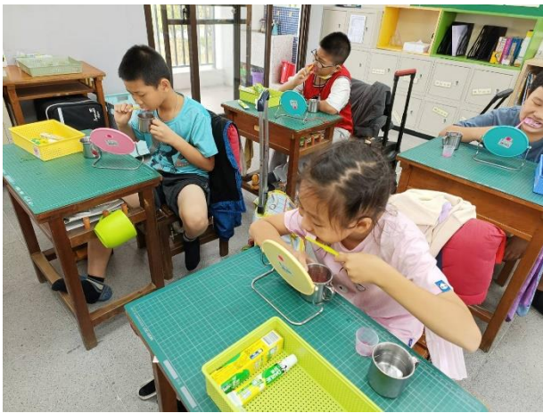
說明：中午餐後潔牙一邊觀看潔牙影片一邊潔牙