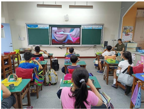
說明：老師指導貝式刷牙法潔牙步驟