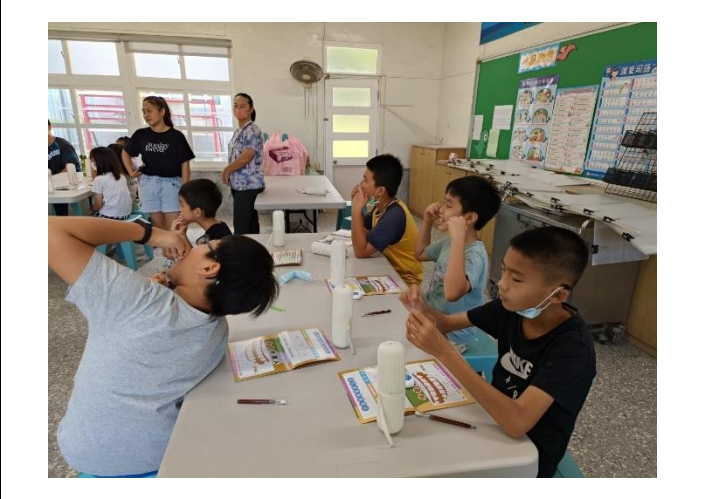
說明：潔牙觀摩—刷牙指導