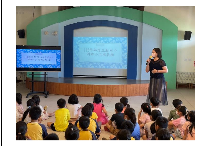
說明：明眸小名模、皓齒小尖兵及雙項小天使