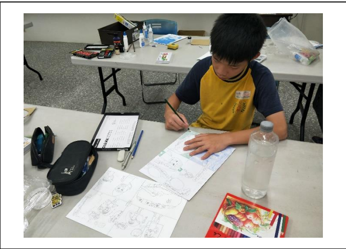
說明：活動公文及由美術社團學生報名參加