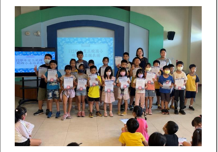
說明：校長鼓勵得獎學生期望能為全校楷模