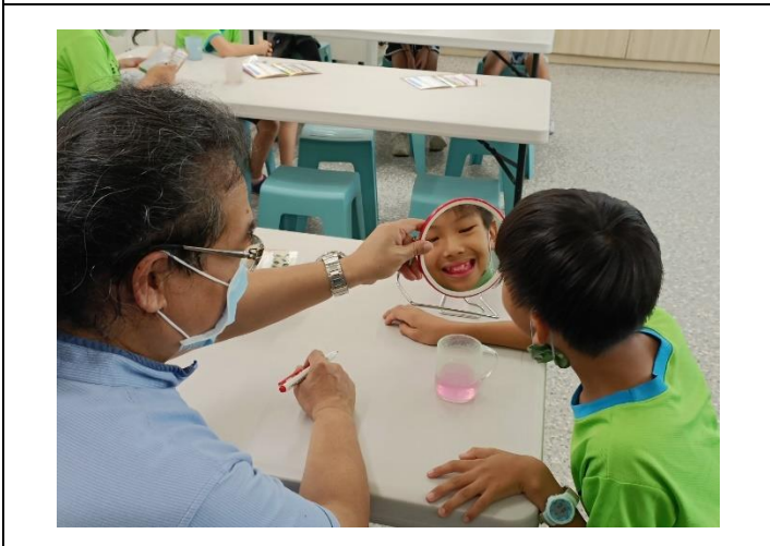
說明：牙線連連看—牙線使用指導