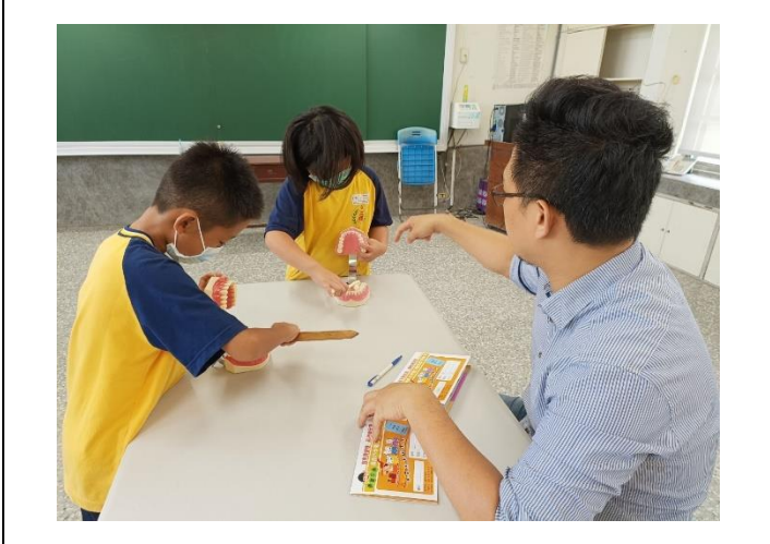
說明：台南市牙醫師公會牙醫師進行口腔衛教