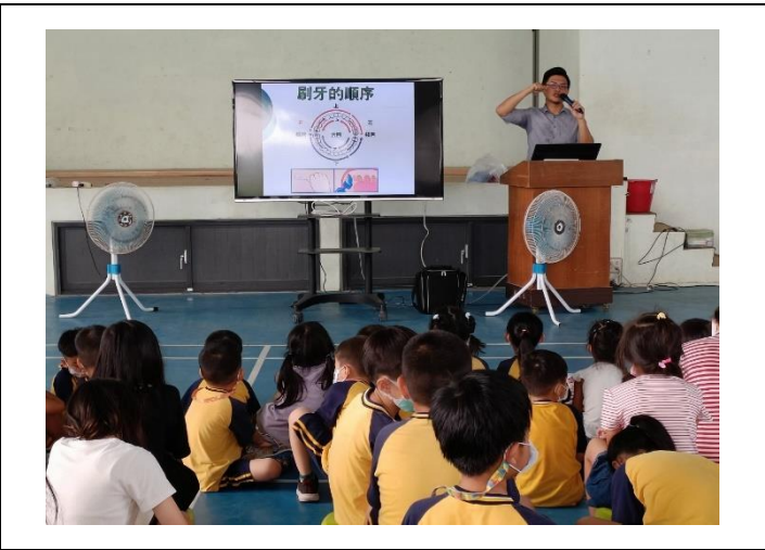
說明：口腔衛教育樂營流程