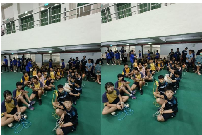
說明：參加普及化運動跳繩接力全市決賽活動手冊