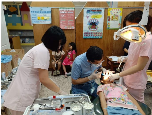
說明：安定牙醫團隊幫全校學童口腔健康檢查