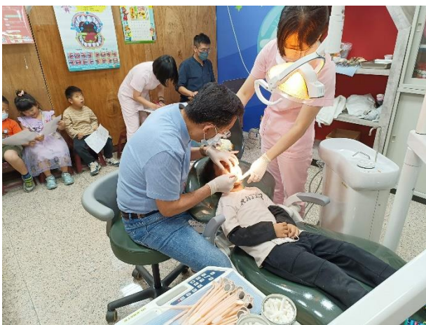
說明：牙醫師向幼兒園學童進行潔牙教學