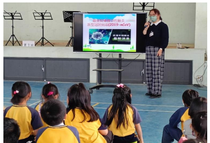
說明：結合七股衛生所辦理傳染病腸病毒防治宣導