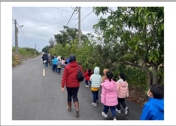
說明：112 學年三股國小榮家送暖暨路跑活動計畫