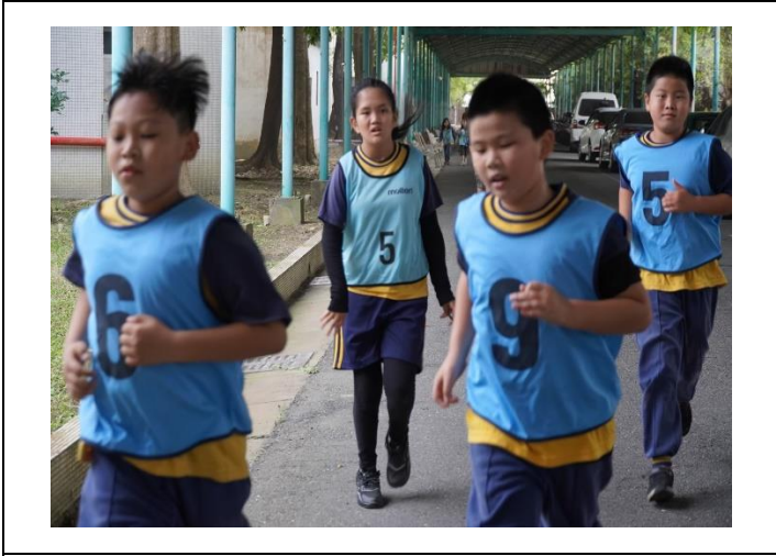
說明：由學校出發健走至佳里榮家鍛練肌力