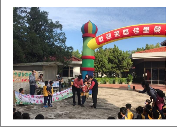
說明：與榮家住民爺爺奶奶一起歡樂過耶誕