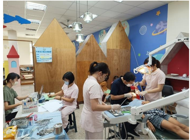
說明：每年申請偏鄉健保牙醫門診巡迴醫療服務