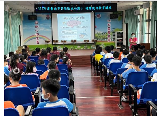
毒品防制相關資訊