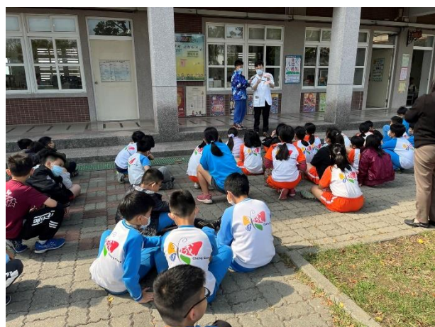
牙醫師公會巡迴醫療到校服務～口腔保健宣導