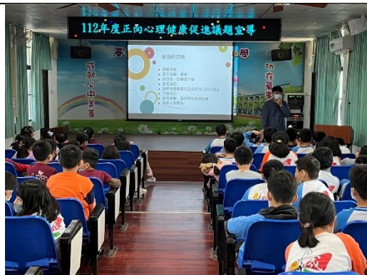
正向心理健康宣導