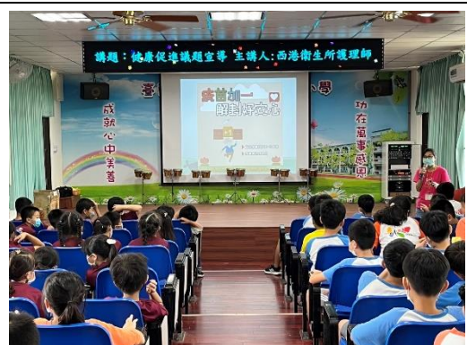
傳染病防治相關資訊