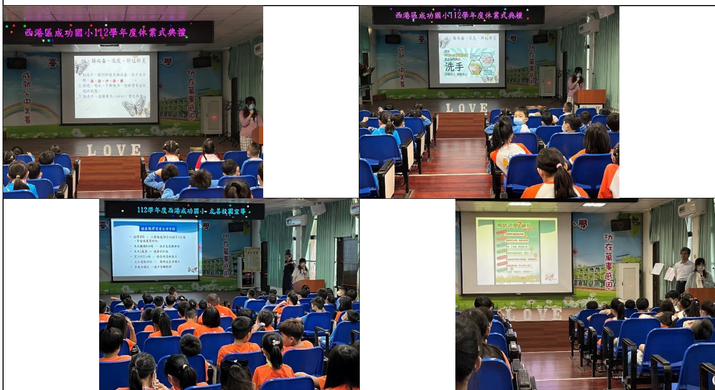
傳染病防治相關宣導