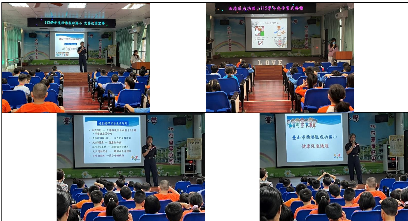
健康促進議題相關宣導