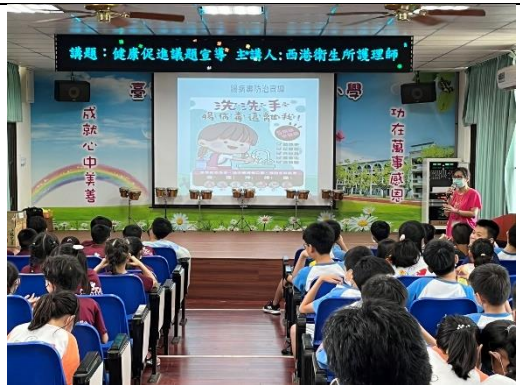
傳染病防治--正確洗手