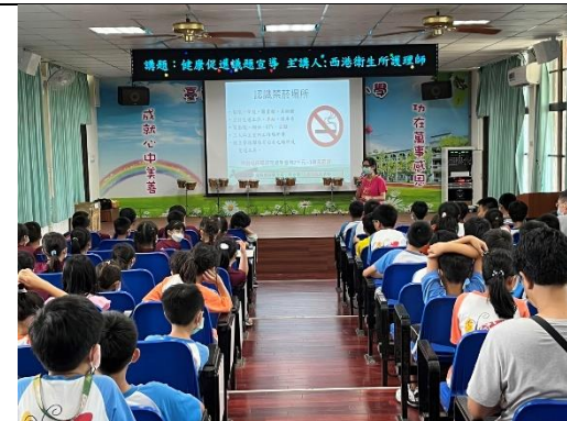
菸害防制相關資訊