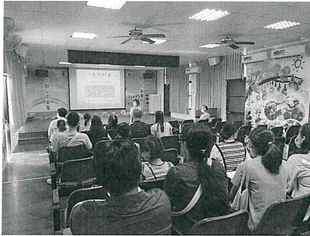
說明：親職教育講座