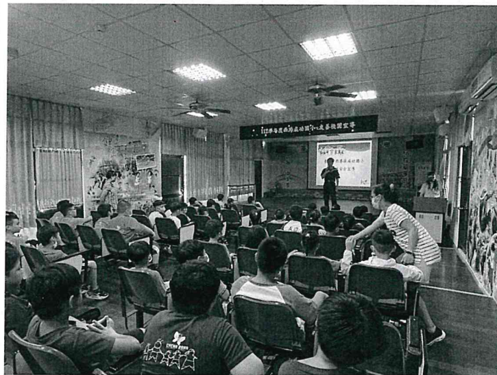
友善校園宣導 (112 學年上學期)