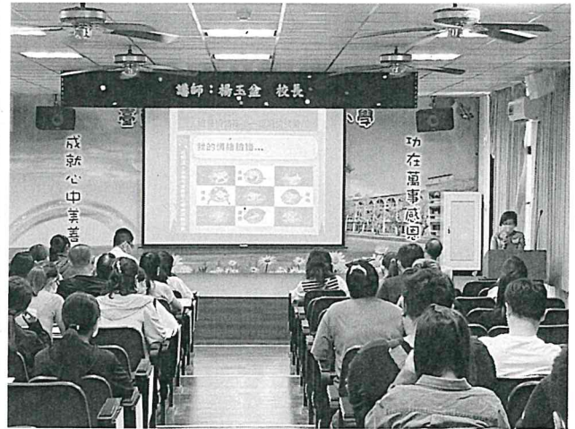
說明：親職教育講座