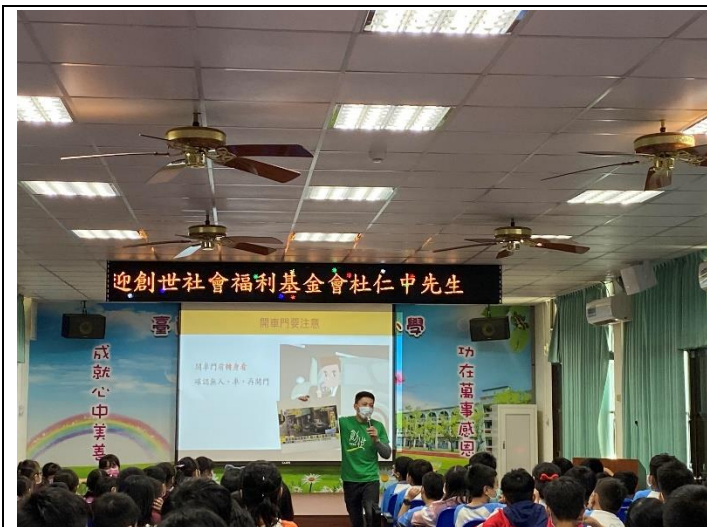
問題發生原因解說