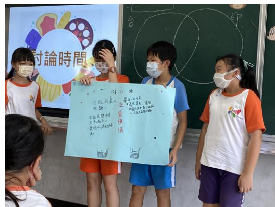
學生上台成果發表