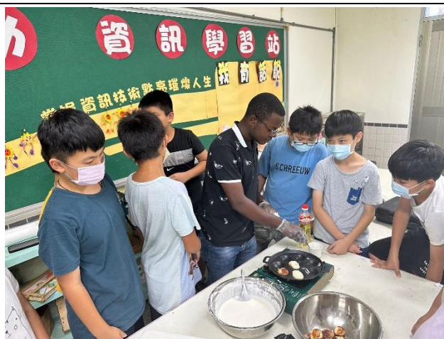
學生動手體驗課程-1