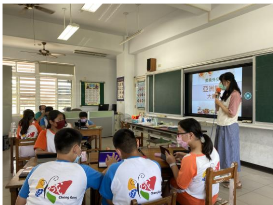
介紹亞洲相關飲食