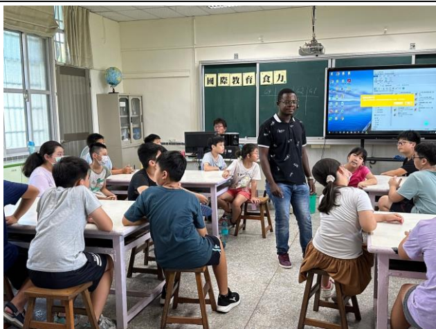
搭配外籍 TA 作課程介紹