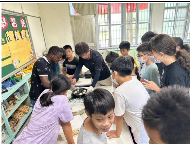
學生動手體驗課程-2