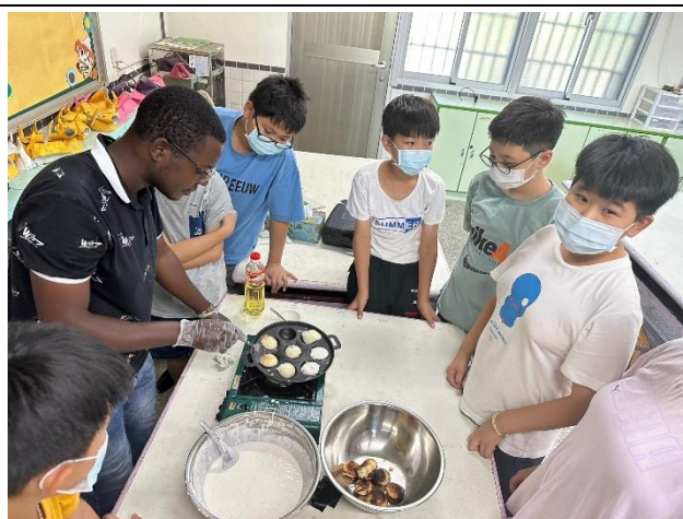
學生動手體驗課程-3