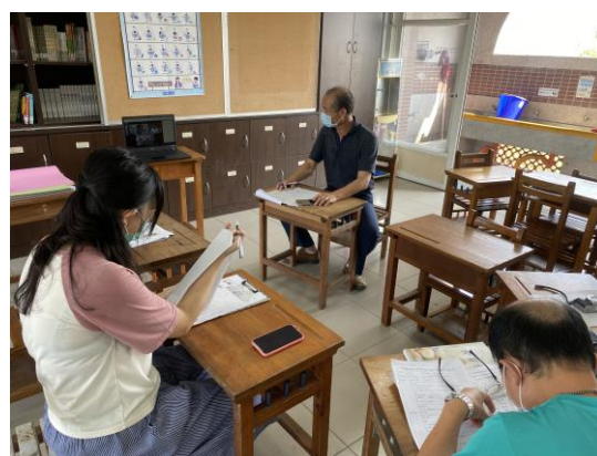
食育課程備課、議課