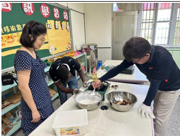
主任們先來試試看