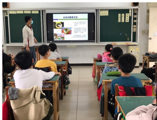
介紹日本飲食文化