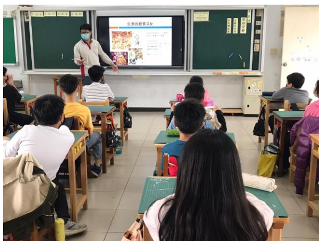
介紹臺灣飲食文化