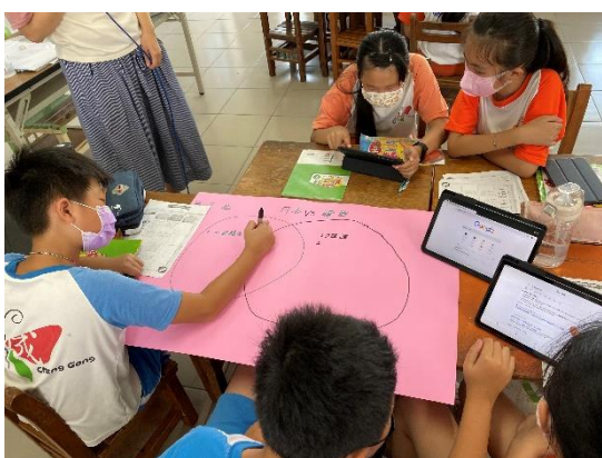
學生利用平板找尋資料 並完成海報