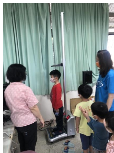
測量身高體重，讓學生及家長了解孩子的生長狀況。