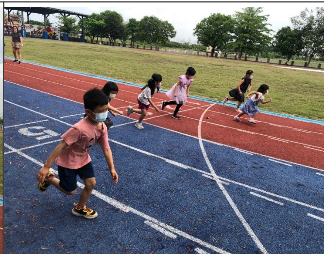
配合校內SH150計畫，學生利用課間時間到操場運動。