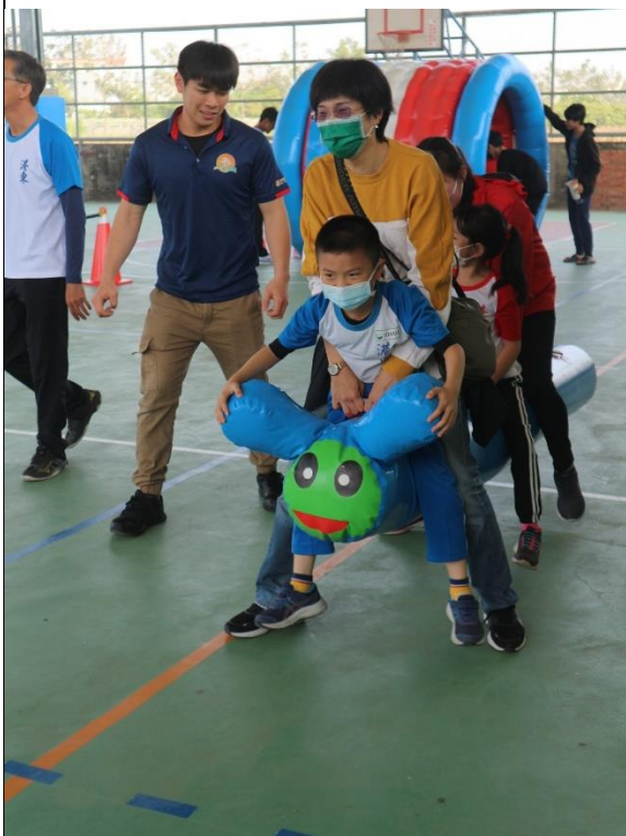
校慶運動會—親子闖關活動