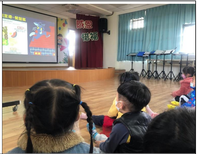
健康促進餐盤篇宣導，正確飲食觀念從小扎根。