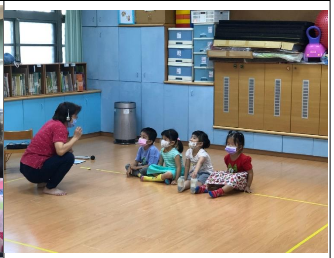
宣導視力保健—3010大家一起來。