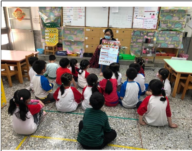
健康宣導，如何預防疾病。