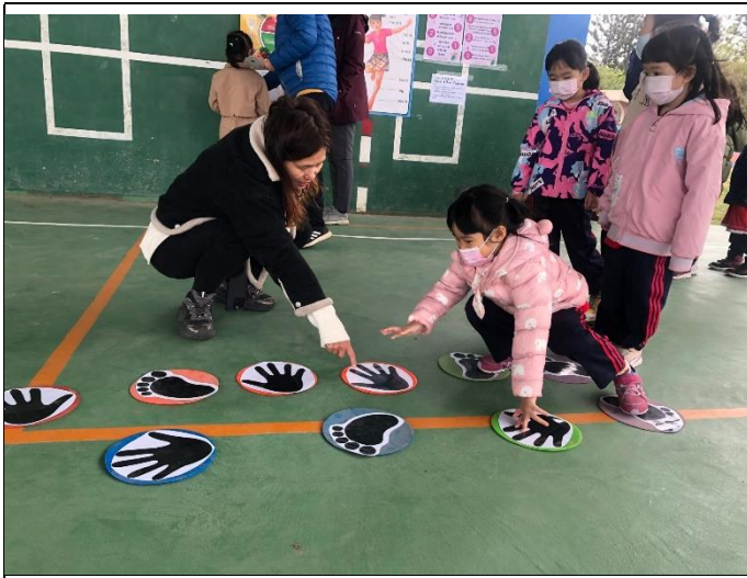
健康促進闖關活動-手腳並用