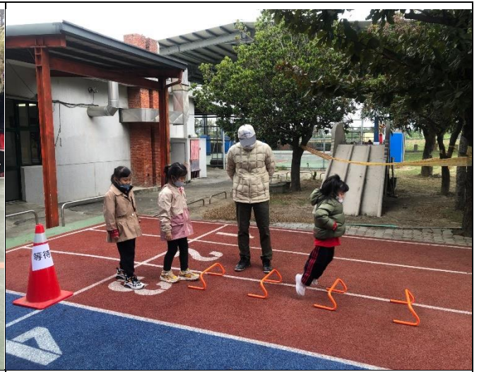
健康促進闖關活動-翻山越嶺