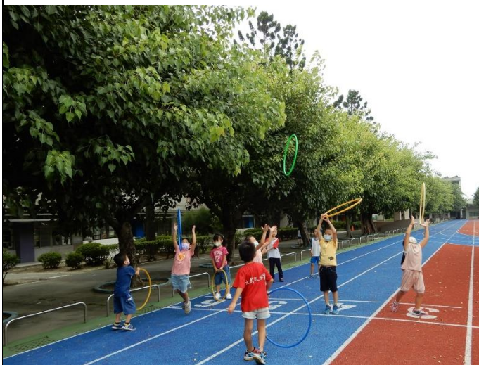
體能課程—訓練孩子手眼協調、室外可以更好玩。