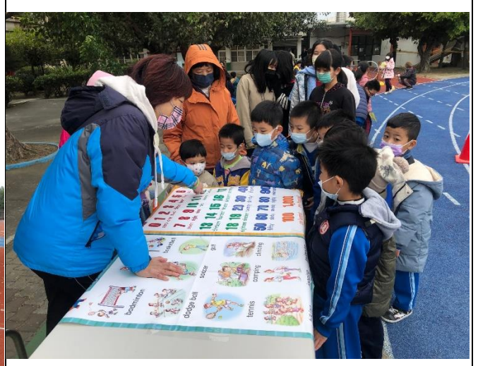
健康促進闖關活動—學生認識各種不同的運動