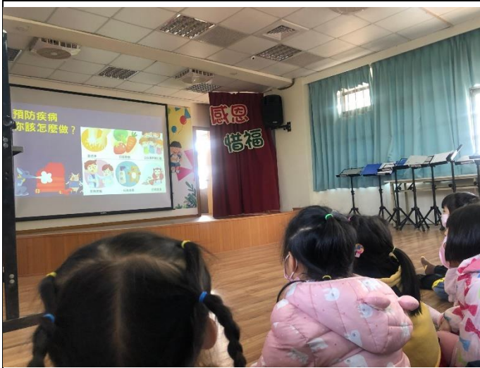
健康宣導，帶著孩子了解如何預防疾病。