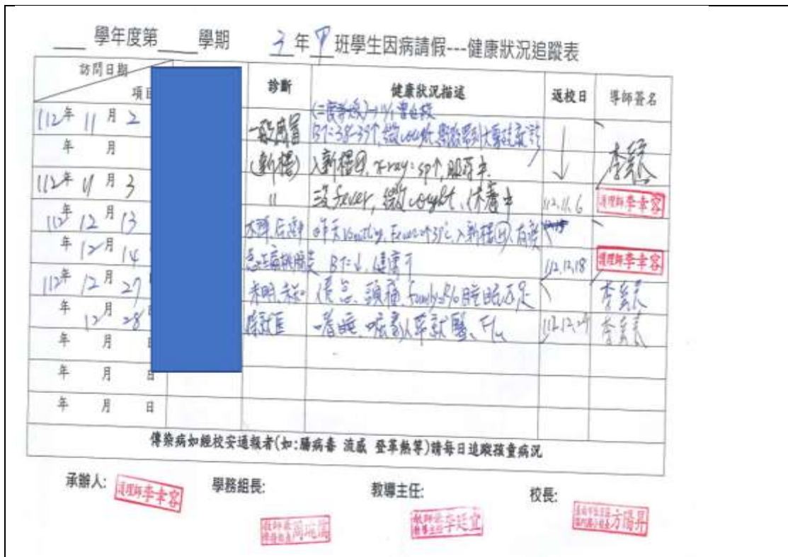
學生因病請假追蹤表