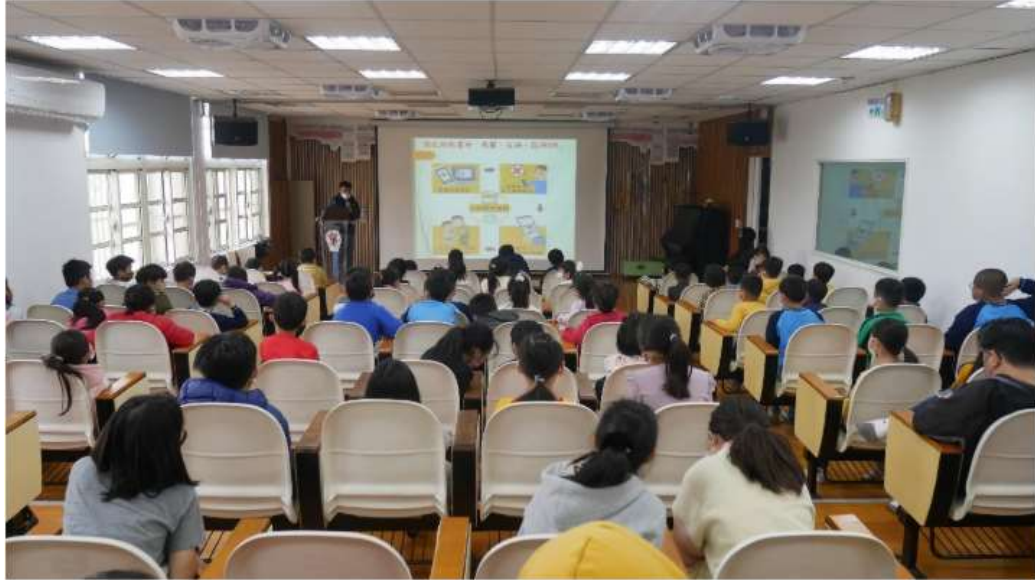
對抗網路霸凌—截圖、反映、找 iWIN