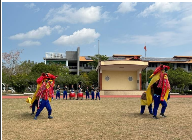
公共電視台及南天新聞採訪舞獅隊

學校實施正式或非正式課程、健康活動、研習訓練時，有邀請社區人士共同參與，發揮學校健康促進之影響力