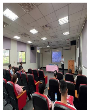
異國文化與飲食-越南