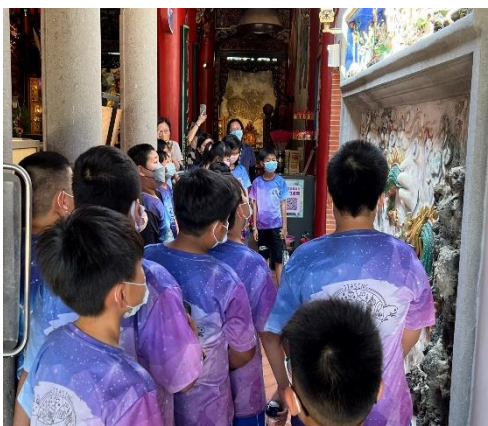
社區發展協會導覽社區古蹟震興宮

學校實施正式或非正式課程、健康活動、研習訓練時，有邀請 社區人士共同參與，發揮學校健康促進之影響力