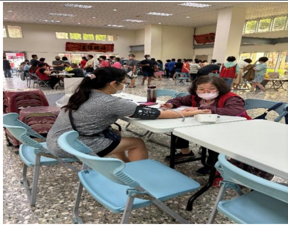
說明：校內教職員工參與佳里衛生所辦理行動醫院健康檢查活動-量血壓