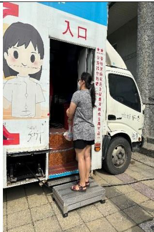
說明：校內教職員工參與佳里衛生所辦理行動醫院健康檢查活動-X光檢查