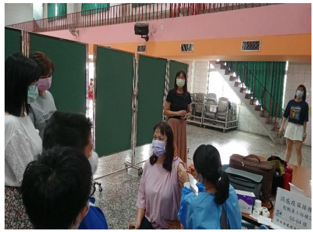
說明：幼兒園教職員工一起參與診所到校接種流感注射