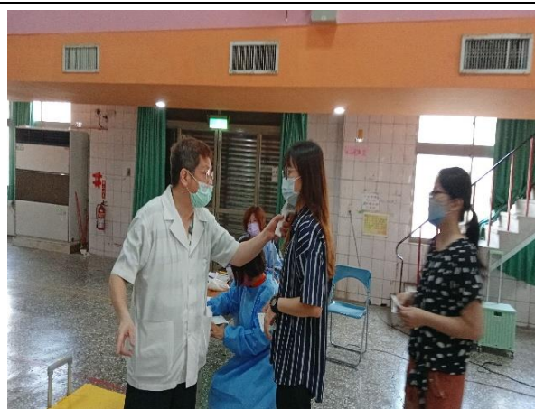
說明：教職員接種疫苗前由醫師評估