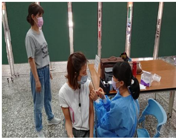
說明：教職員工接種流感疫苗