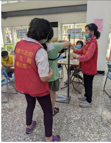
說明：校內教職員工參與佳里衛生所辦理行動醫院健康檢查活動-身高、腰圍測量