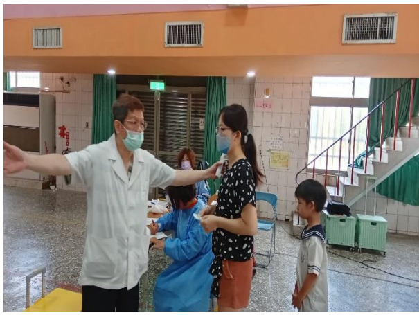
說明：醫師評估後引導接種流程