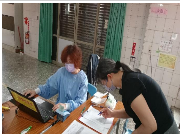
說明:112年11月3日校內教職員工參與小天使診所到校流感注射