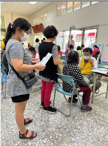
說明：校內教職員工參與佳里衛生所辦理行動醫院健康檢查活動-醫師理學檢查