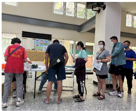
說明：校內教職員工參與佳里衛生所辦理行動醫院健康檢查活動-糞便潛血檢查