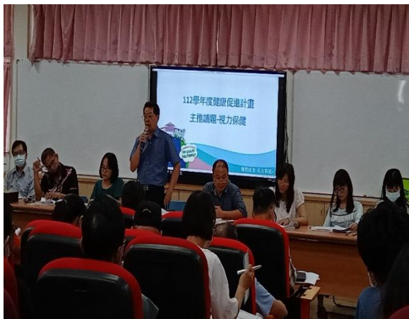
說明：本校召開健促相關會議幼兒園主任參與會議討論