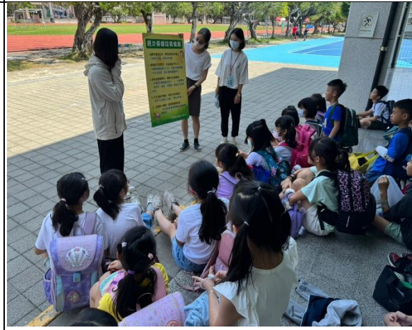
說明：利用放學安親班集合時間針對課後安親班的老師及學生視力保健宣導