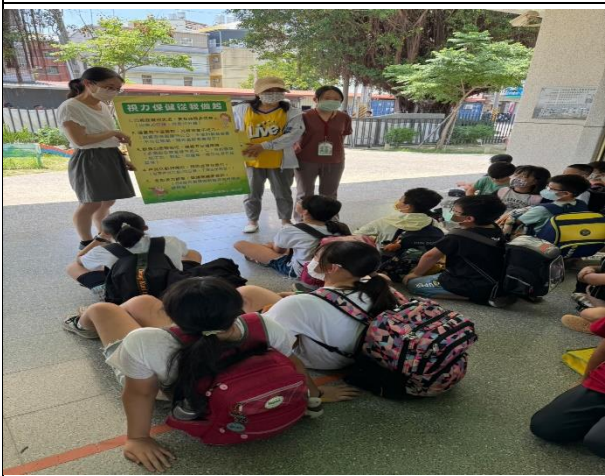
說明：利用放學安親班集合時間針對課後安親班的老師及學生視力保健宣導