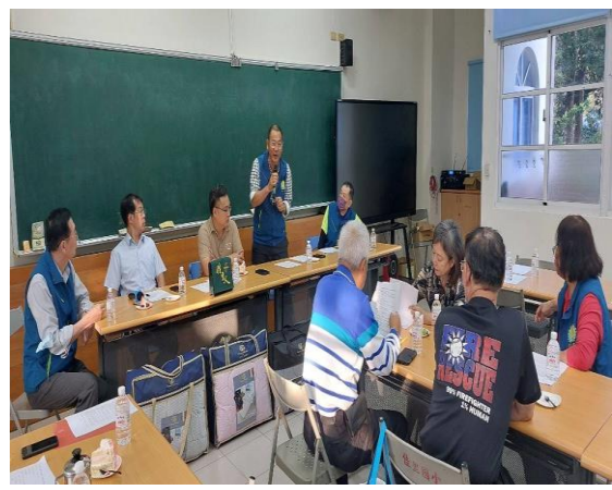
說明：校慶籌備會邀請校友會及家長會成員到校參與討論