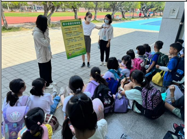
說明：用放學安親班集合時間針對課後安親班的老師及學生視力保健宣導