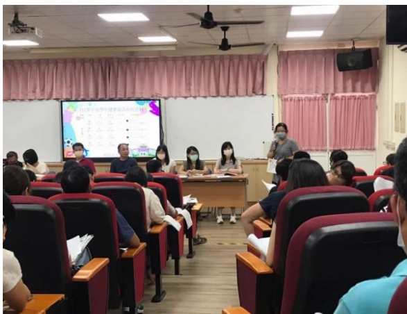
說明：召開健促相關會議幼兒園主任參與會議討論