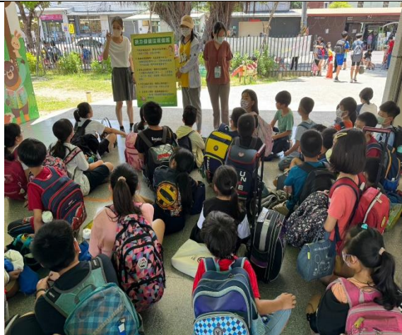
說明：用放學安親班集合時間針對課後安親班的老師及學生視力保健宣導