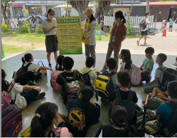
說明：利用放學安親班集合時間針對課後安親班的老師及學生視力保健宣導