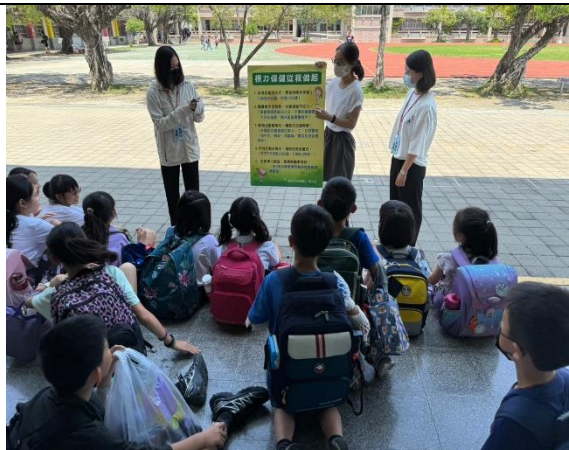
說明：利用放學安親班集合時間針對課後安親班的老師及學生視力保健宣導