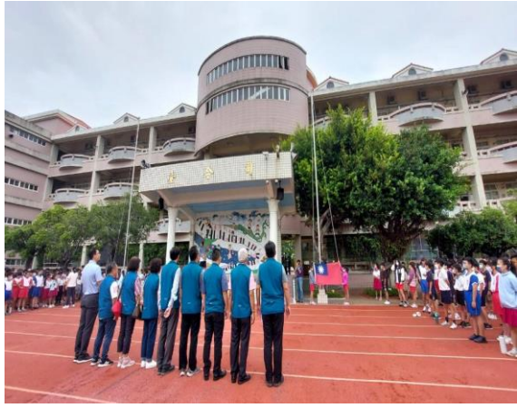
說明：校慶運動會校友會代表參與開幕典禮