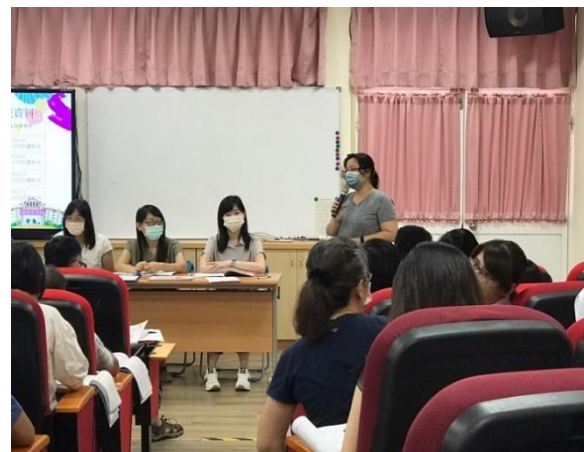
說明：召開健促相關會議幼兒園主任參與會議討論