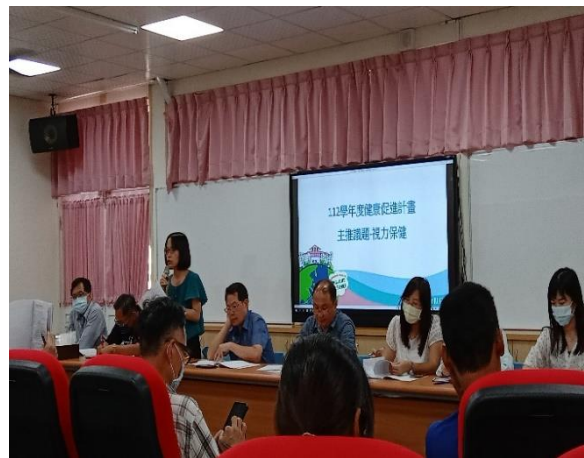
說明：本校召開健促相關會議幼兒園主任參與會議討論