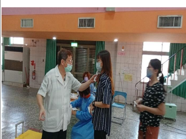
說明：小天使婦幼診所醫師評估教職員工身體狀況