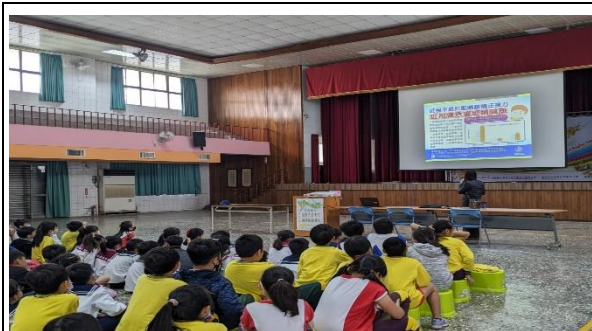
說明：醫師提醒學生近視不是只配眼鏡就好