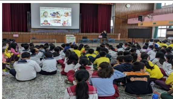
說明：最容易造成近視的六大活動排行榜