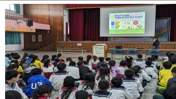
說明：每日戶外運動 預防近視的發生與加深