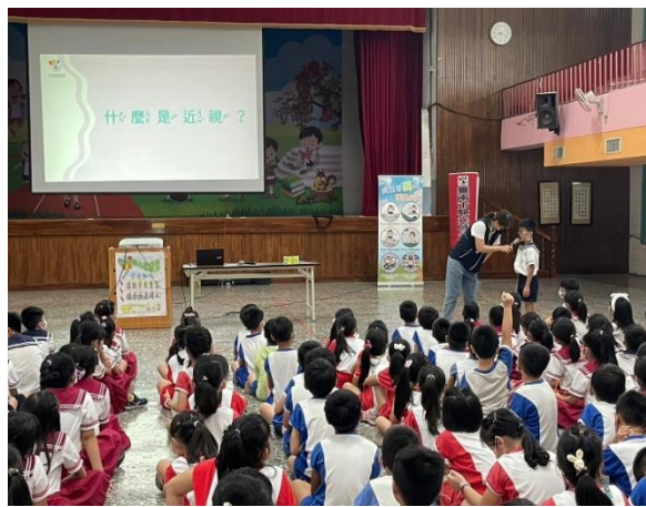
說明：驗光師和利用有獎徵答和學生親切互動