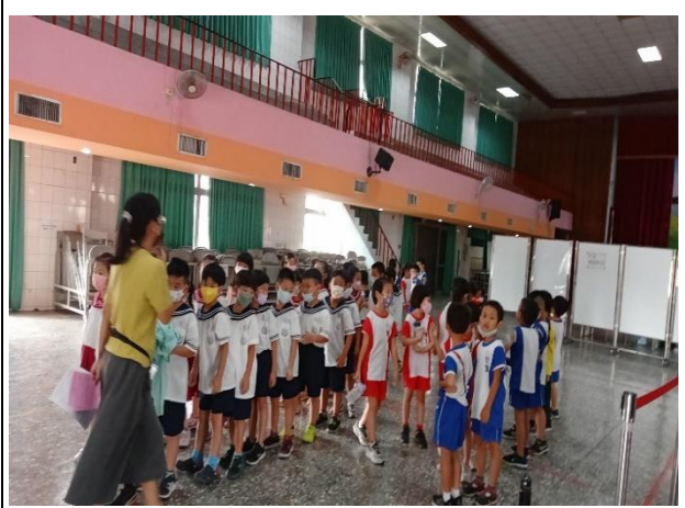
說明：接種當日班級導師協助引導學童及維持秩序