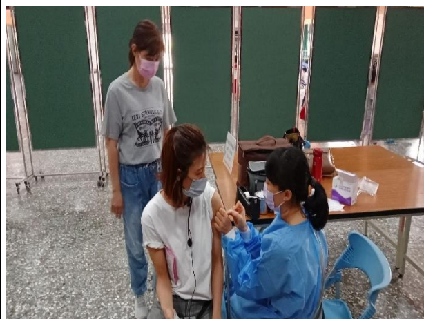
說明：小天使婦幼診所團隊為教職員工接種疫苗