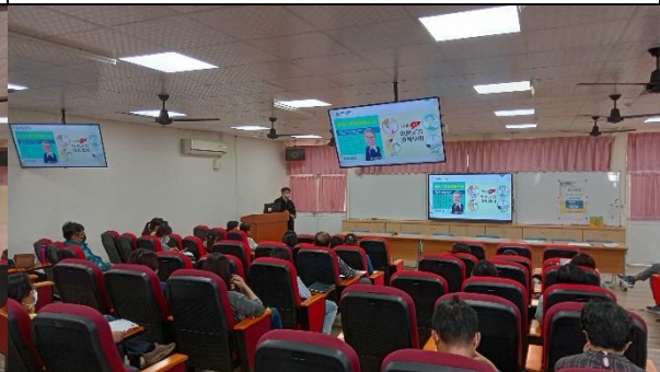
說明：如何預防肝炎