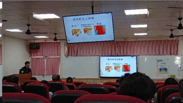
說明：慢性肝炎三部曲