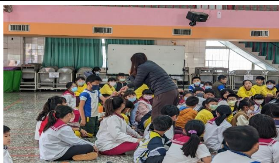
說明：答對由醫師贈送小禮物