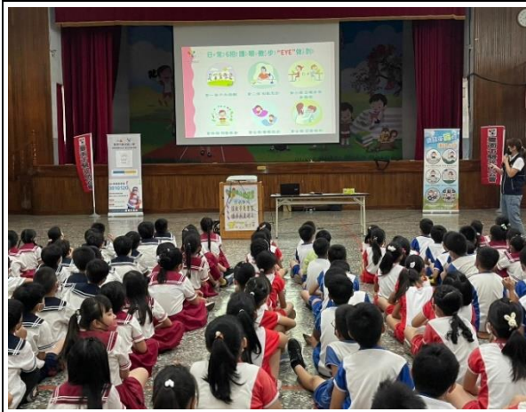
說明：台南市驗光公會到校視力保健宣導