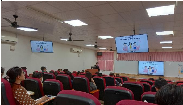
說明：C型肝炎口服新藥治療