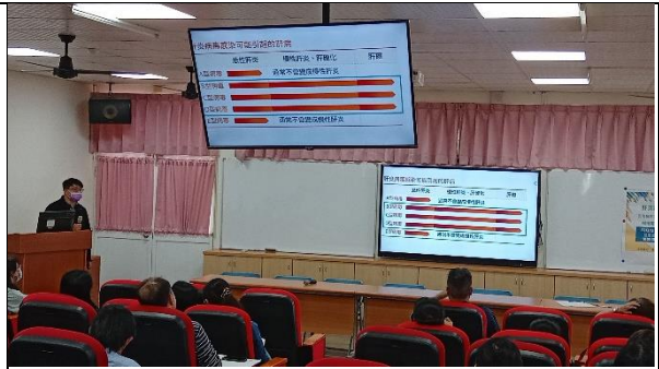
說明：病毒性肝炎種類介紹