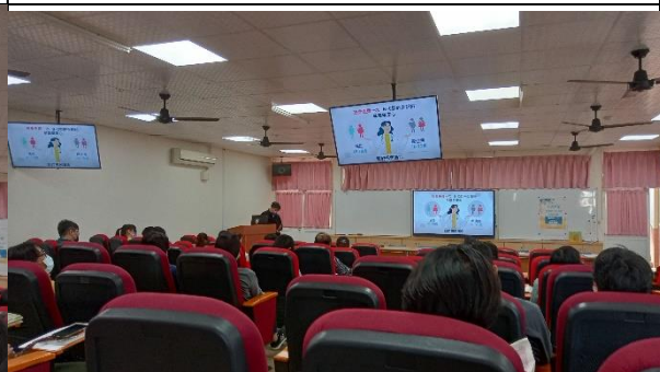
說明：45~79歲民眾及40~79歲原住民健保提供一次免費B、C型肝炎篩檢