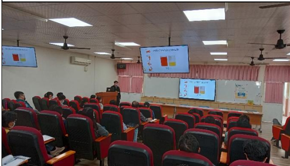
說明：慢性B.C型肝炎的臨床症狀