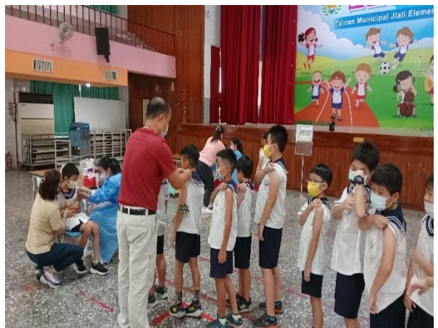
說明：小天使婦幼診所團隊為學生接種流感疫苗