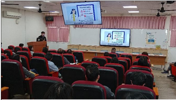
說明：肝炎會帶來的嚴重性-肝硬化和肝癌