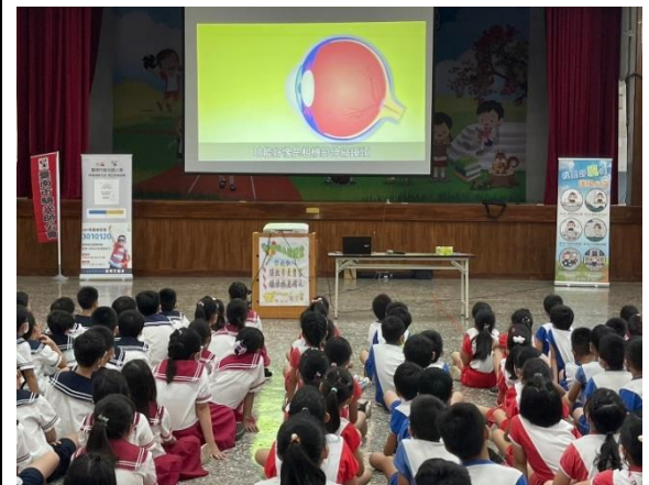
說明：利用動畫介紹近視過程