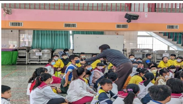
說明：學生回答問題