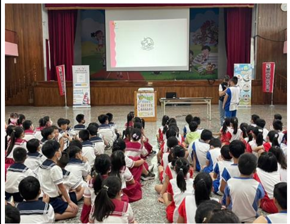
說明：驗光師和利用有獎徵答和學生親切互動