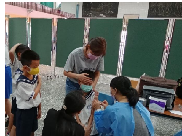
說明：小天使婦幼診所團隊為學生接種流感疫苗