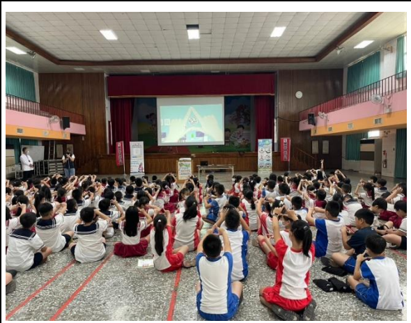
說明：台南市驗光公會到校視力保健宣導