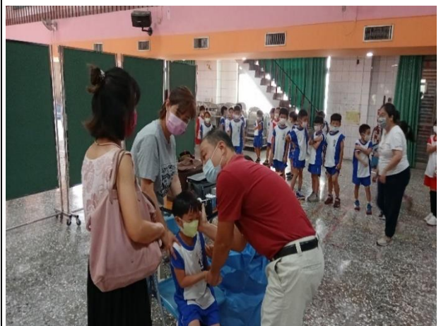
說明：接種當日校內主任、教師、志工協助安撫學童