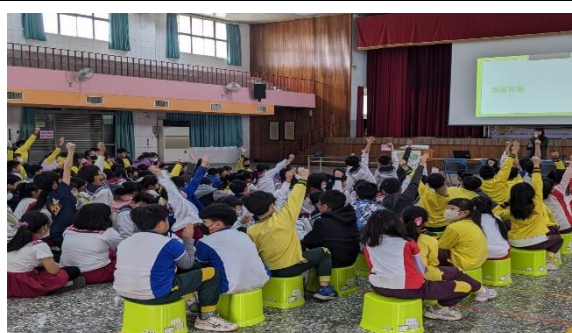
說明：利用有獎徵答與學生互動