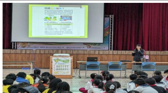
說明：遠視儲備 從小做起