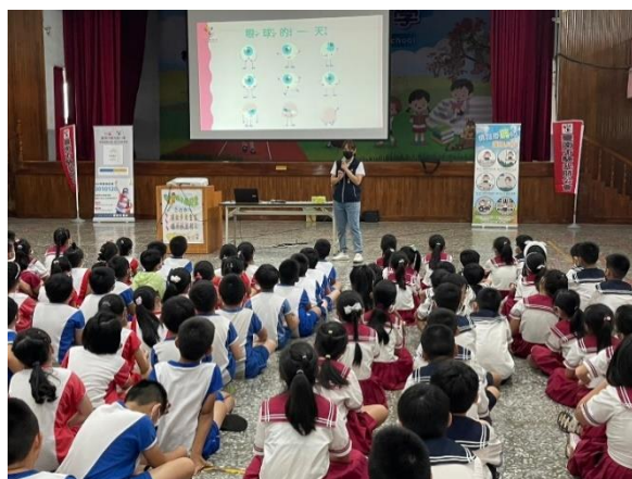
說明：台南市驗光公會到校視力保健宣導