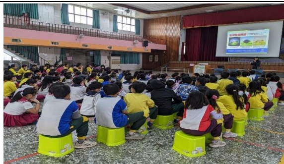
說明：宣導近視是疾病觀念