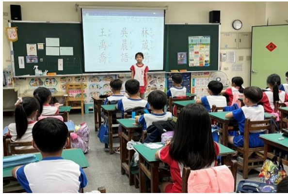
說明：由提名表決產生班級模範生