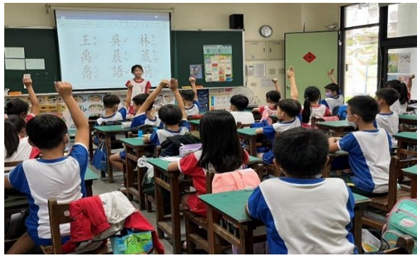
說明：由提名表決產生班級模範生