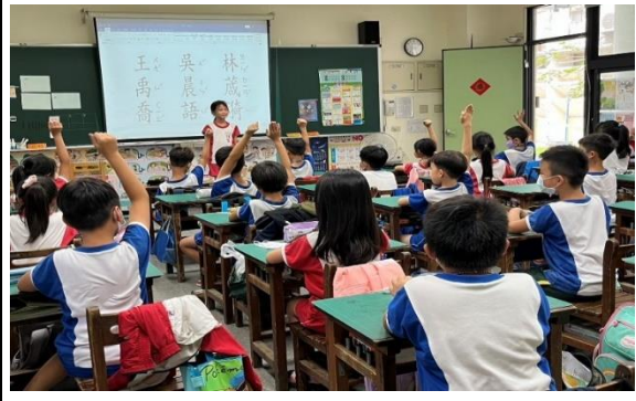
說明：由提名表決產生班級模範生