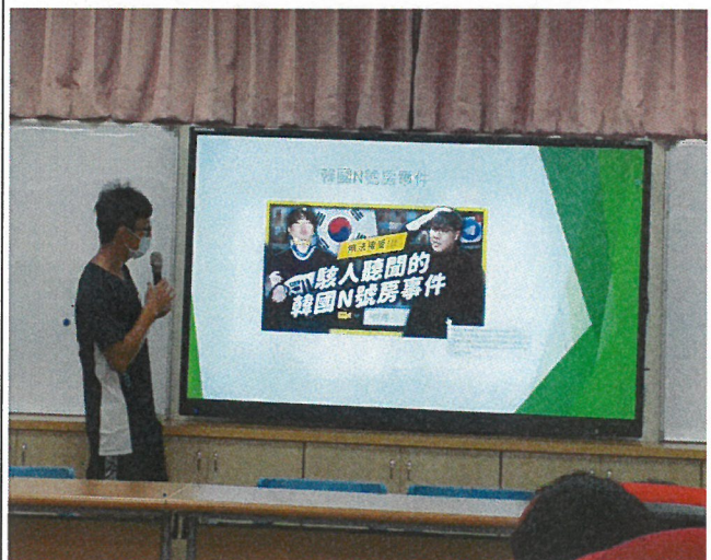
專輔教師針對高年級學生入班宣導，給予正確的網路安全使用規範，在網路世界學會辨別陷阱並保護自己！