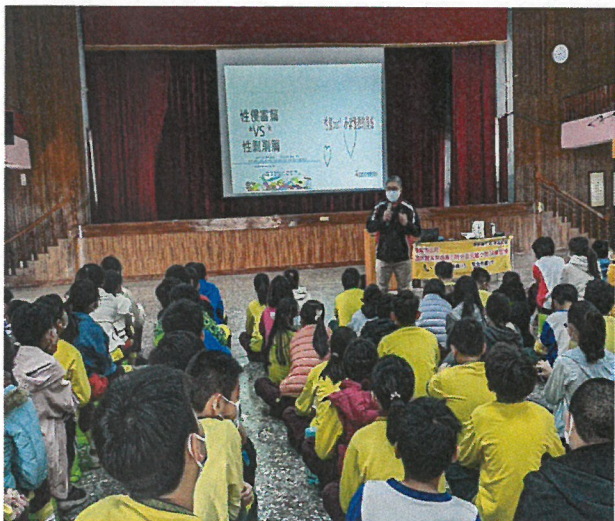
邀請講師到校对六年級學生進行性侵害暨性剝削防治宣導，教導孩子學會保護自己免受傷害