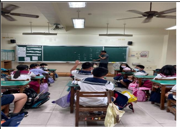
說明：由提名表決產生班級模範生