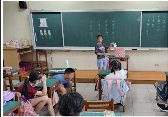
說明：班級模範生透過提名採不記名投票