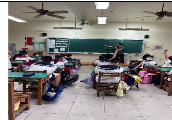
說明：由提名表決產生班級模範生