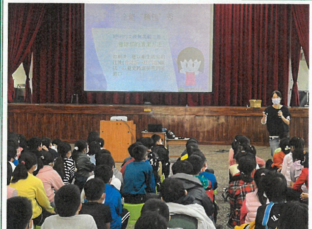
告知衛生棉使用注意事項