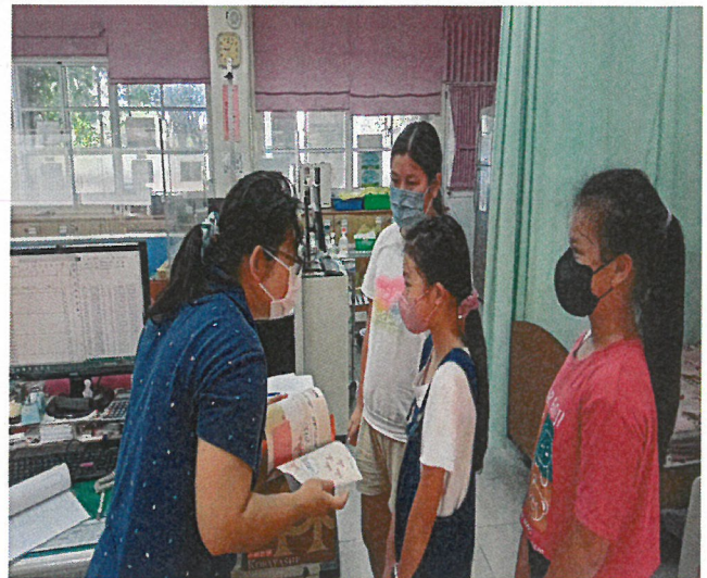
針對弱勢學生進行各別指導-認識月經