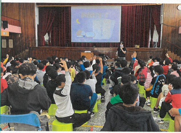
介紹如何減少月經不適