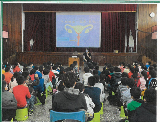
介紹為什麼會有月經