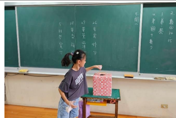
說明：透過提名採不記名投票產生

臺南市住聖國民小學 112 學年度班級模範生選拔計畫及推薦表 壹、依據：本校校務發展計畫 貳、目的： 一、鼓勵兒童向美及學學心 二、培養學生健全人格，樹立學校良好風氣。 參、原則： 一、審慎公開選拔的過程。 二、盡有具體的優良事蹟(如選拔標準所列)。 肆、實施方式： 一、選拔條件：以班級為單位，由班內全體同學或從學校其他職務工作之學生具推薦書。 二、選拔標準：分「好品德表現」及「成績表現」兩項，其內容如下： (一) 好品德表現： 1. 符合本縣推行品德教育十三種核心價值(孝親尊長、尊重生命、負責盡責、誠實信用、寬謙感恩、自律守法、謙虛有禮、勇於負責、團隊合作、公平正義、積極貢獻、愛敬環境)二種以上或各條列完九項核心價值二種以上，且經同學推薦書或導師簽書。 2. 具備下列良好品德： (1) 有誠信：不說謊、不作弊、不偷竊、說對話、有勇氣；能為對的事去說、能勇敢面對。 (2) 負責任：能對自己做的事、不辜負別人幫助或照顧；善於自己的作為負責。 (3) 知尊重：對待別人善於比心、謙恭有禮；別人講話仔細聆聽；不辱罵或嘲笑別人；不欺負或排擠他人。 (4) 能體恤：待人寬大厚道；對別人的感受敏銳；能對自己的行為將會如何影響別人。 (5) 樂助人：主動體恤、真適當的熱心與善提供協助給需要幫助的人或需要協助會換機之服務工作者。 (6) 善合作：願意與人討論，分享自己的想法；不會自以為是，自作主張。 (7) 知孝順：能尊敬父母；主動與家人；體恤父母的心意。 (二) 成績表現： 1. 學業表現優異，成績優良。 2. 學業表現優良，成績良好。 3. 學業表現良好，成績中等。 4. 學業表現中等，成績及格。 5. 學業表現及格，成績及格。 6. 學業表現不及格，成績不及格。 7. 學業表現不參加，成績不參加。