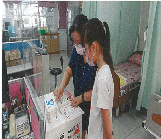
針對弱勢學生進行各別指導-衛生棉使用