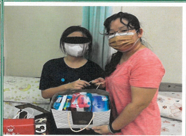
提供不同長度衛生棉以利使用