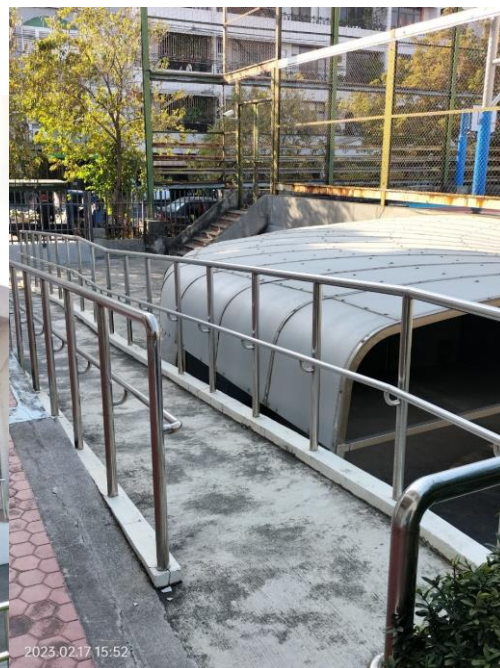
無障礙設施坡道檢查