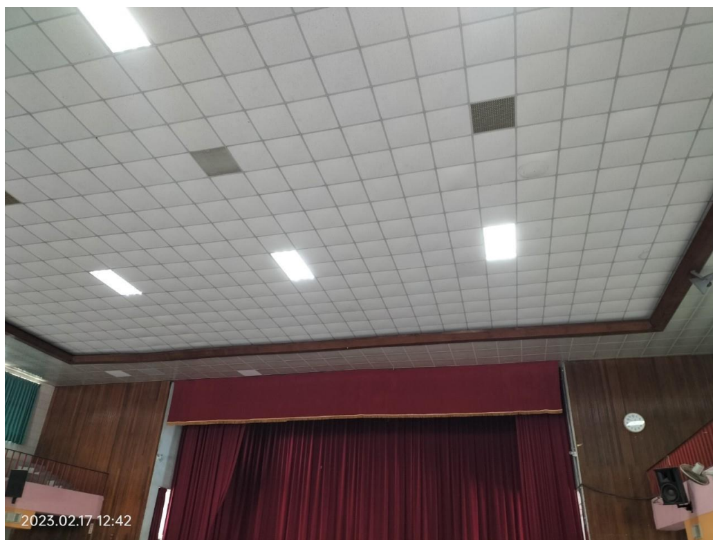
活動中心-中正堂 電燈檢查