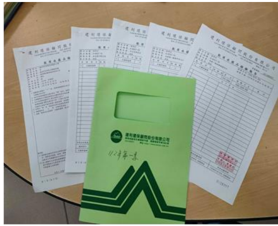
說明：飲水機檢驗報告存檔備查