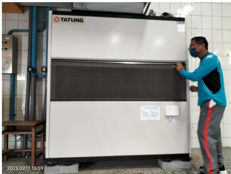
活動中心-中正堂 冷氣檢查