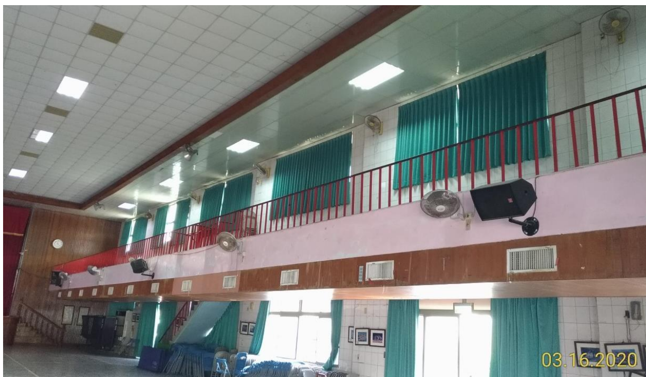
活動中心-中正堂 電燈 電扇 空調 檢查