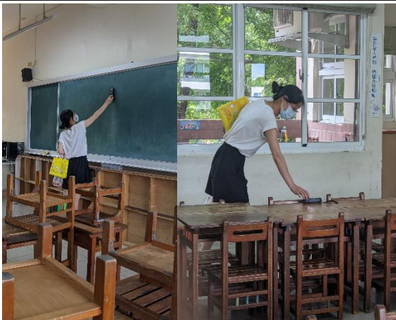
說明：教室黑板、課桌面照度測量