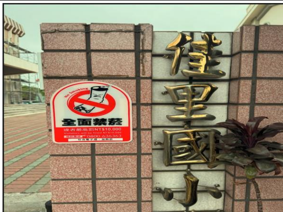
說明：校門張貼明顯禁菸標示