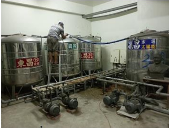
說明：教學大樓水塔清洗