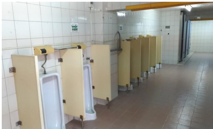
廁所、熱水器、淋浴間設施檢查