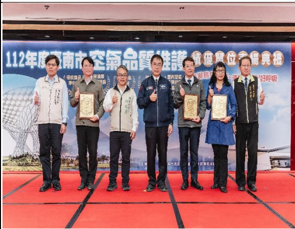
說明：綠牆表揚照片