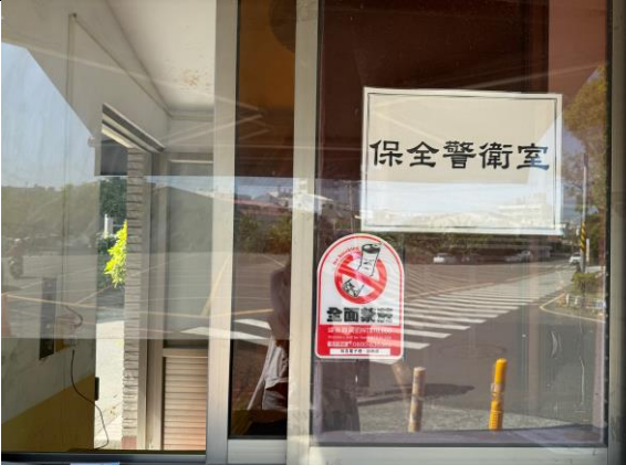
說明：無菸無毒環境營造