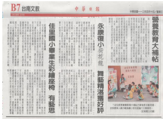
說明：中華日報宣導