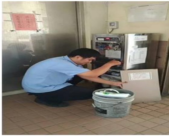
說明：飲水機保養，更換濾心