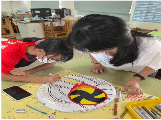
說明：畢業生彩繪座椅