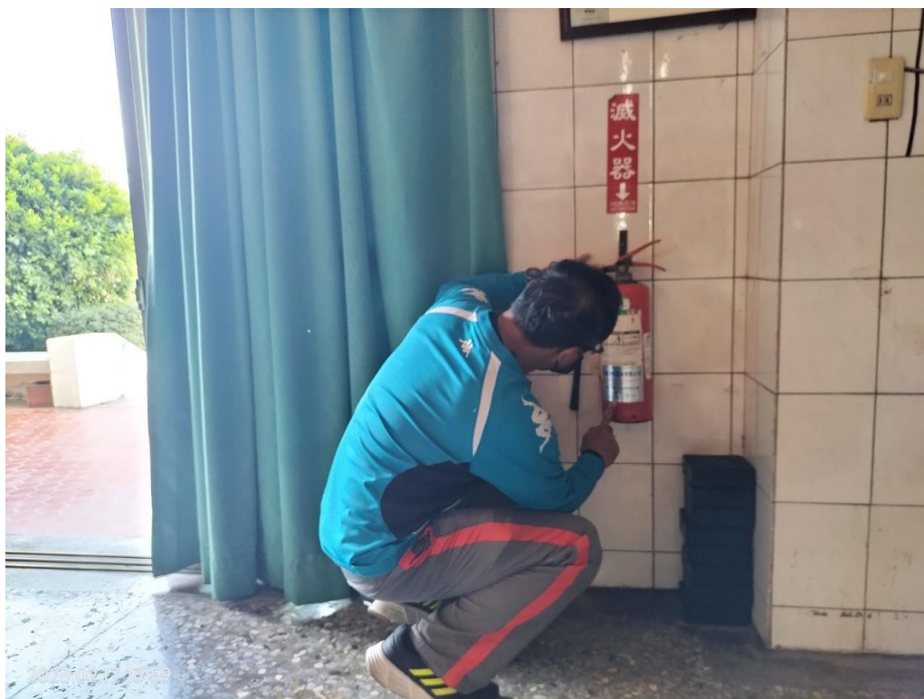
活動中心-中正堂 消防設施檢查