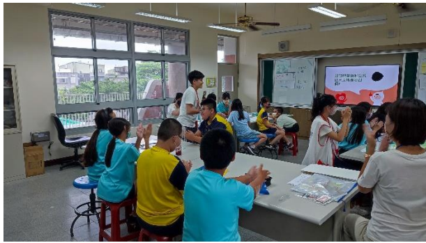
討論兒童人權的類別