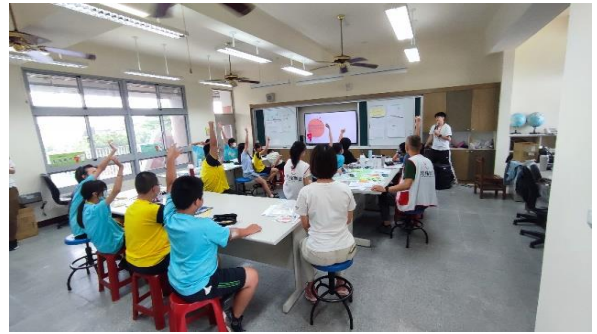
討論兒童人權的類別