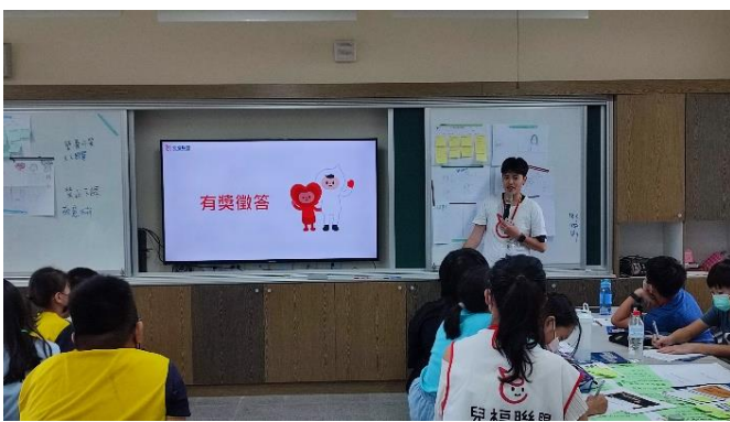
進行有獎徵答活動