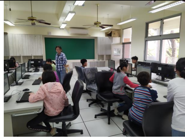
導師協助學生施測