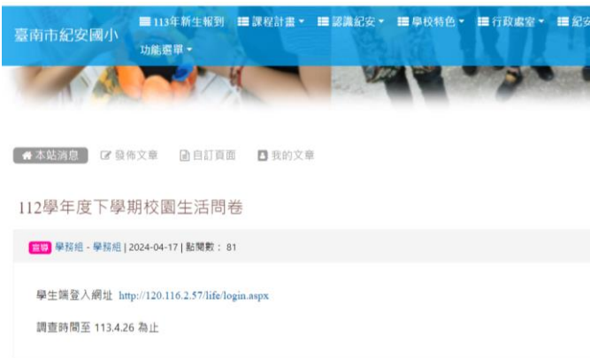
於校網設置連結填報區