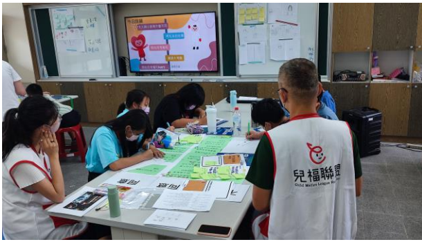
分組進行教學活動