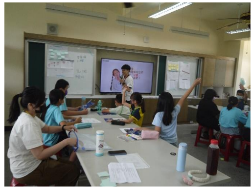
學生針對問題發問