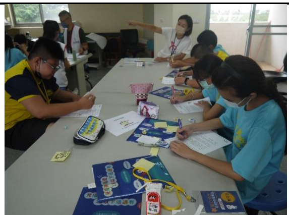
學員指導學生進行分組活動