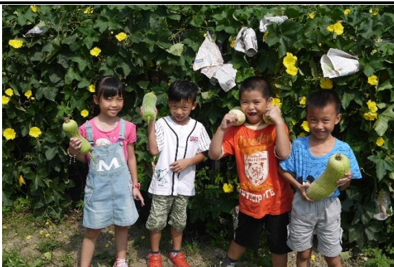
學生採收校園瓜架的菜瓜