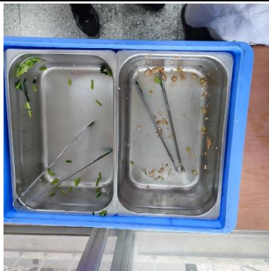
午餐吃光避免浪費