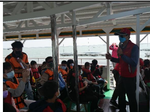
海洋教育-搭乘龍海號進行生態之旅