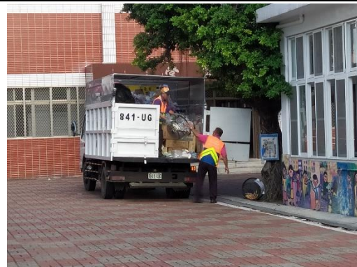
請清潔隊協助資源回收作業