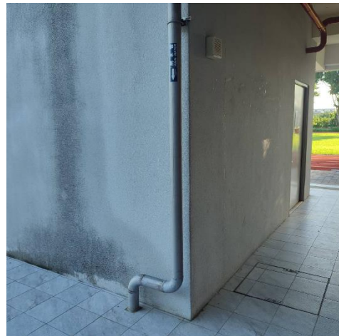
省水設施-雨水管回收設計