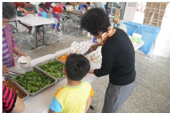
於祖孫週午餐時食用校內栽種蔬菜