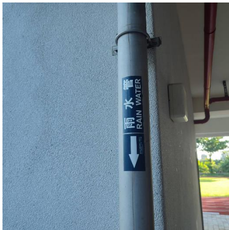
省水設施-雨水管回收設計