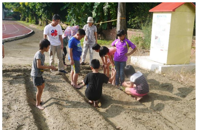
配合自給農園進行有機農業栽種課程