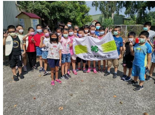
配合四健會進行有機農業栽種課程