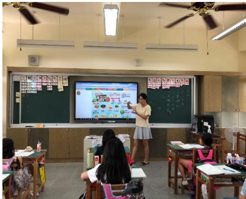
結合餐前五分鐘活動進行食農課程