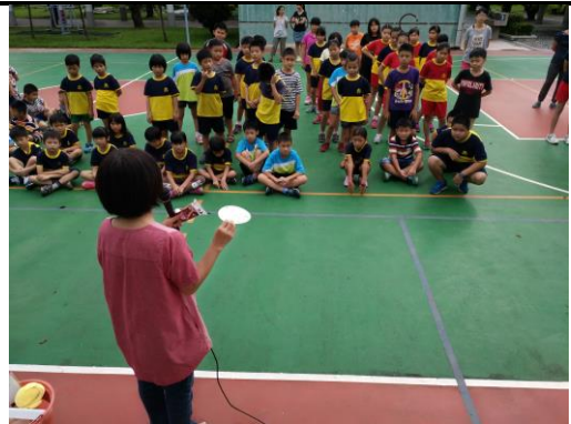
教師說明資源回收重點