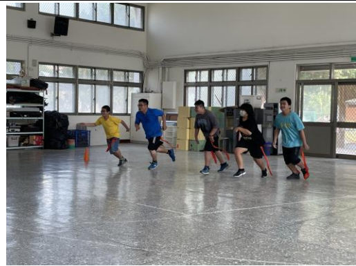
學務組長於課間活動時指導學生進行體能活動-老鷹抓小雞