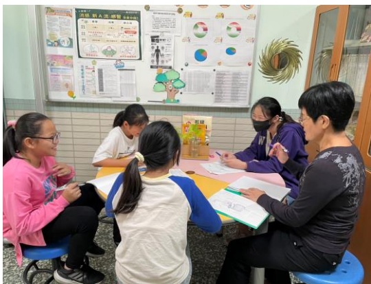
護理師指導學生進行小護士工作