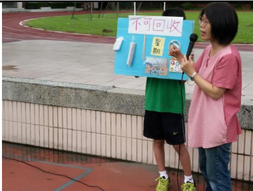
教師於晨會進行資源回收宣導