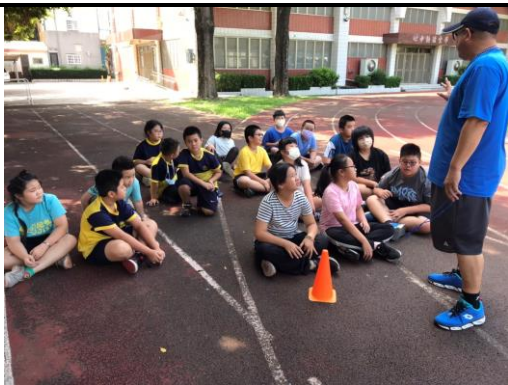
學務組長於課間活動時指導學生進行體能活動