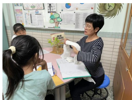
護理師指導學生進行小護士工作