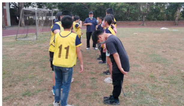
學務組長於課間活動擔任學生樂樂足球裁判