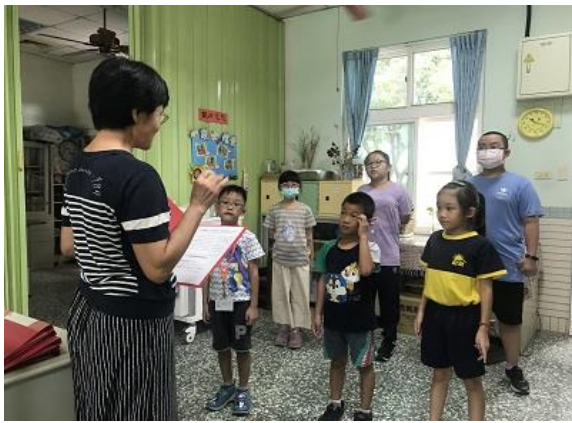
護理師指導學生進行小護士工作