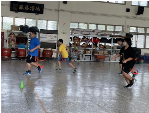
學務組長於課間活動時指導學生進行體能活動-老鷹抓小雞