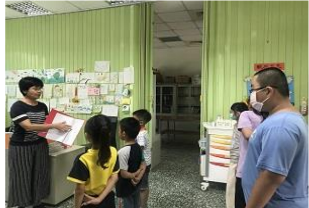
護理師指導學生進行班級衛生工作