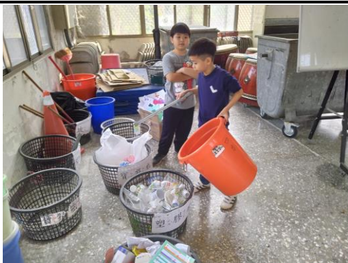
教師於晨會後指導學生進行資源回收