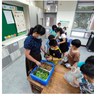
教師指導學生用餐禮儀