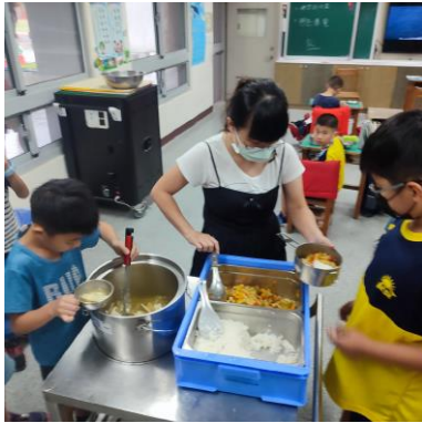
教師指導學生用餐禮儀