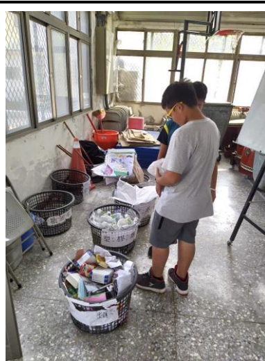
教師於晨會後指導學生進行資源回收