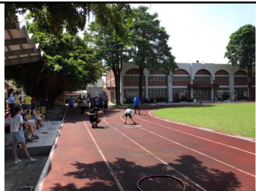
學務組長於課間活動時指導學生進行體能活動-趣味競賽