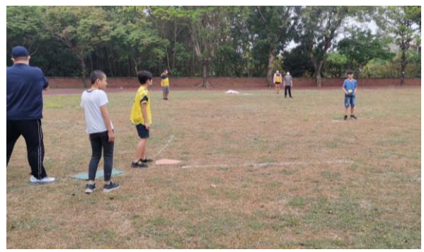
學務組長於課間活動擔任學生樂樂足球裁判