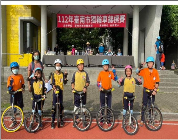
參加112年臺南獨輪車錦標賽