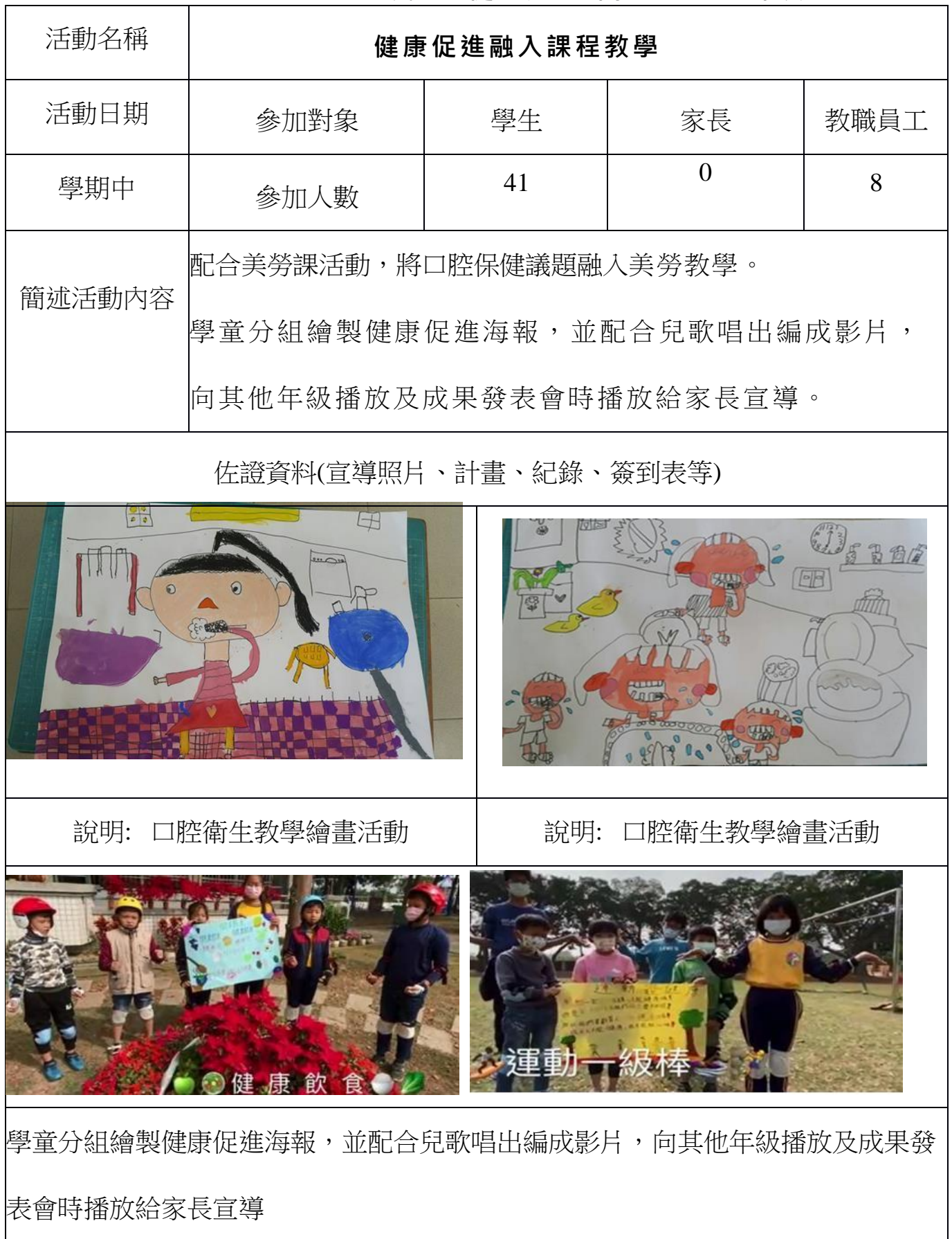
臺南市 112 學年度港尾國民小學健康促進相關增能活動成果表