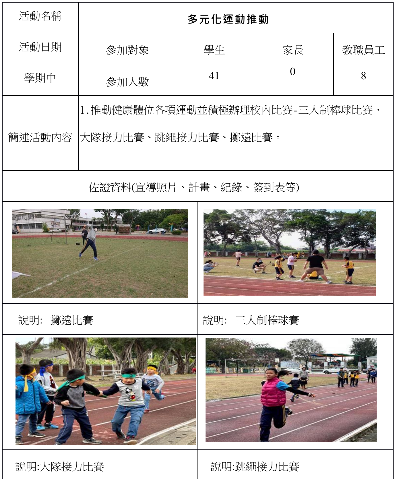
臺南市 112 學年度港尾國民小學健康促進相關增能活動成果表