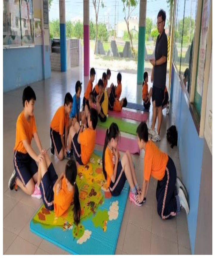
辦理學生體適能健康管理活動