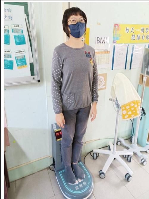
提供教職員工生健康諮詢