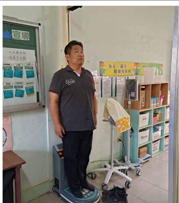
提供教職員工生健康諮詢