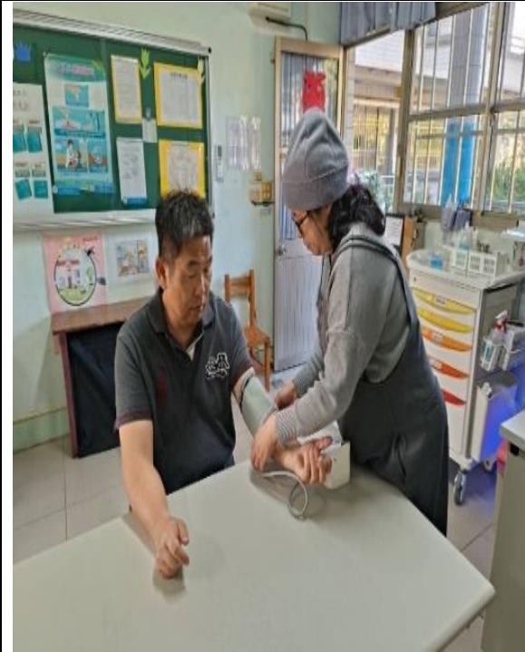
提供教職員工生健康諮詢血壓量測