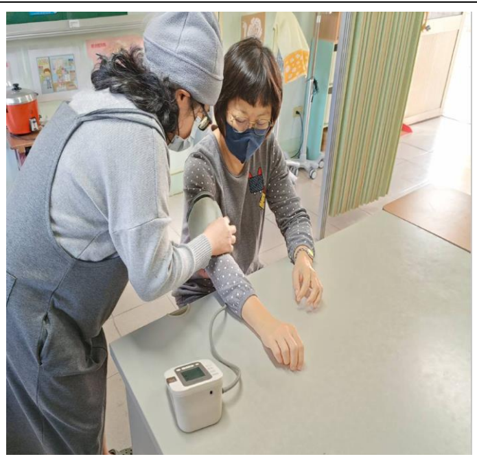
提供教職員工生健康諮詢