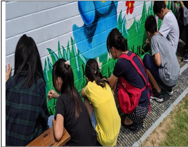
學生參與校園美化綠化工作