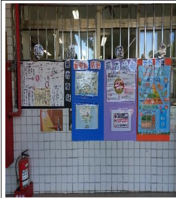
無菸環境營造-菸害防制海報走廊