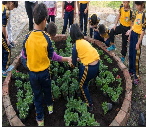
學生參與校園美化綠化工作