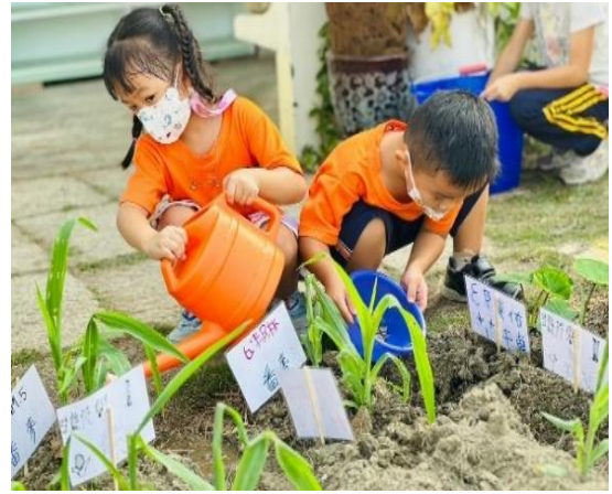
學生參與校園美化綠化工作