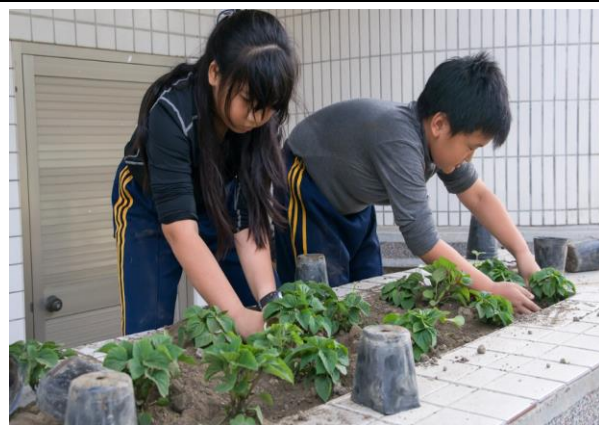
學生參與校園美化綠化工作