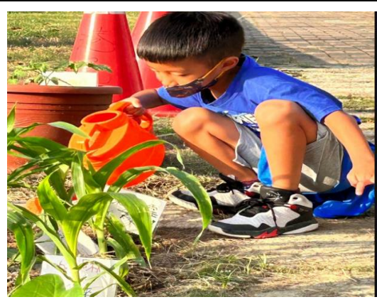
學生參與校園美化綠化工作