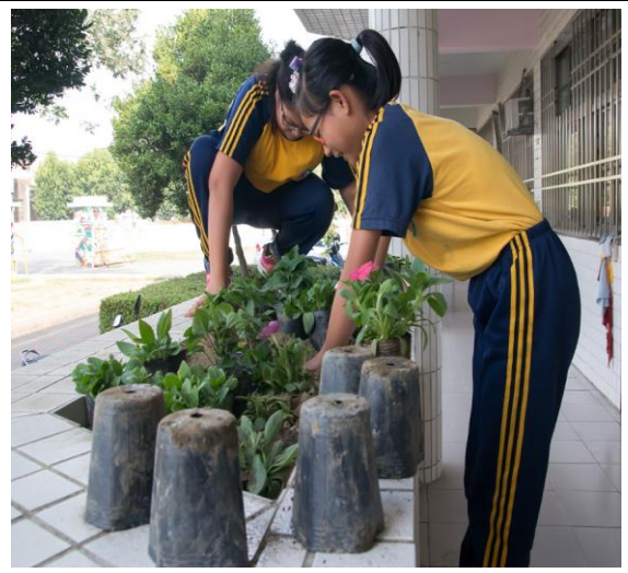
學生參與校園美化綠化工作