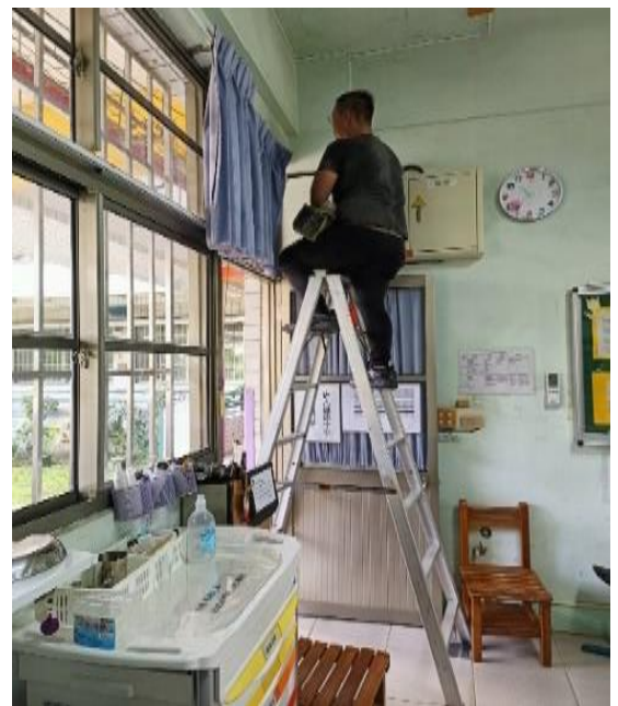
消防廣播系統修繕