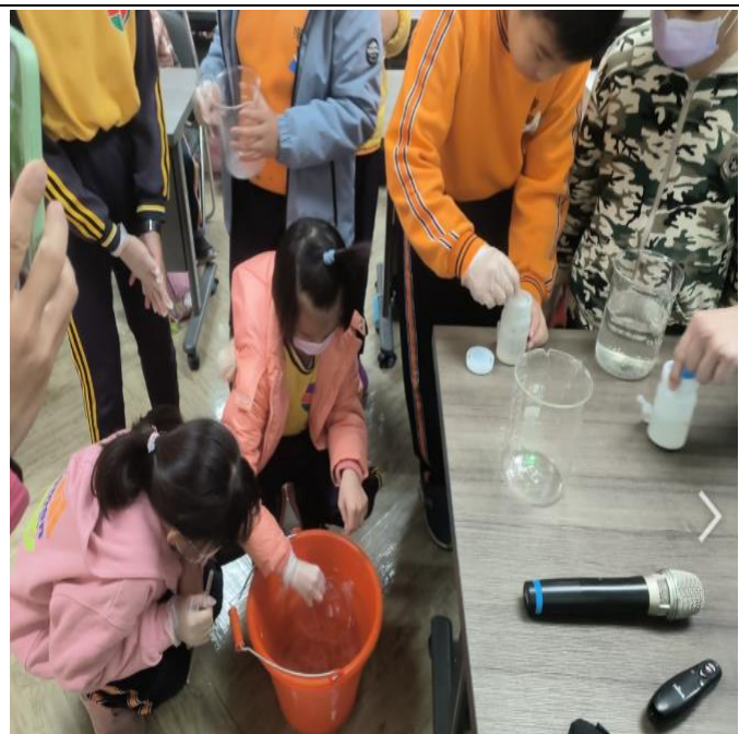
環保教育-認識水資源