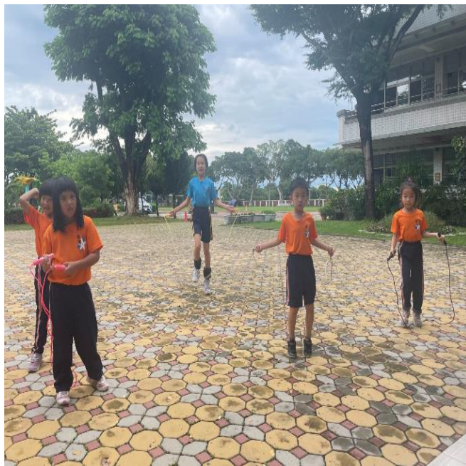
下課後進行健康運動行為