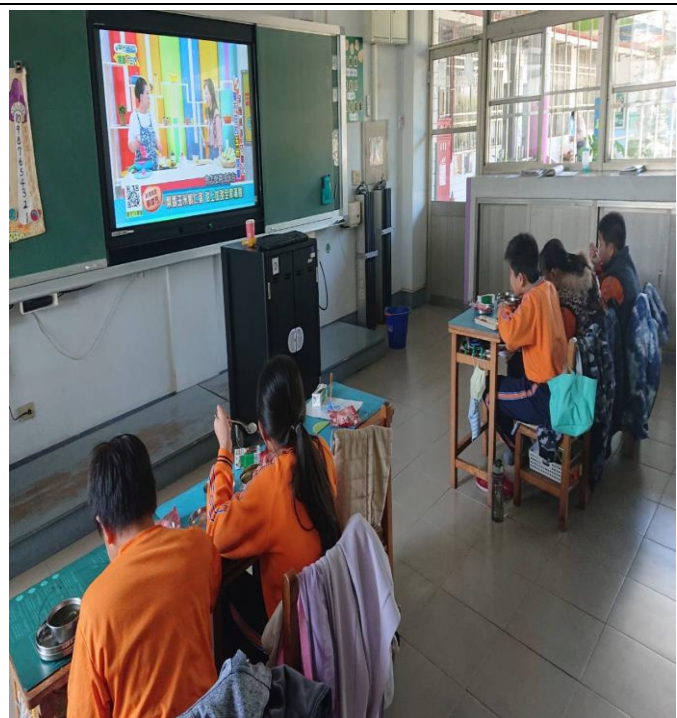
營養教育-餐前 5 分鐘飲食教育