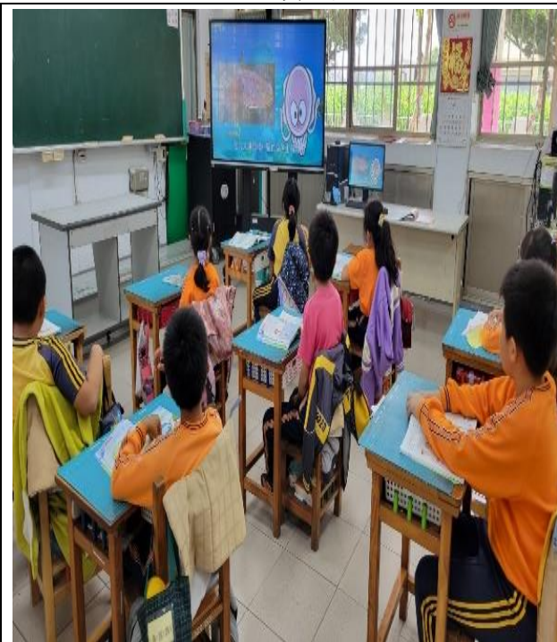
營養教育-餐前 5 分鐘飲食教育