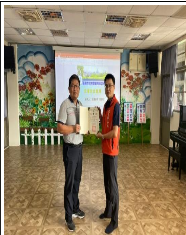
安全教育-警察入校交通安全宣導