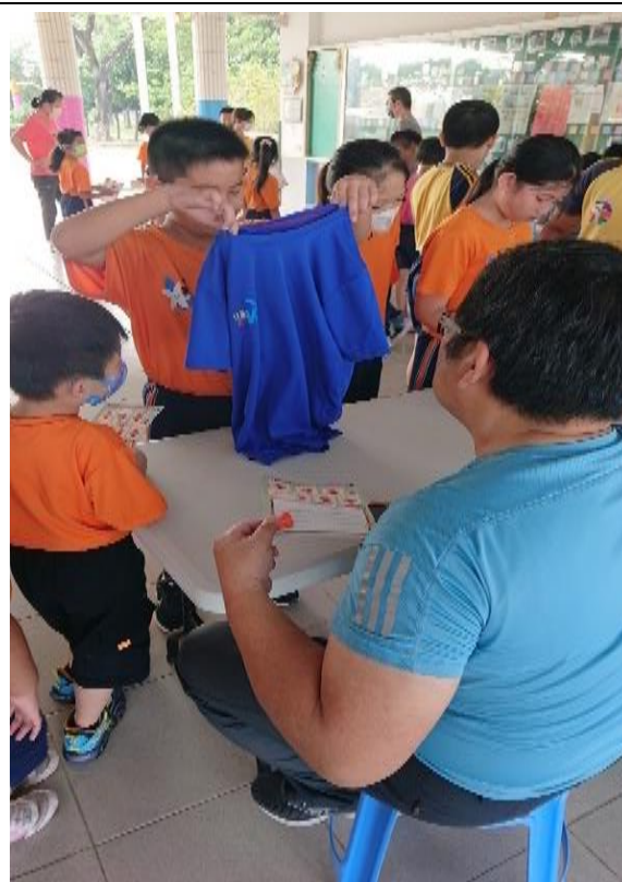
生活教育-家事小達人摺衣服闖關