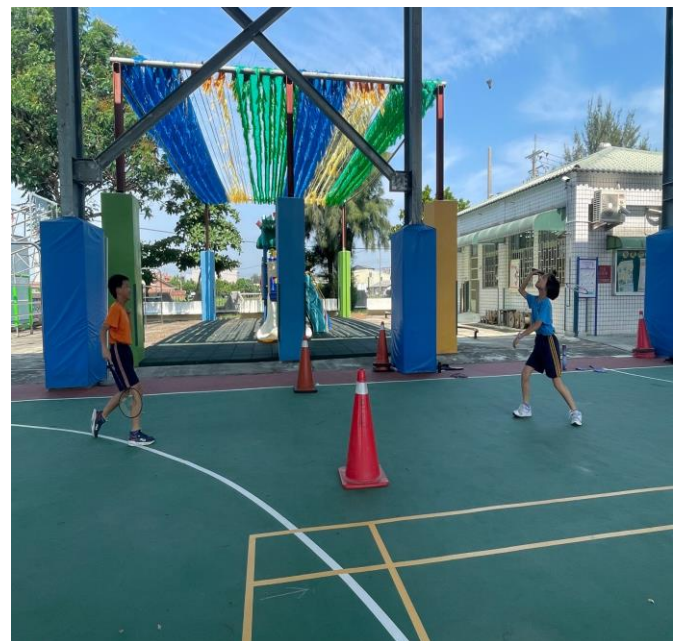
下課後進行健康運動行為