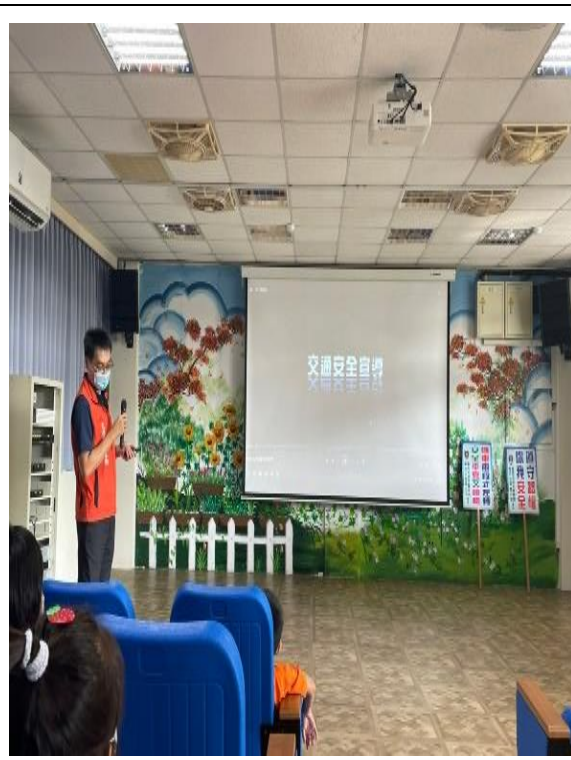
安全教育-警察入校交通安全宣導