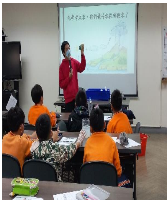
環保教育-認識水資源