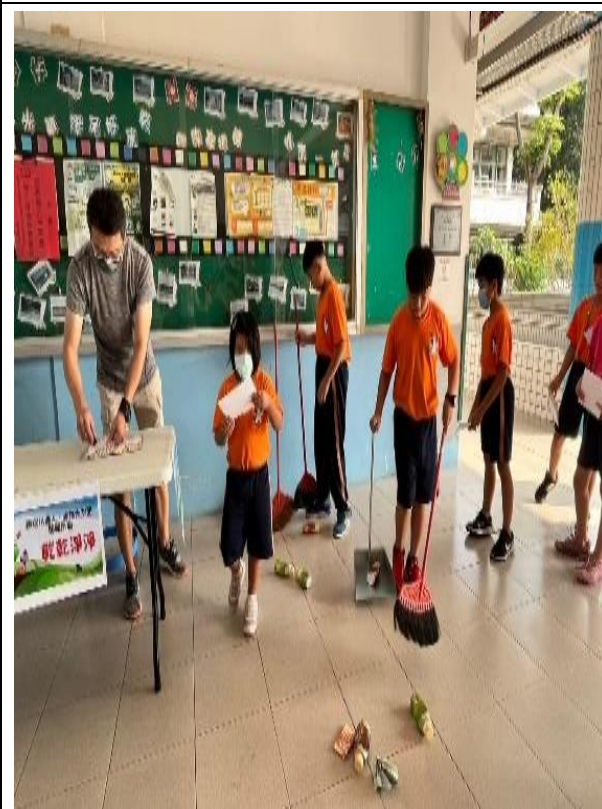
生活教育-家事小達人掃地闖關