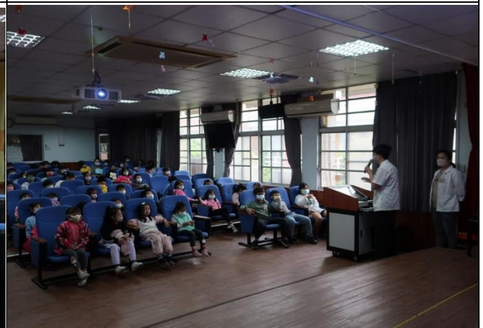
說明：藥師告訴所有學生正確用藥藥和藥師做好朋友有用藥問題要提問