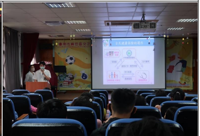
說明：黃藥師向學生介紹全民健保卡的好