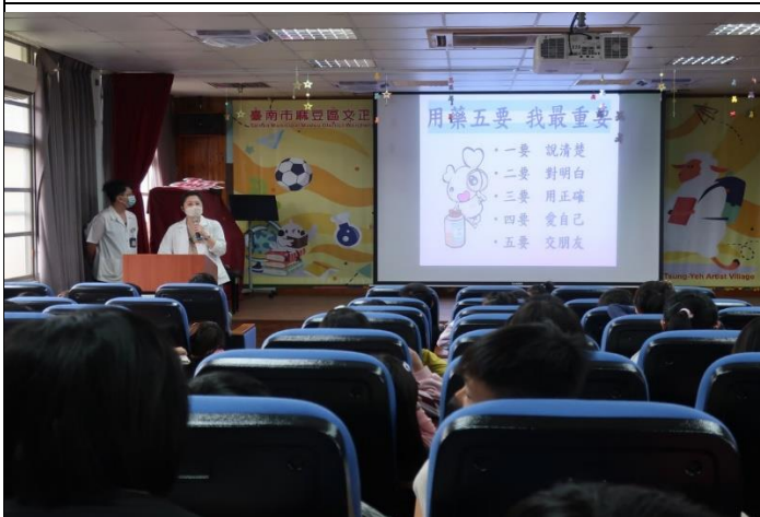
說明：林藥師說明用藥五要，做自己身體的主人