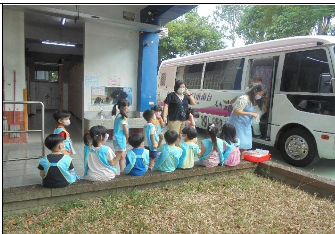
說明：幼兒園排隊執行塗氟