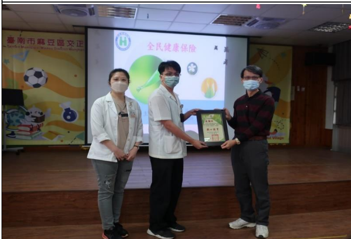
說明：校長頒發感謝函給平安藥局兩位藥師