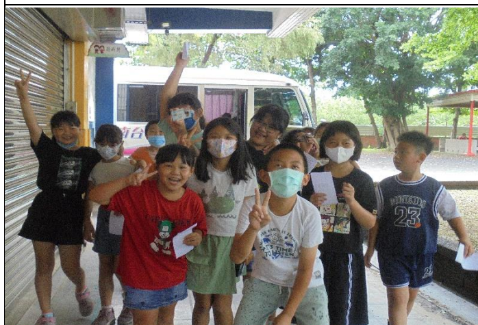
說明：學童與衛生局口腔保健巡迴醫療車