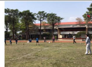
說明：師生足球賽過程。