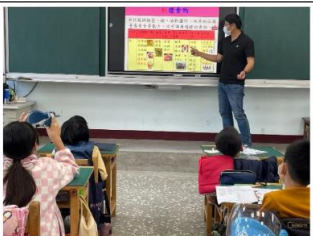
說明：提醒學生紅燈的食物少吃