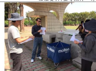
說明：校長勉勵社群教師能將足球相關英語帶入課程中使用。