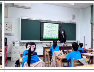
說明：了解青春期的身體各項變化