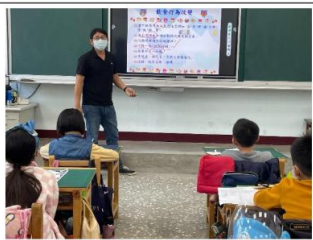
說明：提醒學生飲食行為的改變