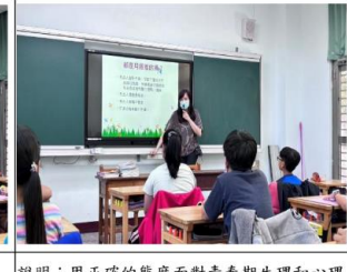
說明：用正確的態度面對青春生理和心理的各項變化