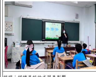
說明：認識月經的成因及影響