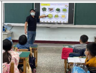
說明：向學生宣導多吃蔬菜