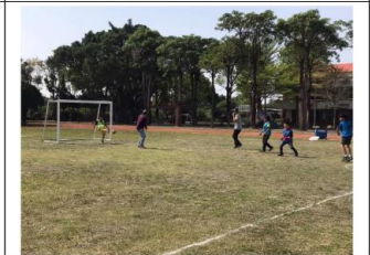
說明：師生足球賽過程。