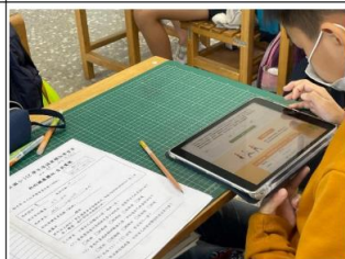
說明：學生透過平板撰寫學習單