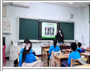
說明：認識男學生的生殖系統