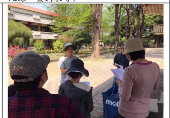
說明：主任簡單介紹足球相關英語。