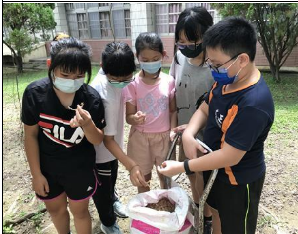
說明：學生認識天然填補樹洞材質-水苔，而非灌水泥或熱熔膠，除了不美觀且不環保；之後，開始動手使用水苔填補樹洞。