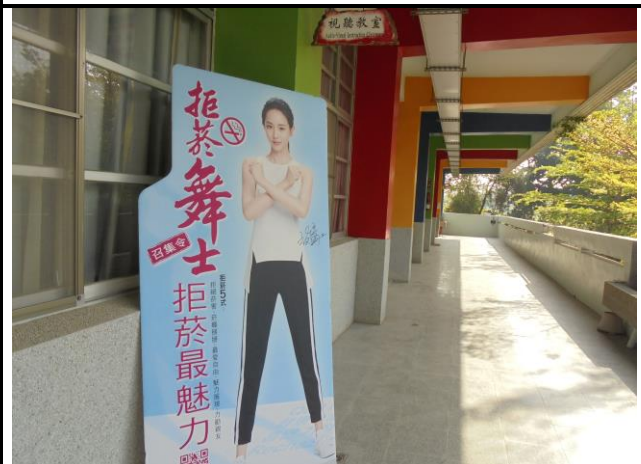
每個走廊明顯處擺放禁菸看版