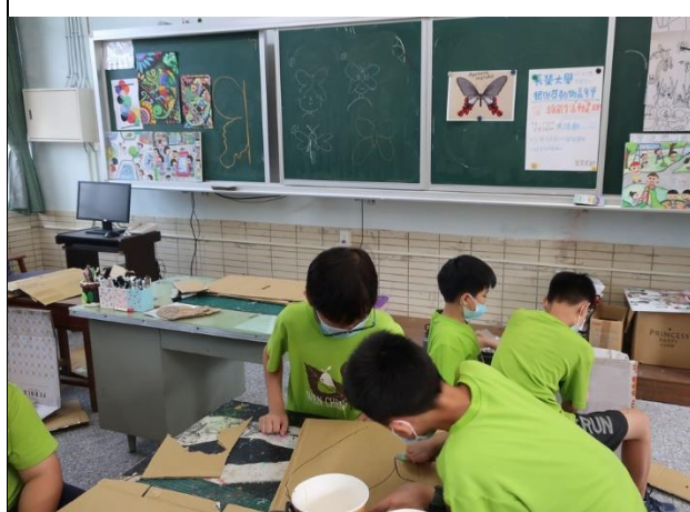
說明：學生於課堂中使用回收紙箱製作寬尾鳳蝶。