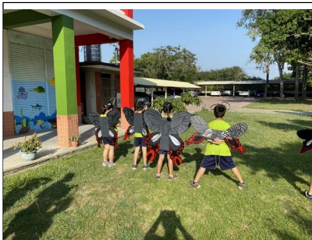
說明：學生們化身蝴蝶，成為校園綠化環境的一部份了~~