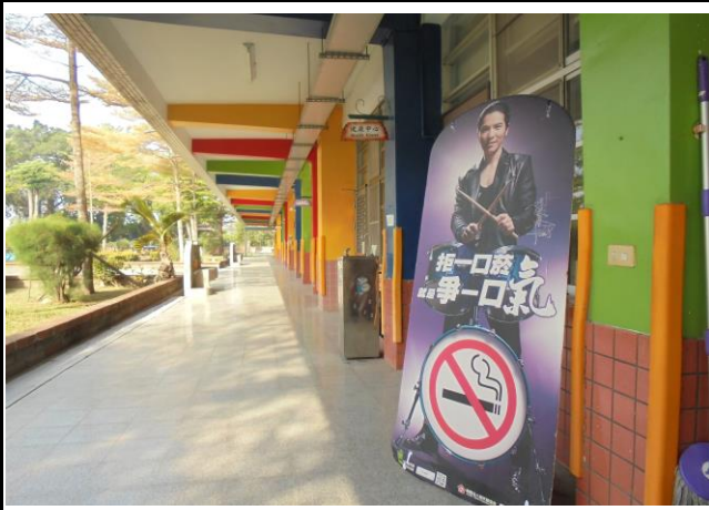
走廊擺放禁菸看版