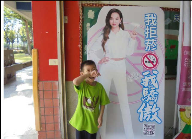
教室外擺放禁菸看版