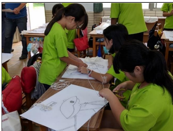
說明：學生使用鐵絲製作工藝品