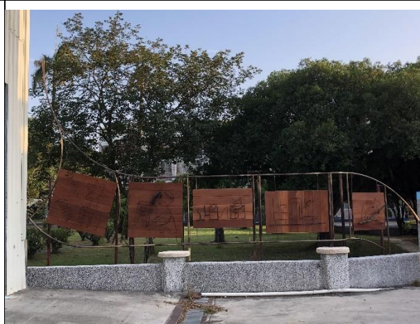
說明：學生作品成為校園美景的一部份