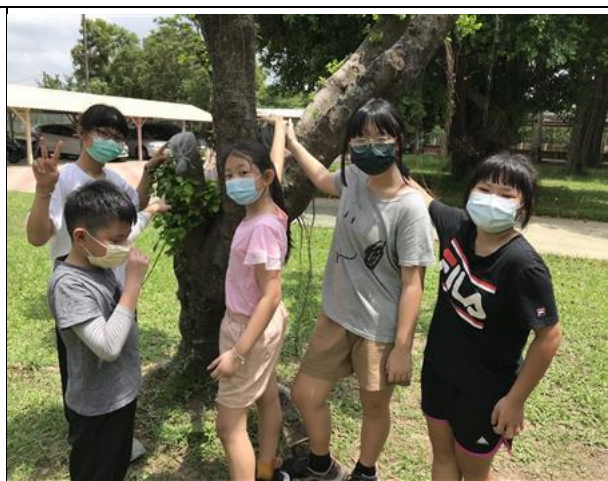
說明：完成了!既美觀又環保!登革熱季節來臨時，就不怕樹洞孳生子子囉!