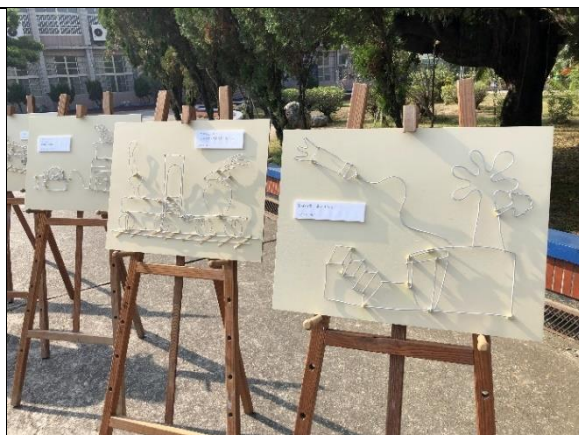
說明：學生作品展示