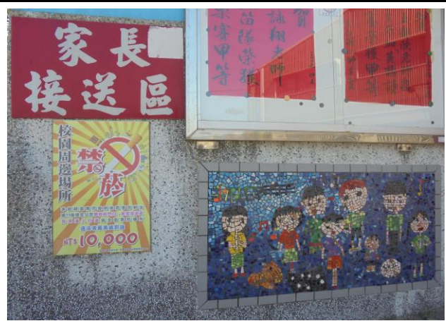
校門口布告欄旁處張貼禁菸標誌