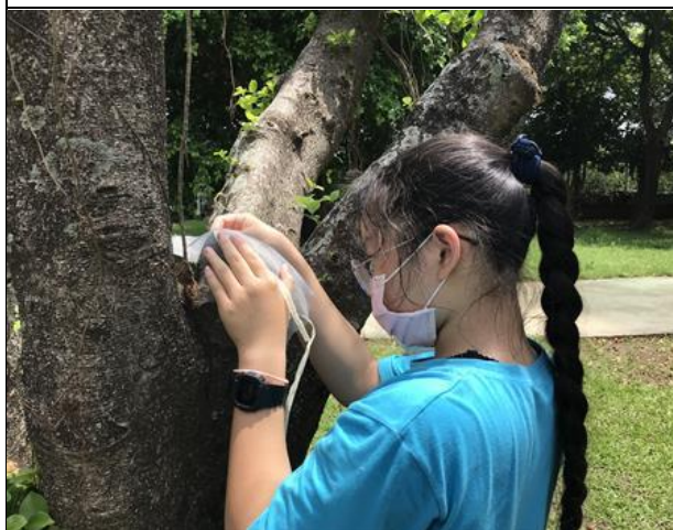
說明：學生使用細紗網填補樹洞。