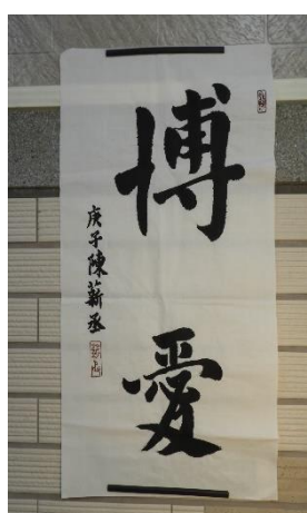
說明：學生書法聯展作品，張貼於校園一隅。