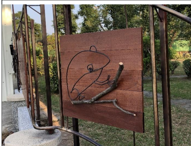
說明：學生充滿童趣的作品，更添校園風光。