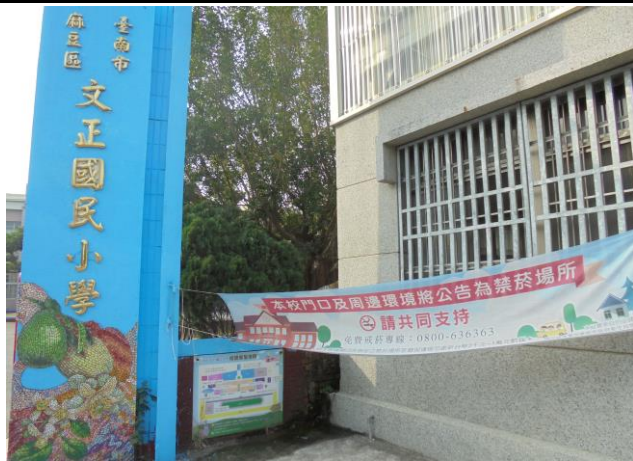
懸掛校園周邊場所禁菸宣導布條