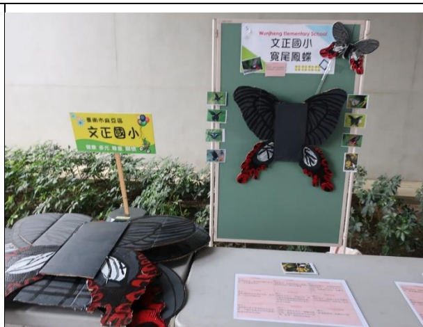
說明：將學生製作寬尾鳳蝶之作品展示於校園。