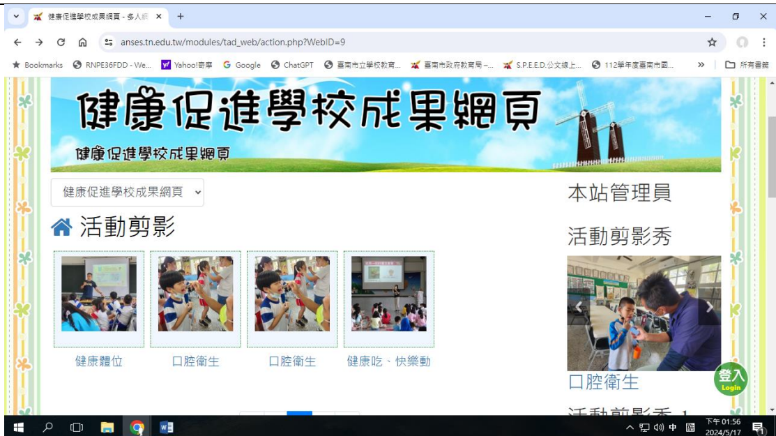
學校健康促進網站活動剪影依活動主題呈現