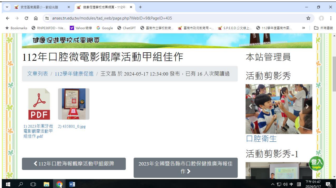
學校健康促進網站資料定期更新，內容豐富