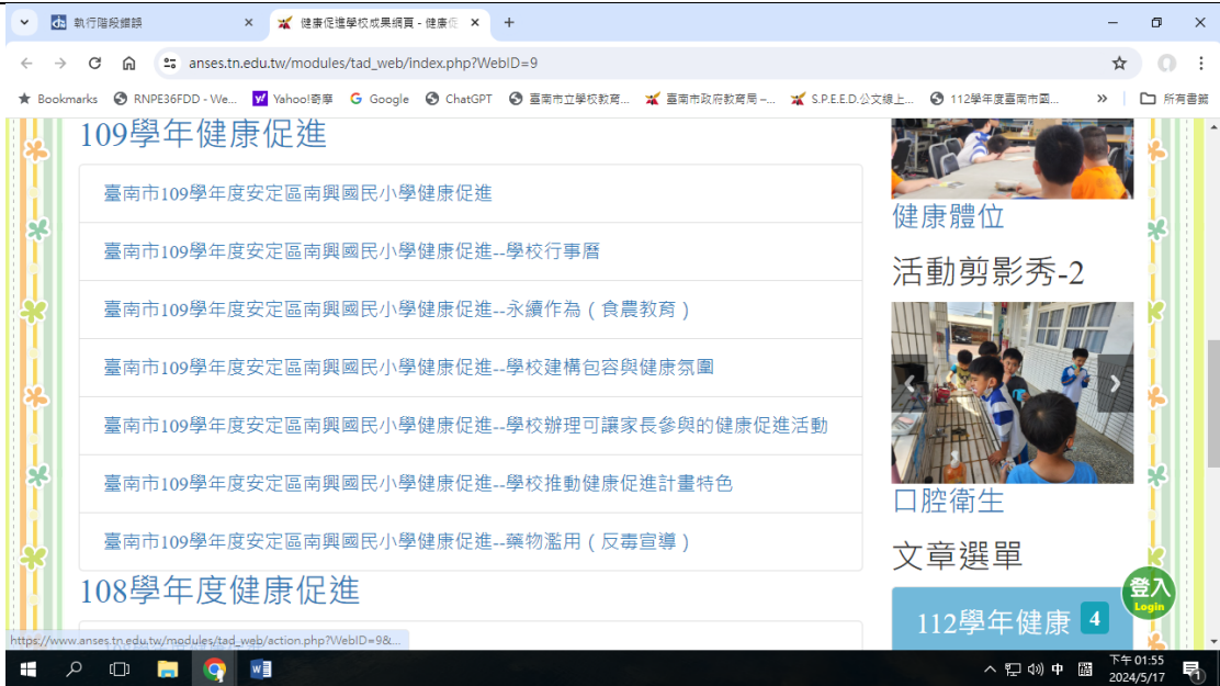
學校健康促進網站按照年度逐一呈現