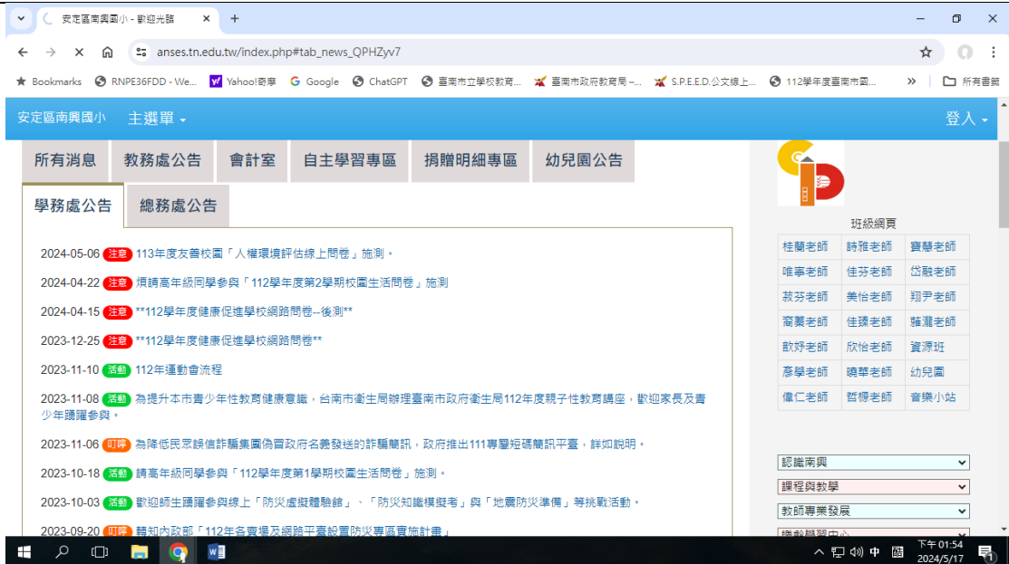
學校健康促進網站資料定期更新