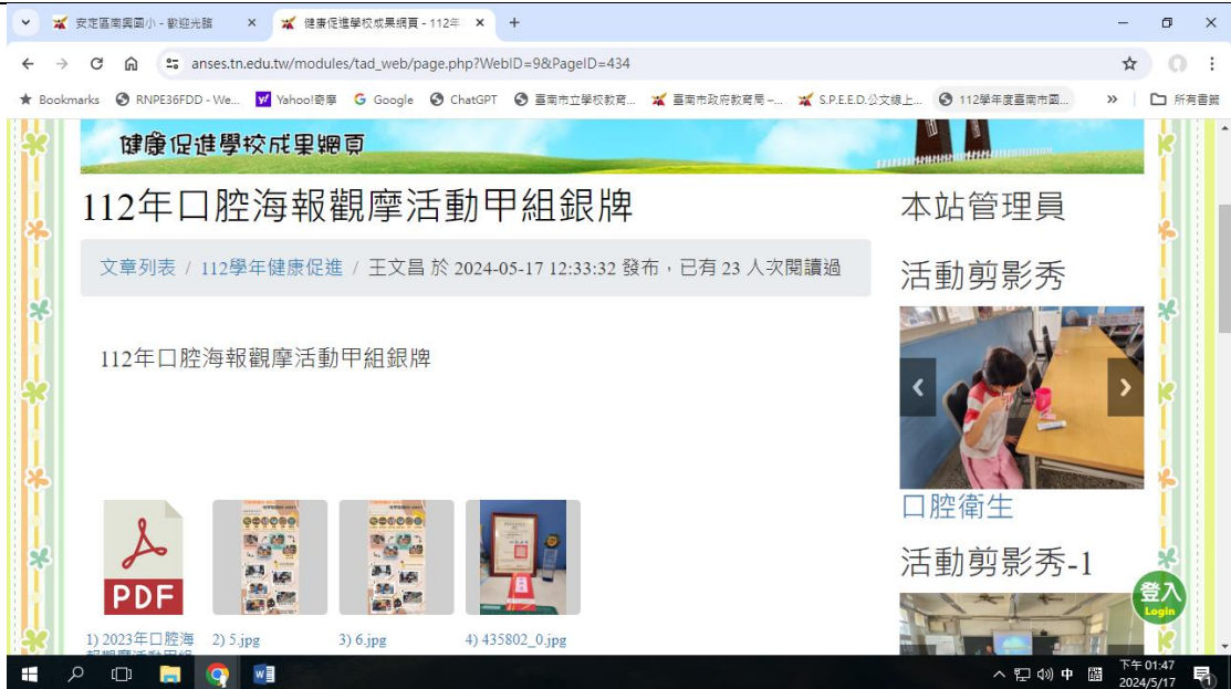
學校健康促進網站資料定期更新，內容豐富