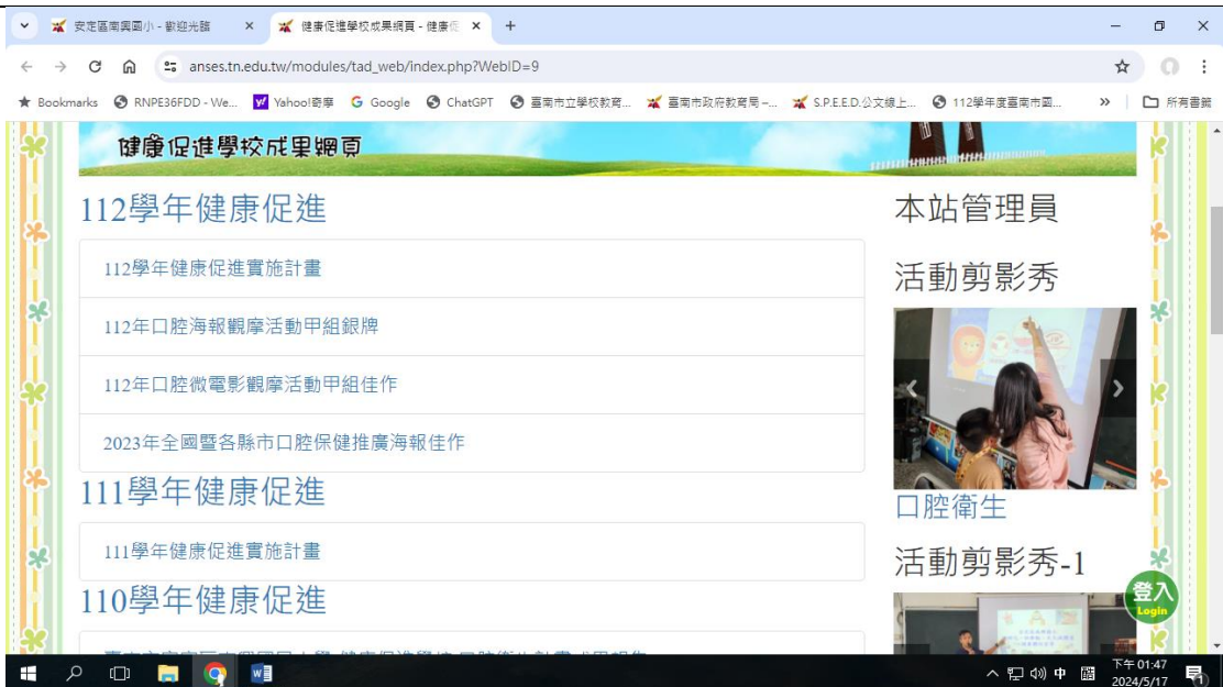
學校健康促進網站按照年度逐一呈現