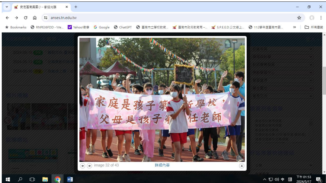
學校健康促進網站首頁活動照片跑馬燈內容豐富