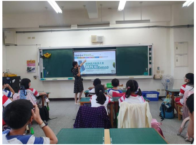
老師進行餐前五分鐘網站講解