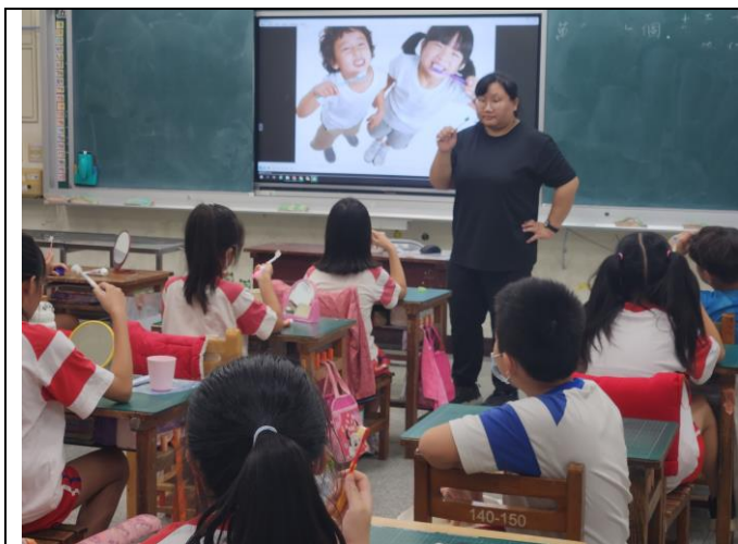
教師利用餐後時間指導學生督導式潔牙