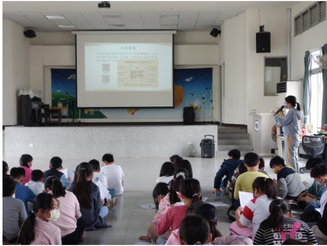
利用學生朝會時間老師進行飲食 營養知識宣導