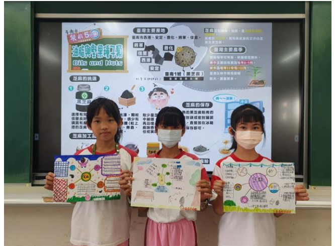
學生分享餐前五分鐘學習單