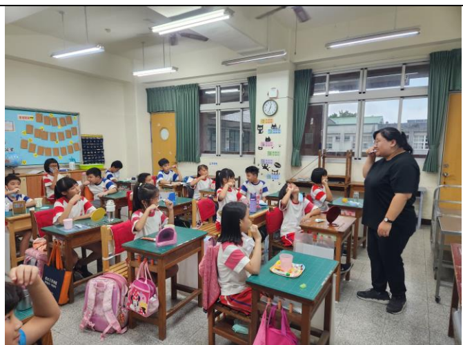
教師示範，帶著學生做督導式潔牙