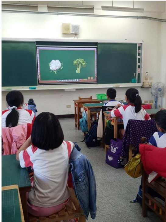
學生於餐前觀看餐前五分鐘影片