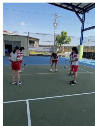
下課多元活動-民俗體育扯鈴