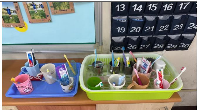
學生潔牙用具擺放通風且區隔， 建立學生正確的習慣與行為