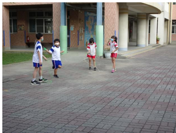
下課多元活動-跳繩