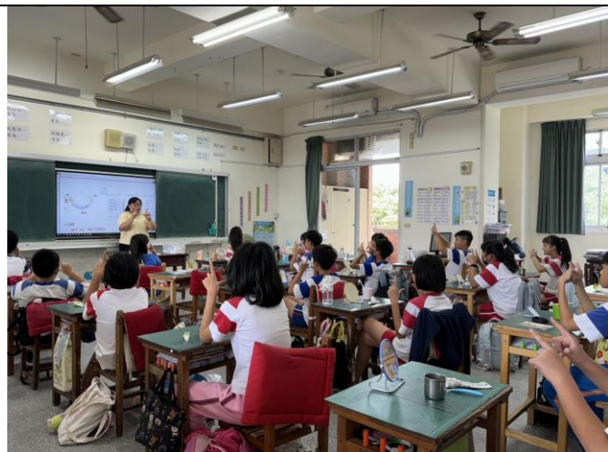
教師利用餐後時間指導學生牙線使用