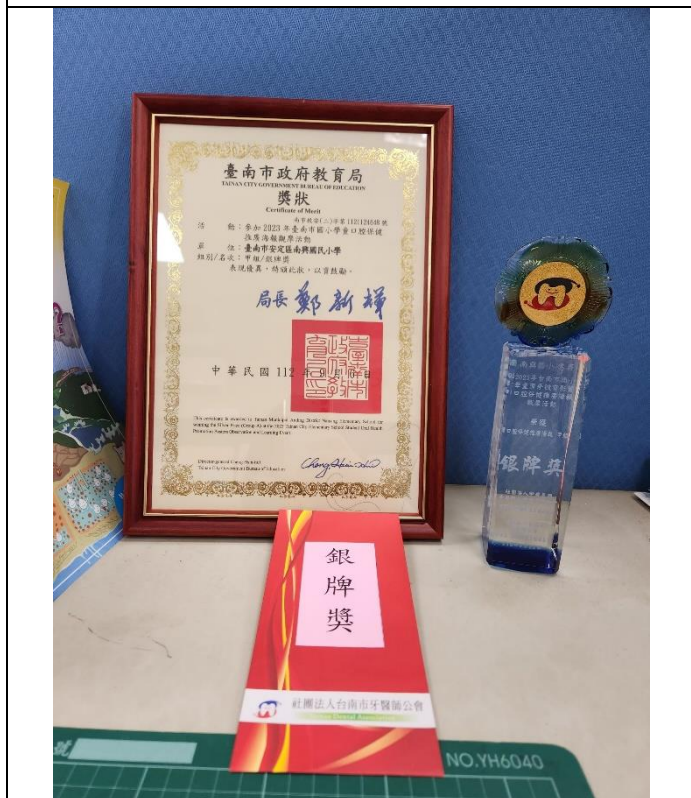
本校榮獲2023臺南市校園口腔保健推廣 海報佳作-教育局獎狀、獎盃及獎金