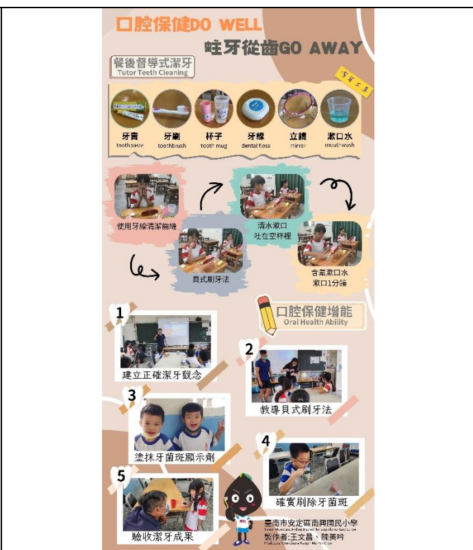
本校2023全國校園口腔保健推廣佳作 得獎海報