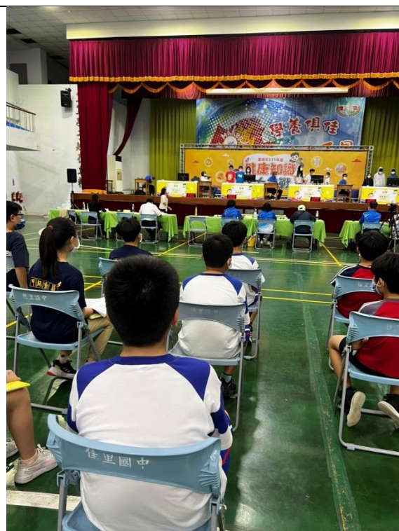
健康知識大挑戰會場照片