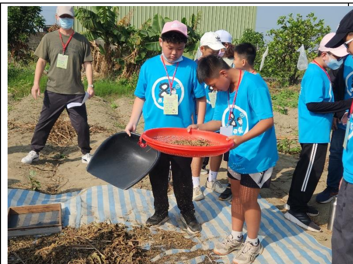
親自篩麻專注檢查有無遺漏黑金芝麻。