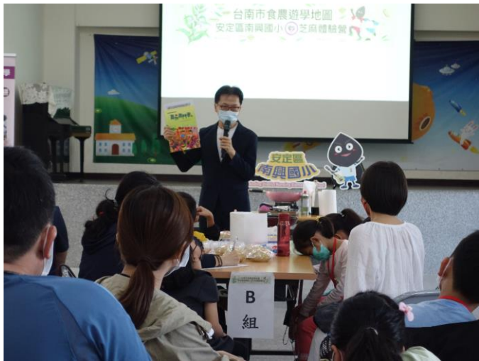
校長致詞歡迎大家，並介紹學校團隊編輯的家鄉繪本-直佳弄門香