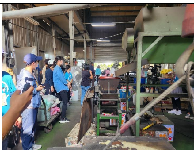
參觀麻油工廠，看麻油壓榨的過程