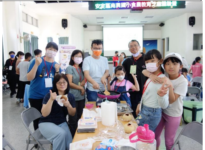
親子同樂煎香噴噴的麻油椪餅