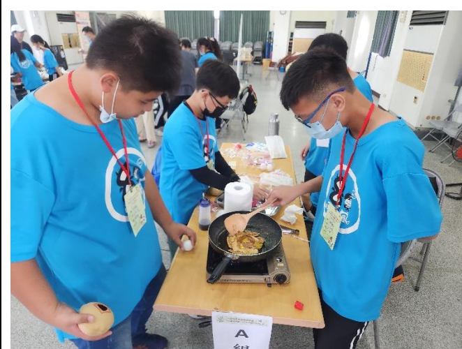
六年級學生煎香噴噴的麻油椪餅