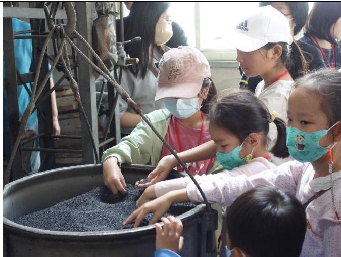
孩子親自觸摸製作麻油的芝麻！