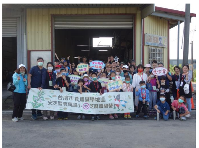
參加學員在傳統麻油工廠前合影