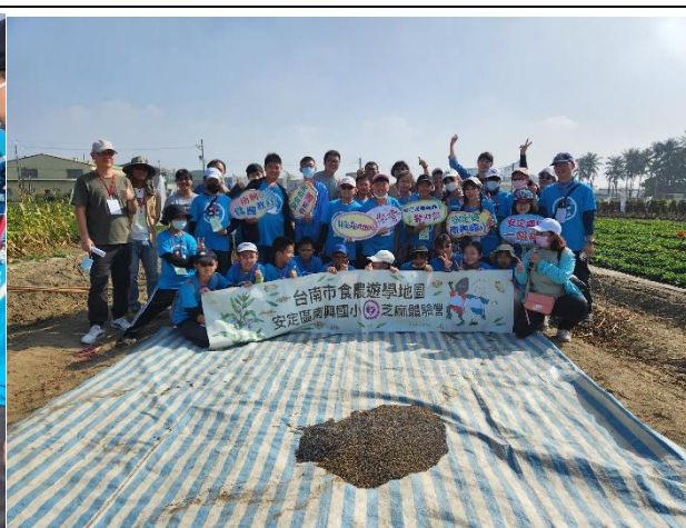
佳里國小師生及教育局宗暘科長合影。