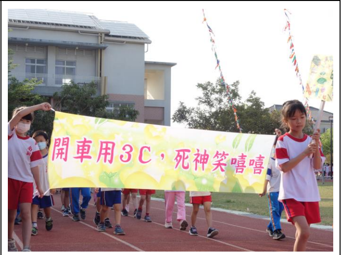
運動會各班級，領各主題健康促進旗幟 入場（幼兒園入場）