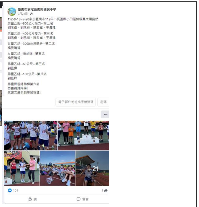
設立南興國小 FB 對外溝通