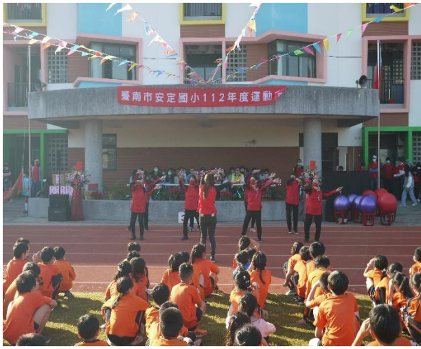
樂齡中心學員健身操表演