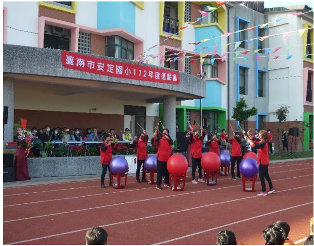
樂齡中心學員擊鼓表演