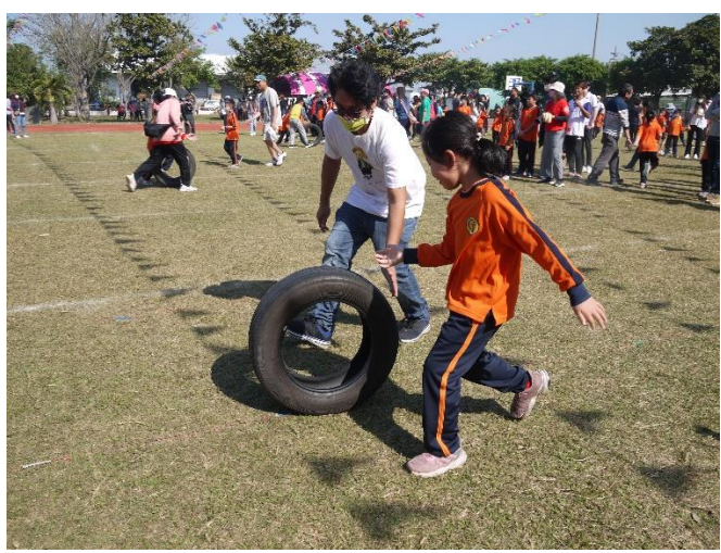
親子趣味賽-和爸爸一組超開心