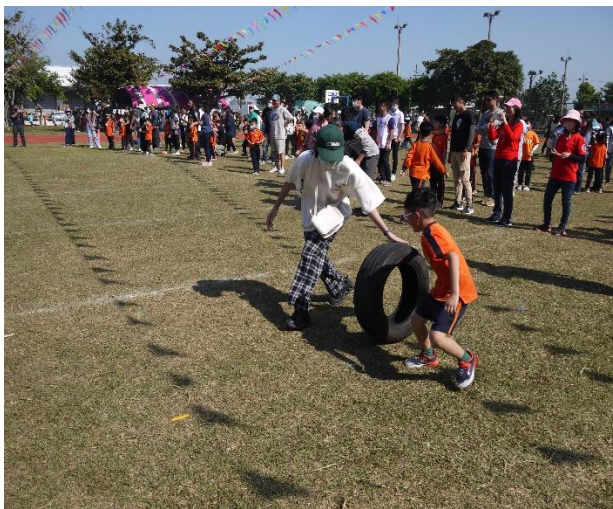
親子趣味競賽-讓媽媽也動一動