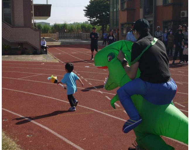
幼兒園親子趣味競賽