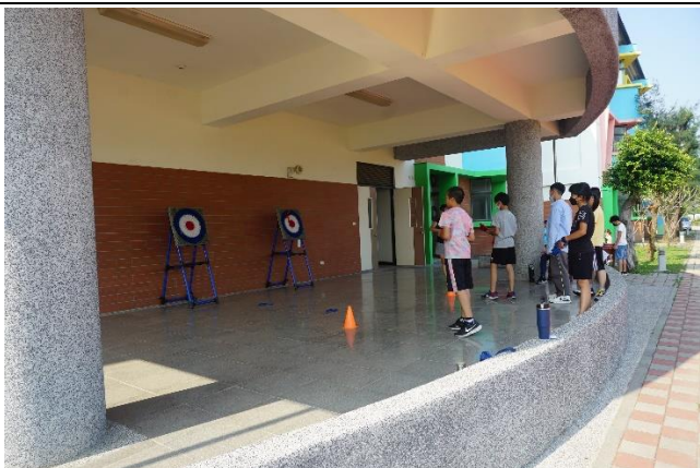
擲斧大師-斧頭擲準