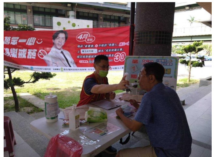
測量吸菸者肺部一氧化碳的濃度