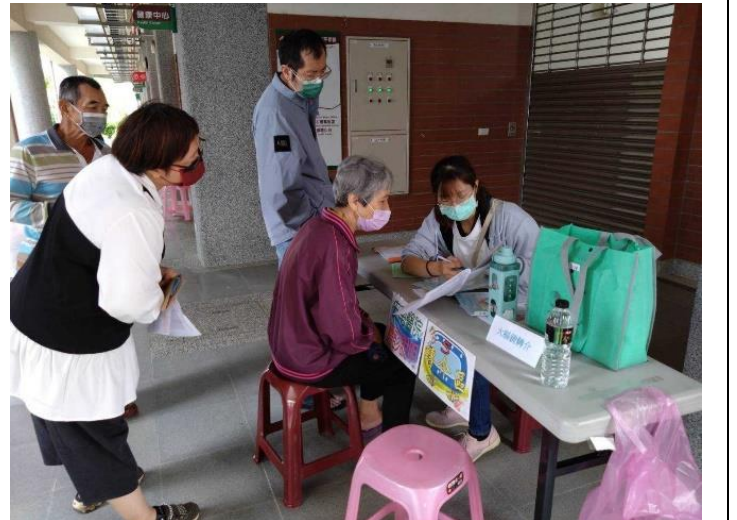
初步糞便潛血檢查