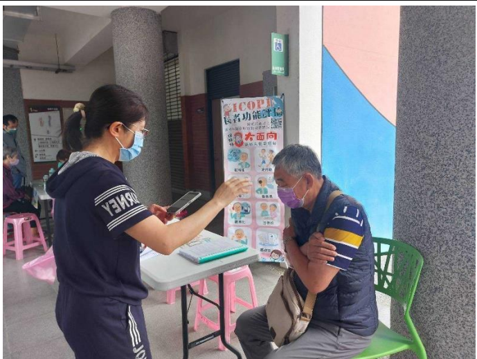
長者健康整合式功能評估(ICOPE)-行動能力