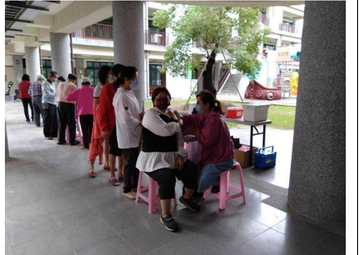
結合新冠疫苗施打