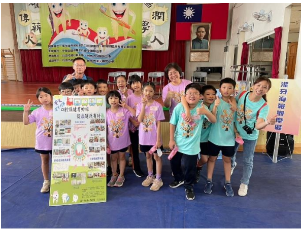
比賽結束，開心合照