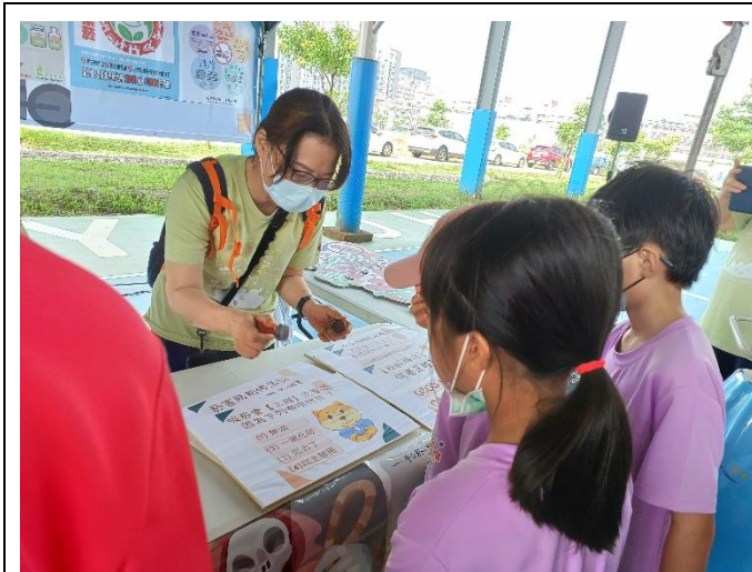
拒絕菸害，輕鬆自在