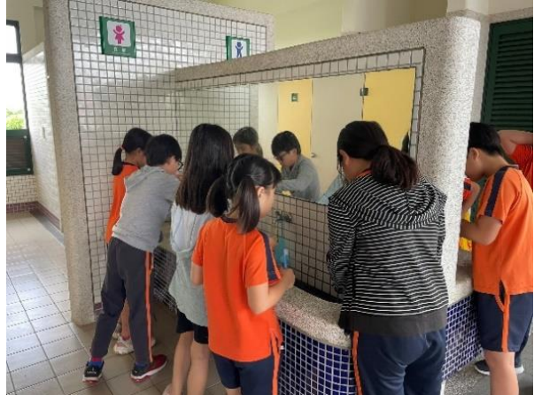
培訓：刷完牙漱口及清洗