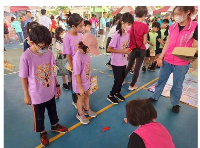
筴杯開運，「營」得先機