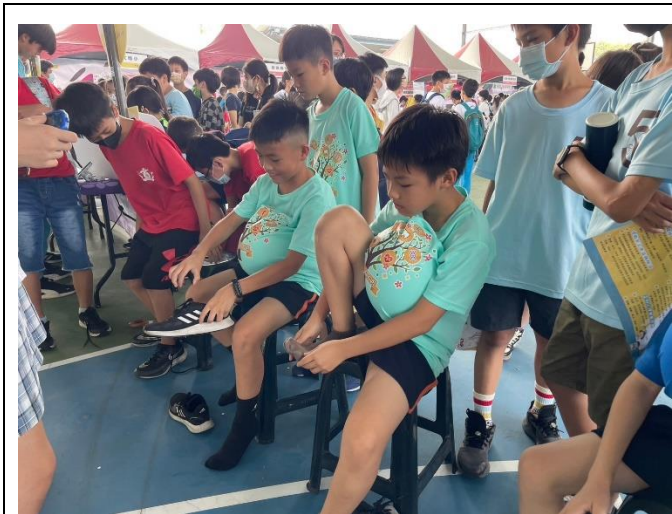
換我當媽媽-孕媽咪體驗活動