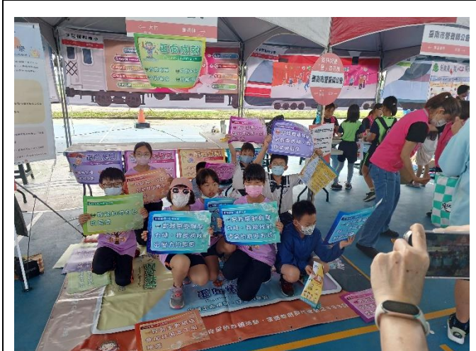
幸福方程式-五正四樂