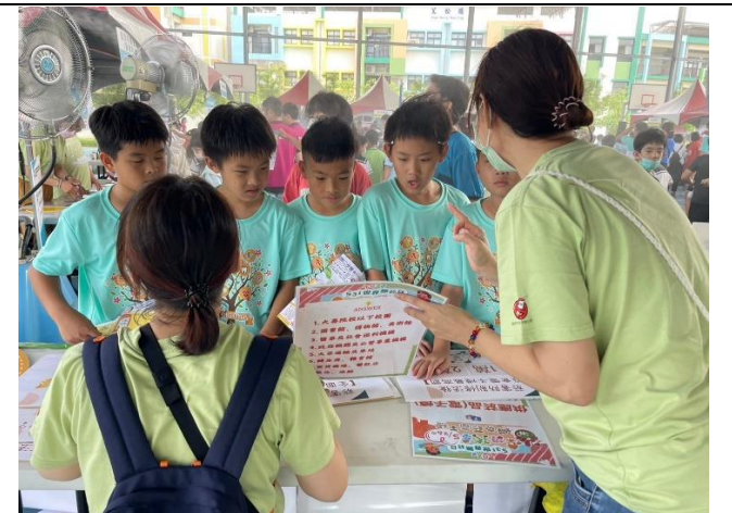
拒絕菸害，輕鬆自在