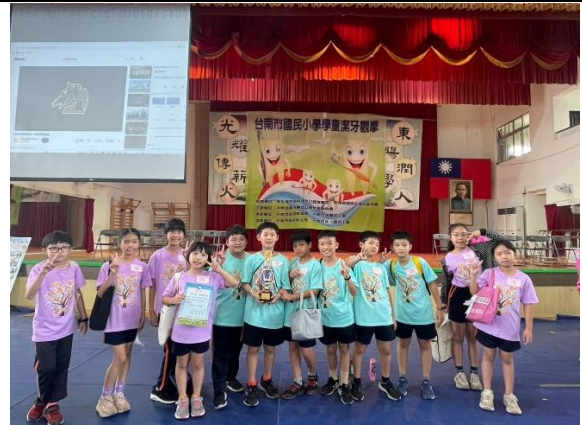
頒獎結束，準備回校