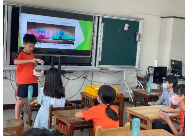
培訓：學生上台練習