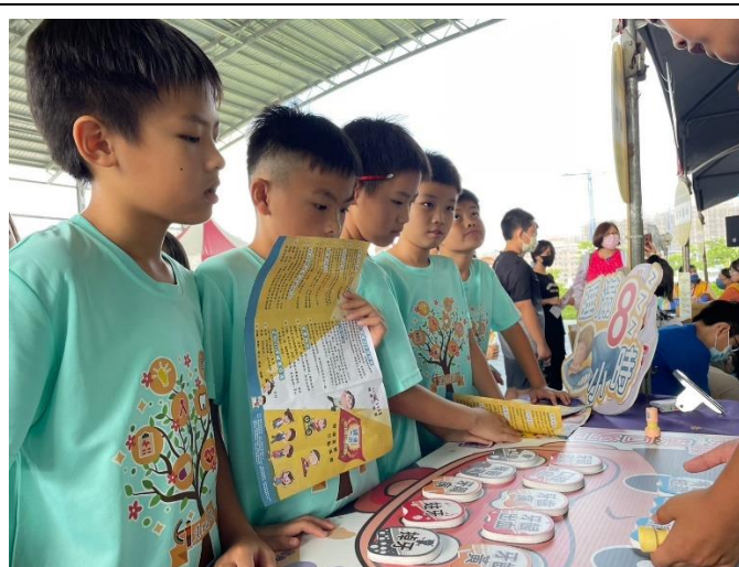
檳檳無禮-檳榔對口腔的危害