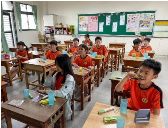
培訓：學生練習貝氏刷牙法