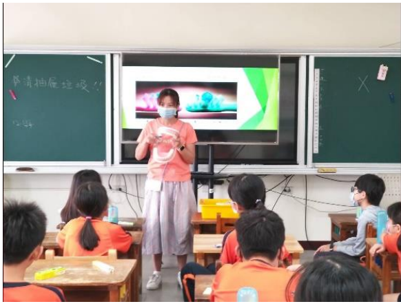
培訓：護理師示範潔牙手勢