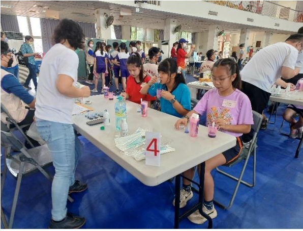
含漱牙菌斑顯示劑