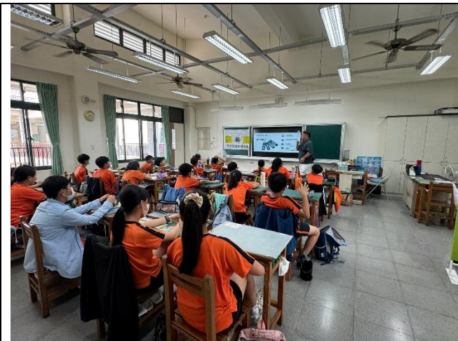
4/19 介紹四健會的由來以及未來的發展與願景