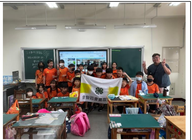
4/19 介紹本次作業組課程重點。