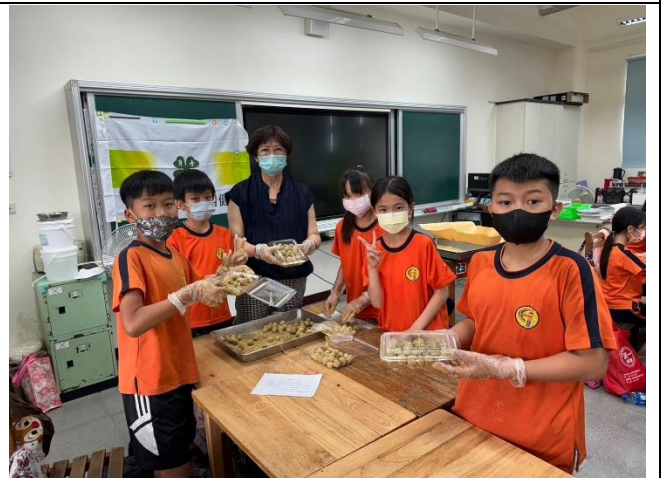
4/25 新鮮自製的芝麻餡感覺比外面買的更好吃