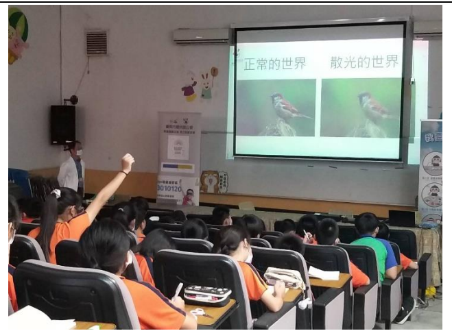
視力正常和散光的比較