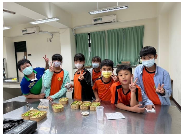
4/26 胡麻清油青醬雞肉燉飯