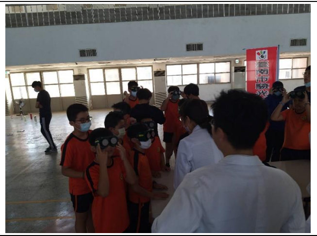
模擬視力缺損者的視野