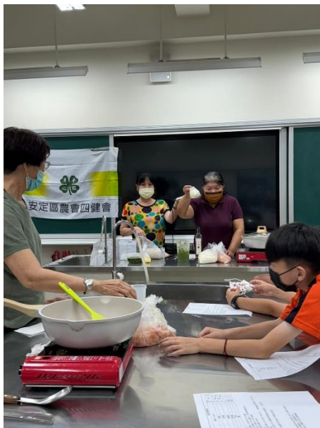
4/26 建立會員對食物的正確觀念，安全健康遠比味蕾的享受來的重要，鼓勵會員多食用天然食物，減少垃圾食物的攝取。