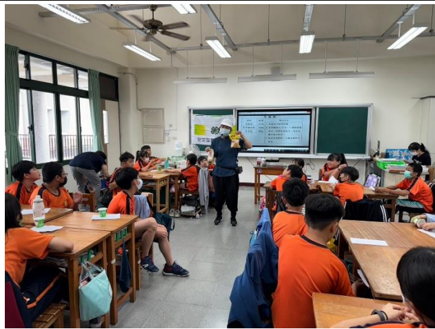
4/25 在地食材介紹及體驗—芝麻餡