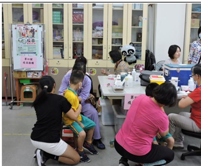
當日志工媽媽協同衛生所完成接種