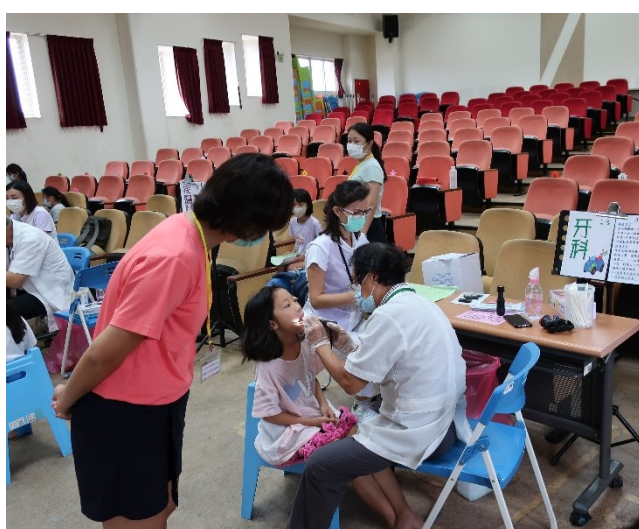
配合教育局施行一四年級健康檢查