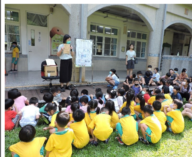
112 學年度健康檢查行前說明會