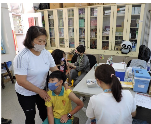
113 年 COVID-19 莫德納 XBB 疫苗接種