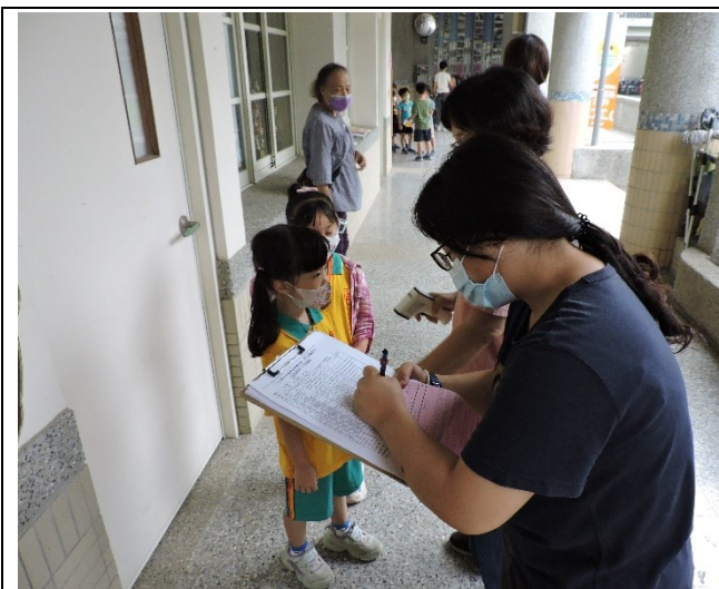
核對身份並測量體溫