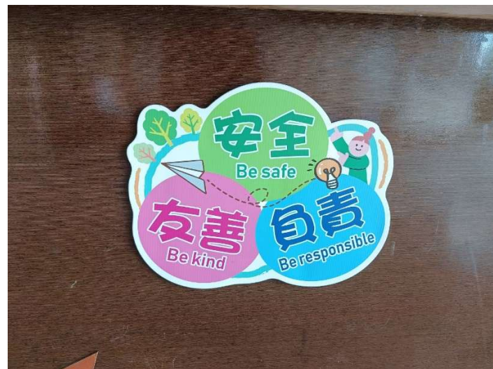
CW Fit 善化三法寶