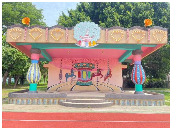
校園建築透過馬賽克瓷磚的藝術拼貼，營造活潑快樂的氛圍