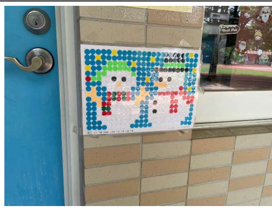
學生藝術創作拼貼圖結合節慶布置