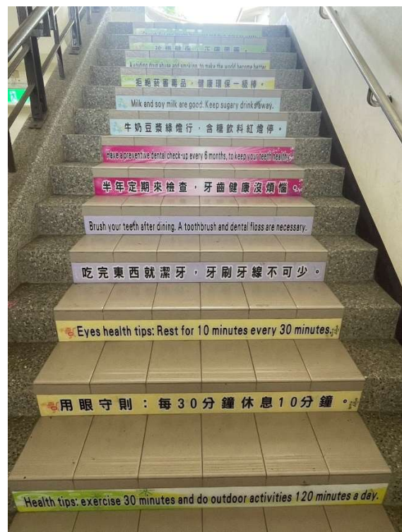
階梯布置中、英文的健促標語