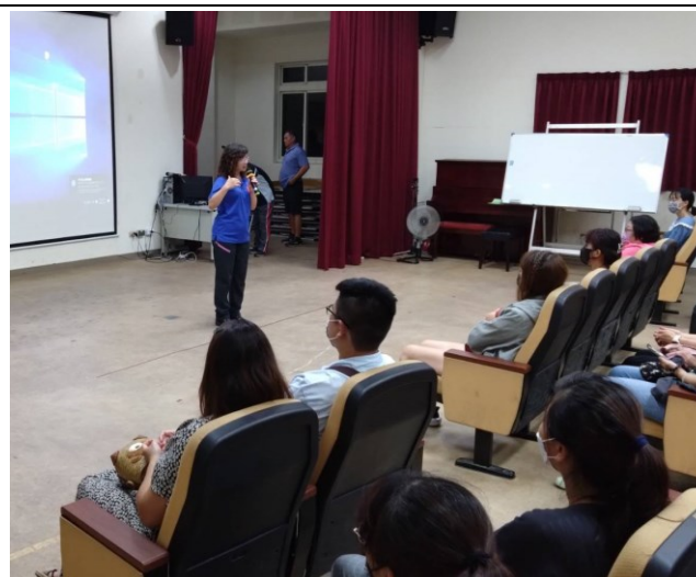
班親會校長開講倡議健促重要性