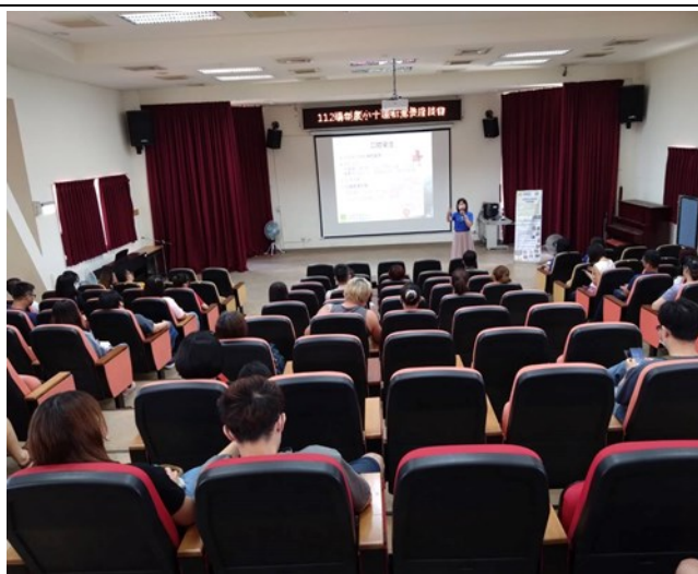
辦理新生家長座談