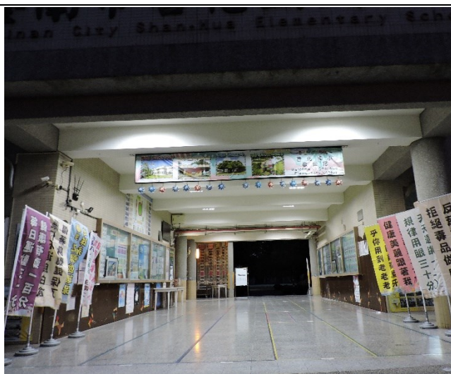
112 學年度班親校園營造