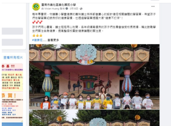
經營學校臉書社群傳遞健康訊息