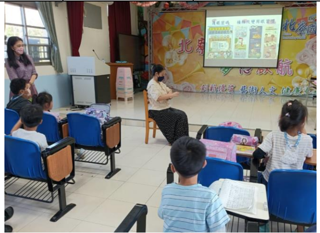
說明：課後照顧班-宣導[護眼密碼—積極改變用眼習慣]