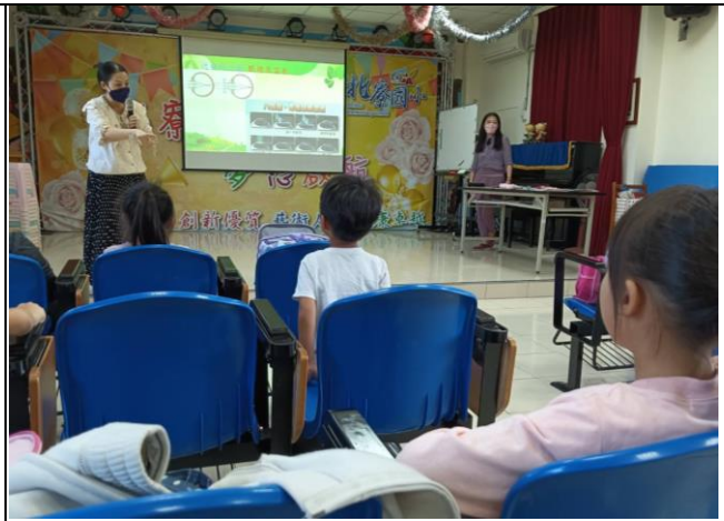
說明：課後照顧班-認識[眼睛結構][近視與遠視]