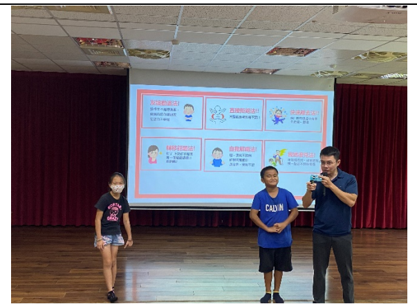
邀請台南市警察局入校向學生、家長宣導防制藥物濫用議題