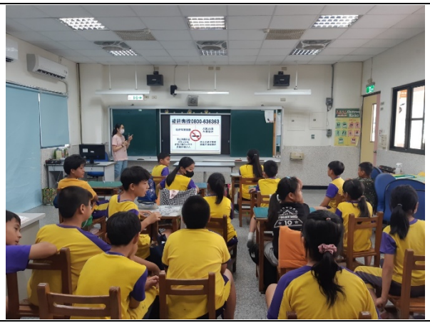
邀請衛生所入校宣導菸害防制議題