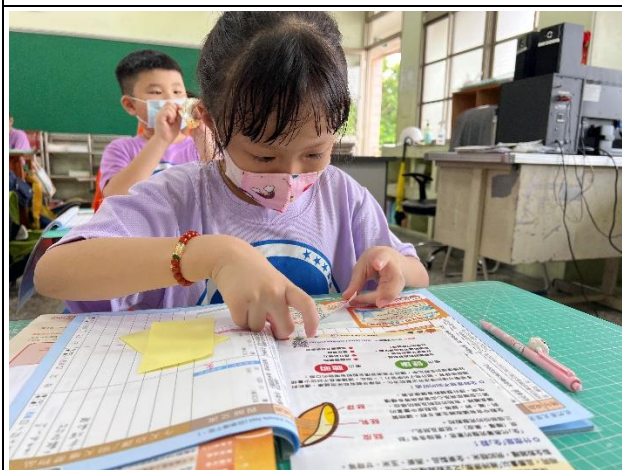
說明：聯絡簿黏貼健康訊息