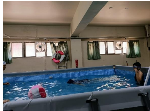
說明:進階班蹬牆漂浮