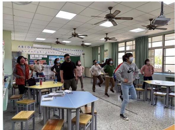
說明：講師帶領校內教師進行有氧運動