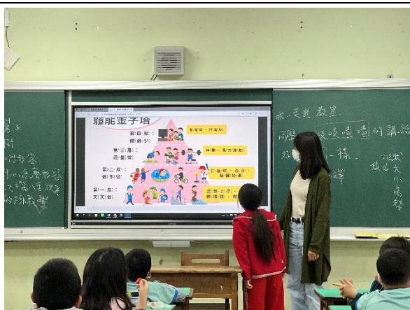
說明：運動金字塔課程