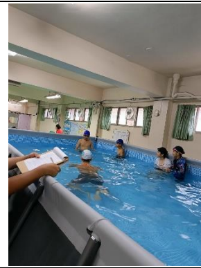
說明:進階班課程加強