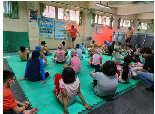
說明：自救防溺宣導