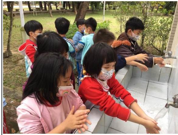
說明：踏查也別忘勤洗手