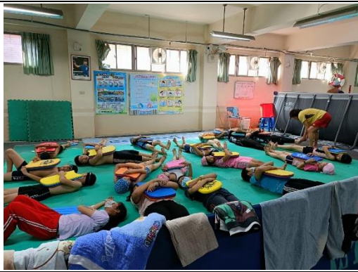
說明:基礎班岸上加強