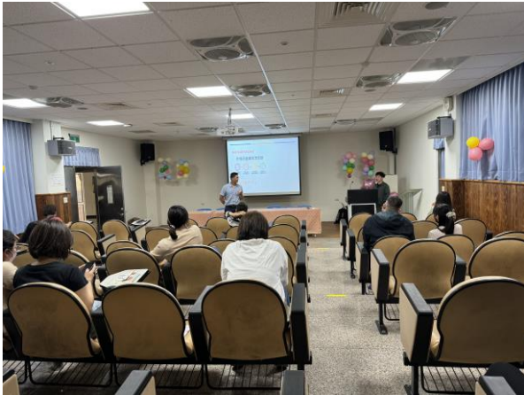
說明：校長開場與介紹講師