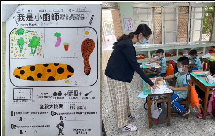
說明：指導學生完成學習單