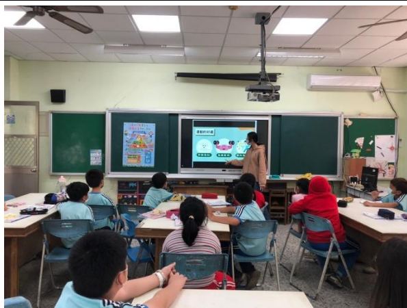
說明：說明運動的好處