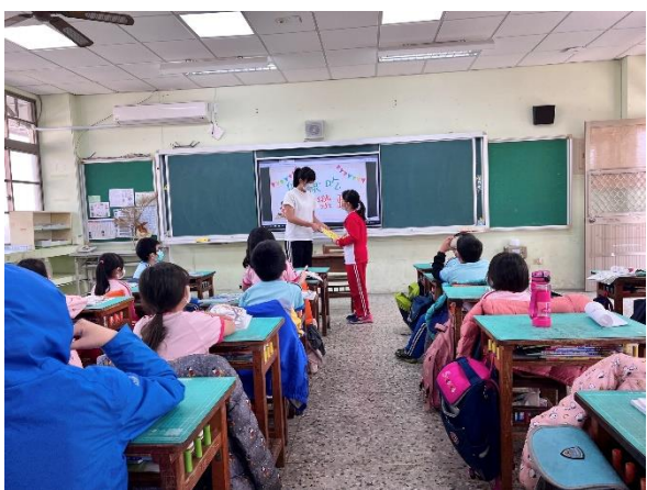
說明：發放健康飲食墊板