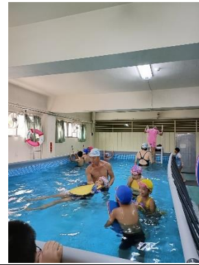
說明:依據能力教授課程