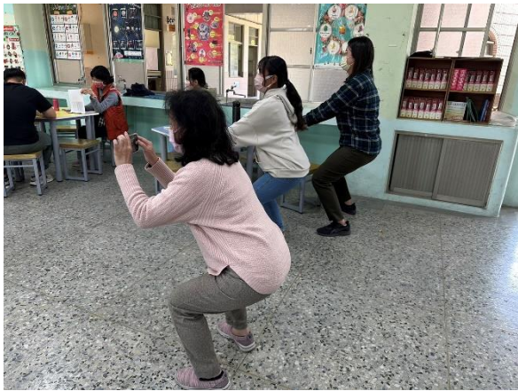
說明：參與教師分組進行深蹲演練