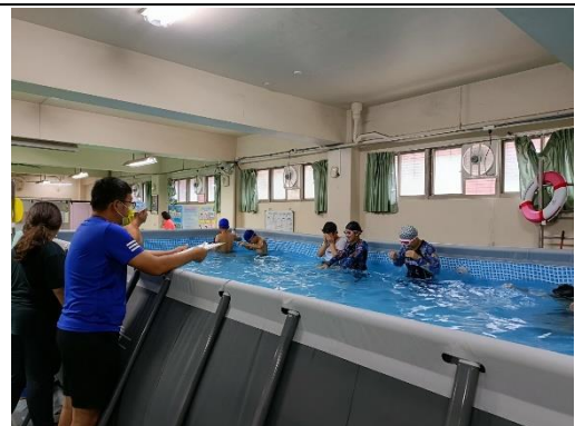
說明:游泳分級檢測