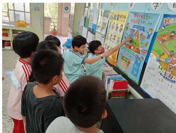
說明：介紹提升食育力海報