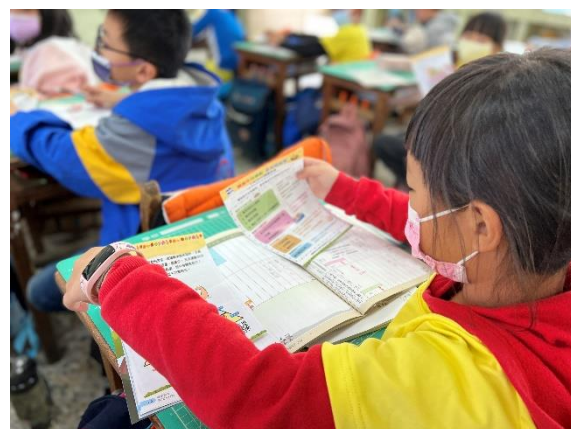
說明：閱讀十大關鍵指標