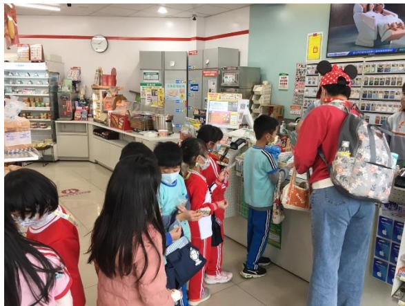
說明：排隊購買符合健康和合宜的食品