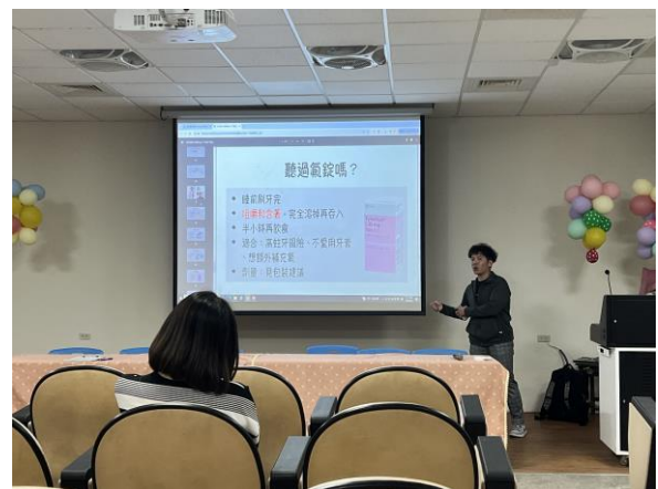
說明：講師帶領校內教師進行有氧運動