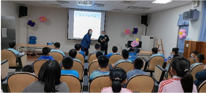
說明：邀請玉井分局警察到校宣導