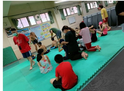
說明：泳帽、泳鏡示範說明