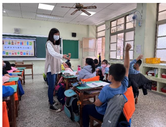
說明：多喝白開水課程