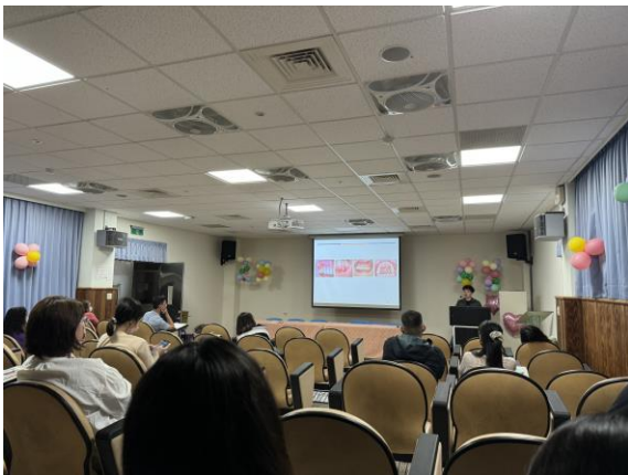
說明：參與教師分組進行深蹲演練