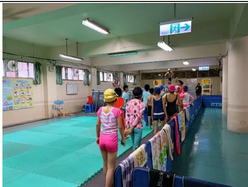
說明：上、下泳池示範