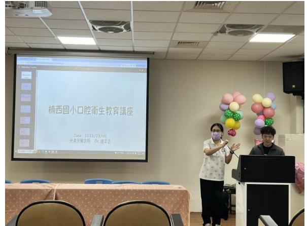
說明：講師示範深蹲動作