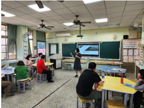
說明：校長開場與介紹講師