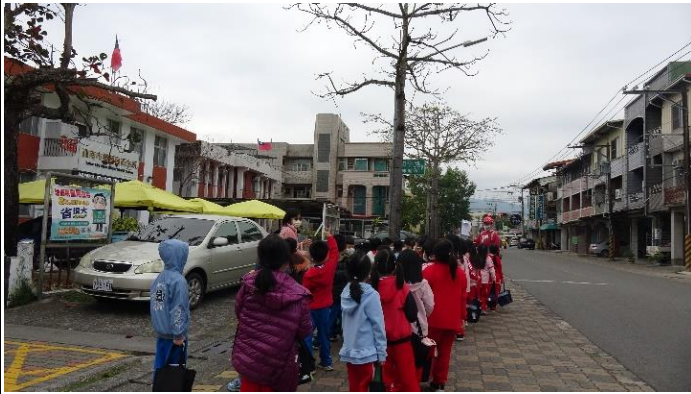
說明：介紹楠西衛生所