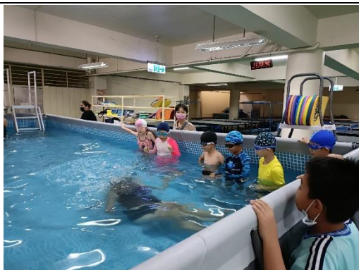
說明:水中拾物說明