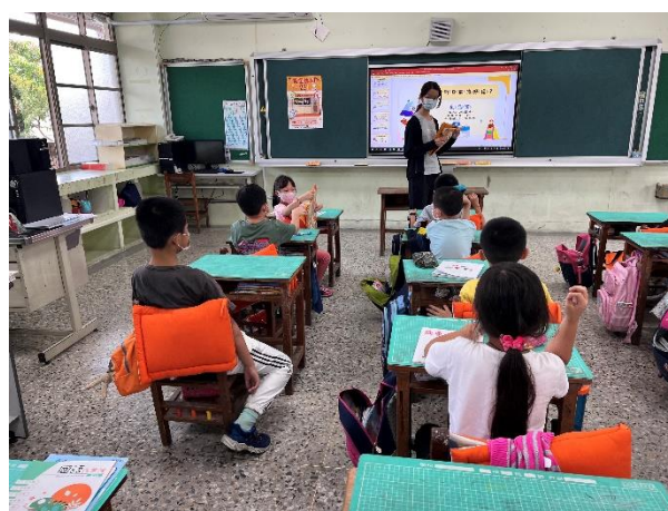
說明：黃金比例 221 飲食課程