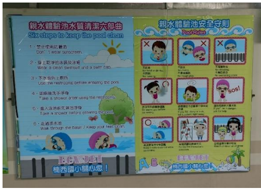
說明：親水體驗池環境布置