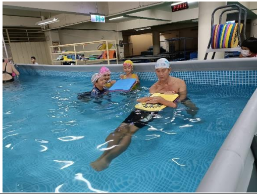
說明:教練帶領練習