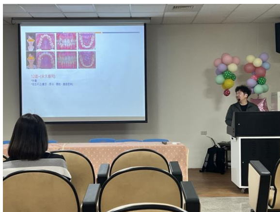
說明：參與教師分組進行深蹲演練