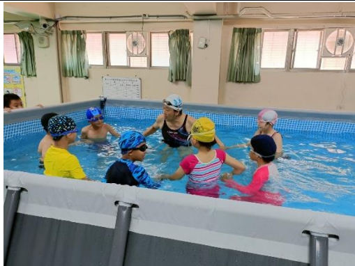
說明:基礎班韻律呼吸