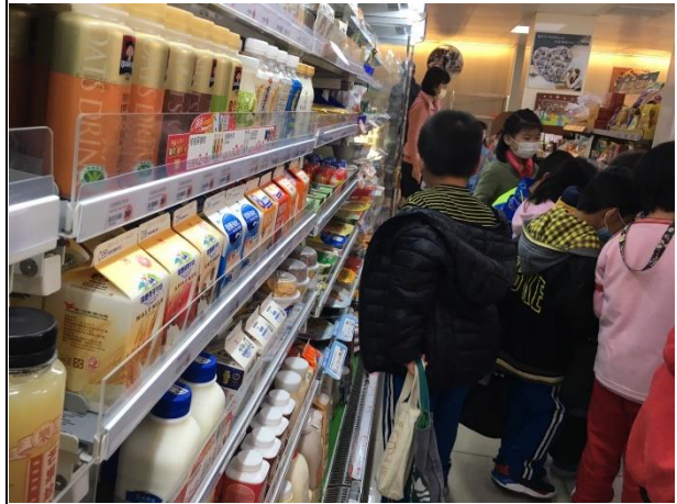
說明：選購健康食品