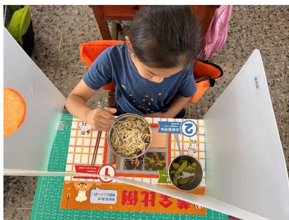
說明：午餐餐墊使用