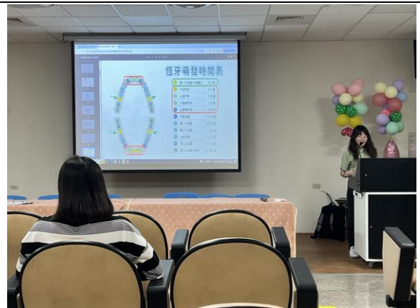
說明：講師帶領校內教師進行有氧運動