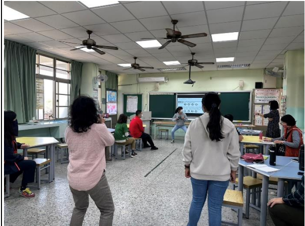
說明：講師示範深蹲動作