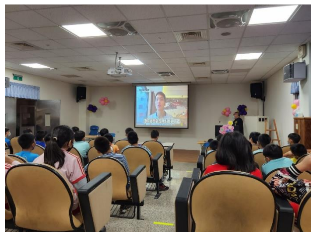
說明：奧運金牌來宣導