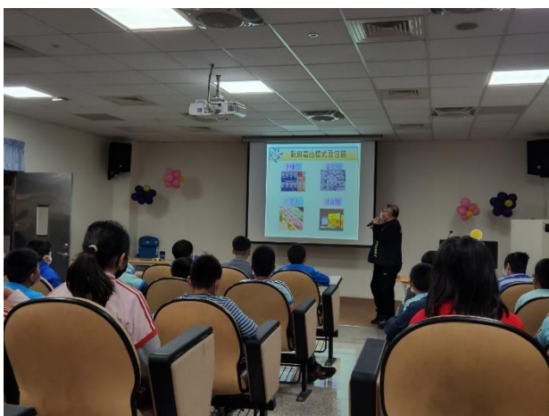
說明：新興毒品介紹