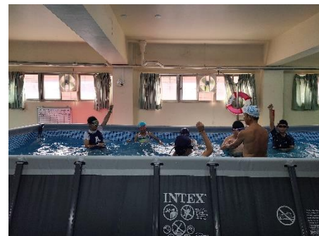
說明：游泳狀況檢視