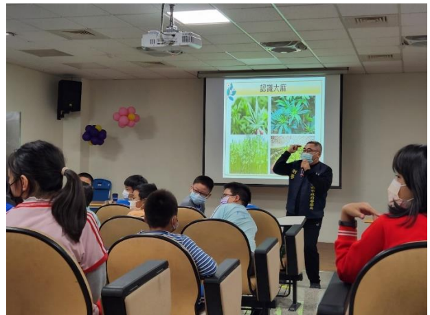
說明：吸食大麻後成癮介紹