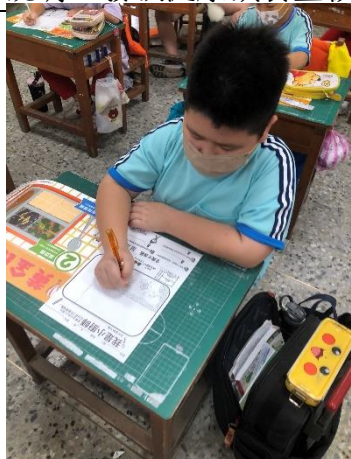
說明：學生繪製學習單