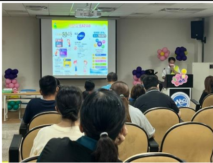
說明：班親會宣導 家長統一集合時間