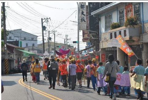
說明：結合社區活動—踩街迎聖火