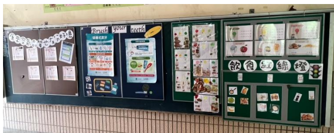
說明：雙語健康佈告欄