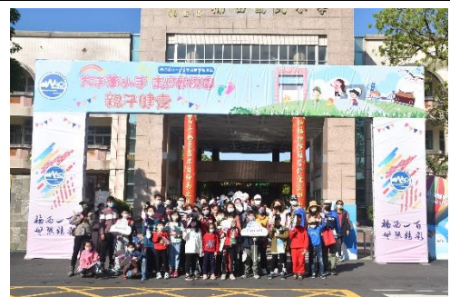
說明：結合社區活動—親子健走