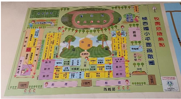
說明：校內危險地圖