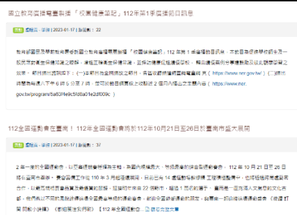
說明：學校網站公告