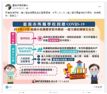
說明：學校粉絲專頁