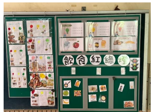
說明：雙語健康佈告欄