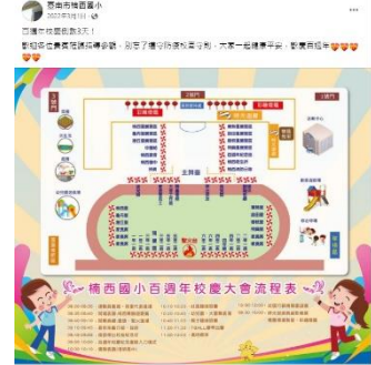
說明：學校粉絲專頁