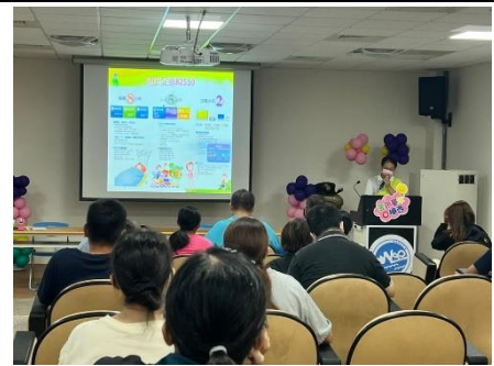
說明：新生家長座談會