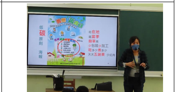
說明：低碳飲食介紹