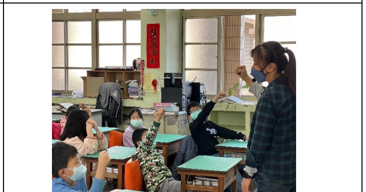
說明：食物份量說明