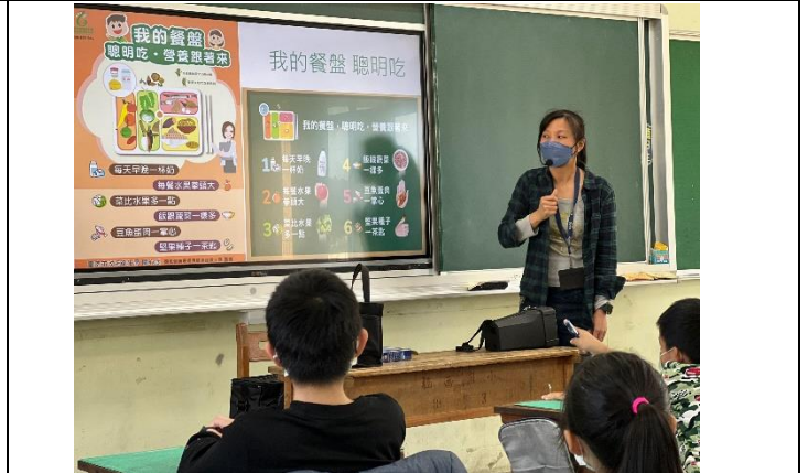
說明：營養餐盤選擇