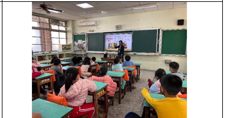
說明：食物分類介紹