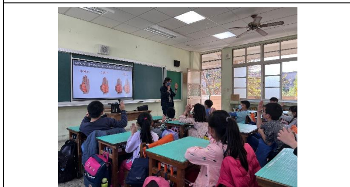
說明：六大類食物說明