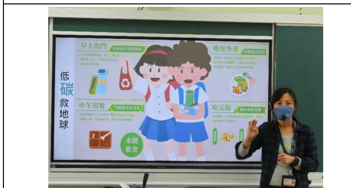
說明：每日用餐檢核