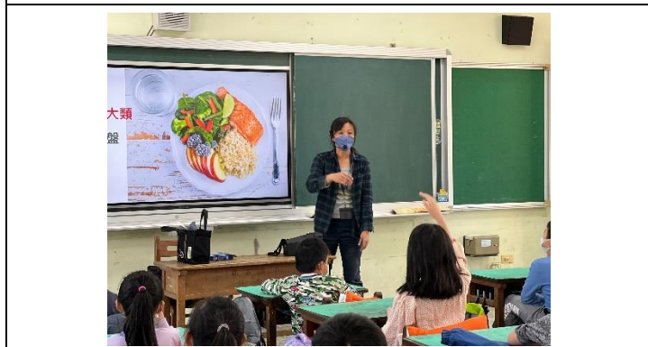
說明：我的餐盤健康吃