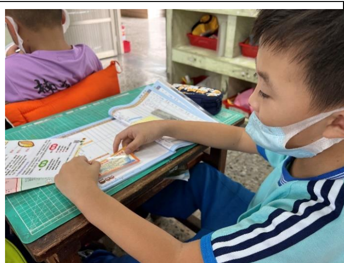
說明：聯絡簿宣導健康促進資訊