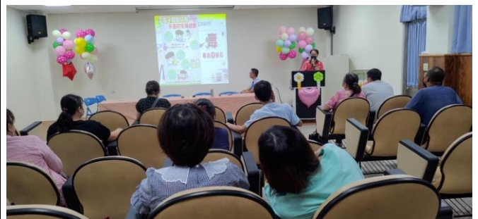
說明：家長日宣導健康促進資訊