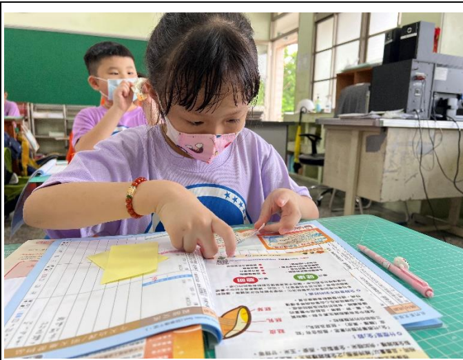
說明：聯絡簿宣導健康促進資訊