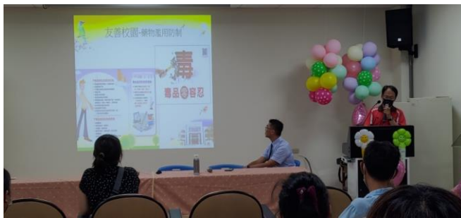
說明：家長日宣導健康促進資訊