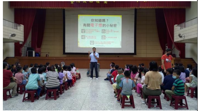
說明：開學典禮宣導健康促進資訊