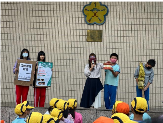
說明：學生朝會宣導健康促進資訊 —貝氏刷牙法介紹