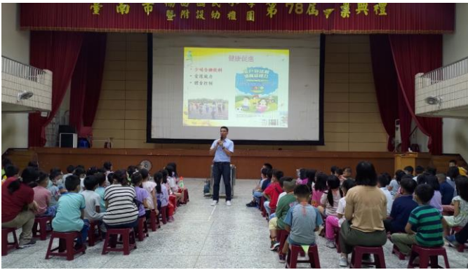
說明：開學典禮宣導健康促進資訊