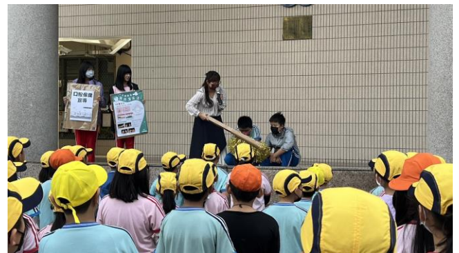
說明：學生朝會宣導健康促進資訊 —貝氏刷牙法重要性