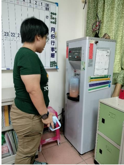
老師也要喝足白開水