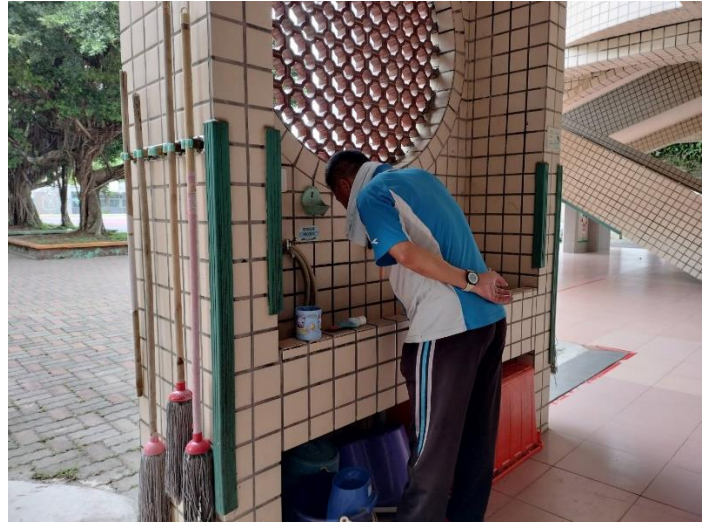
飯後一起和學生潔牙 1